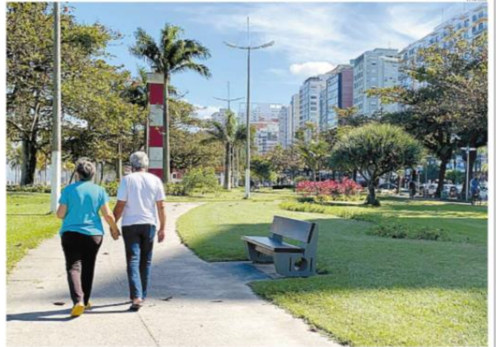
Idosos contam com várias opções de esporte e lazer na Baixada Santista para cuidar do corpo e da mente

Nas ruas de Santos, idosos ouvidos por A Tribuna comentaram o vem mudando