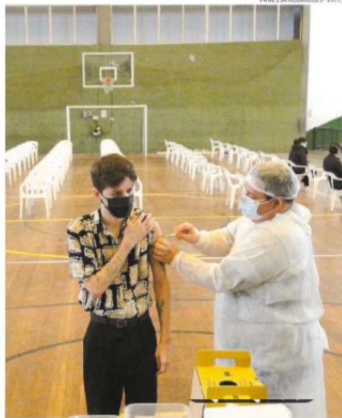
Em Santos, quem tem 25 anos ou mais pode procurar os postos

Já em Cubatão, jovens com 23 anos serão imunizados nas 10 Unidades Básicas