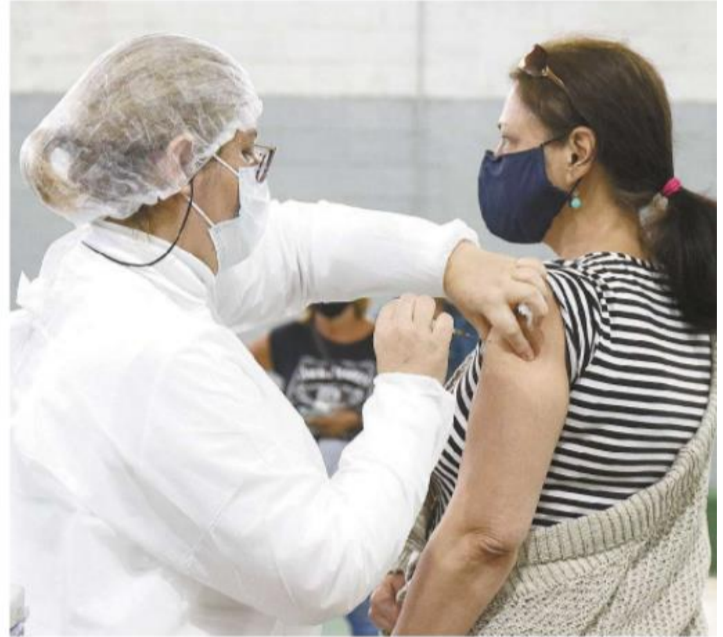
Um desafio a ser superado por autoridades é garantir adesão dos mais jovens à vacinação contra a covid