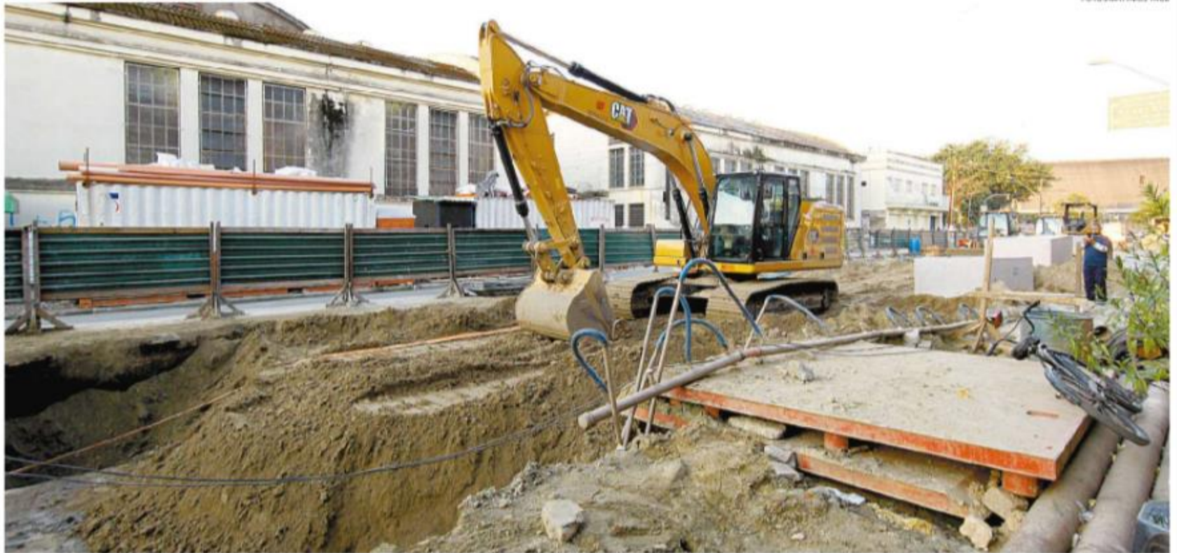
Atualmente, estão sendo feitas obras de drenagem ao lado do Mercado Municipal de Santos, na Vila Nova. A partir de hoje, será interditado trecho da Rua Sete de Setembro

"Por onde o VLT passa, traz uma valorização imediata de 40%. Ou seja, valorizando a cidade de Santos e, agora, uma área que sofre certa degradação. Esse será um dos incentivos ao desenvolvimento econômico da região central. Quando a gente fala em moradia, universidades e entretenimento, temos que ter transporte de qualidade e o VLT é o que há de mais moderno".