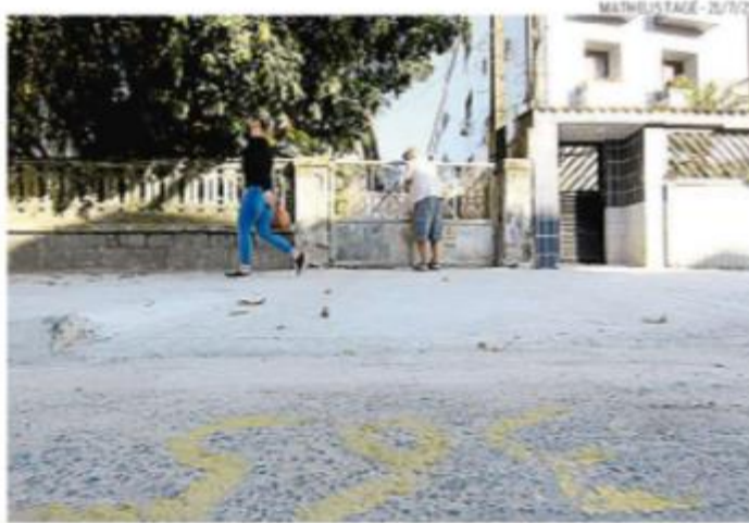
A Rua Cunha Moreira já recebeu marcações nas últimas semanas

um estudo em andamento, sob supervisão da Secretaria Municipal de Finanças (Sefin), para verificar a viabilidade da alteração, discutida por conta das obras de ampliação do Veículo Leve sobre Trilhos (VLT) na Cidade.