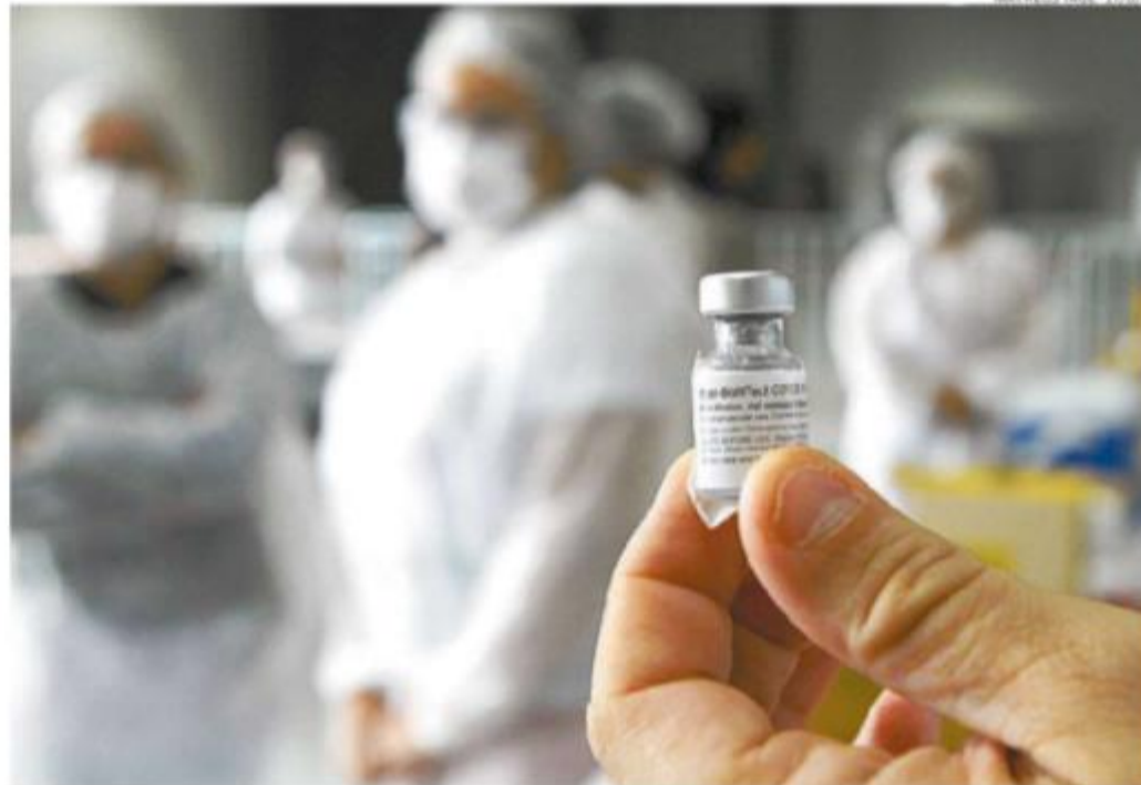
Informações surgiram no dia em que o governador João Dória cobrou mais doses da Pfizer para 2ª dose