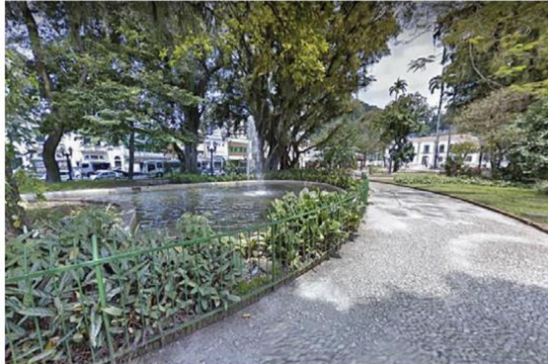
Imagens obtidas pelo Diário mostram a imensidão da fonte retirada e que fazia parte da história da Praça dos Andradas, em Santos