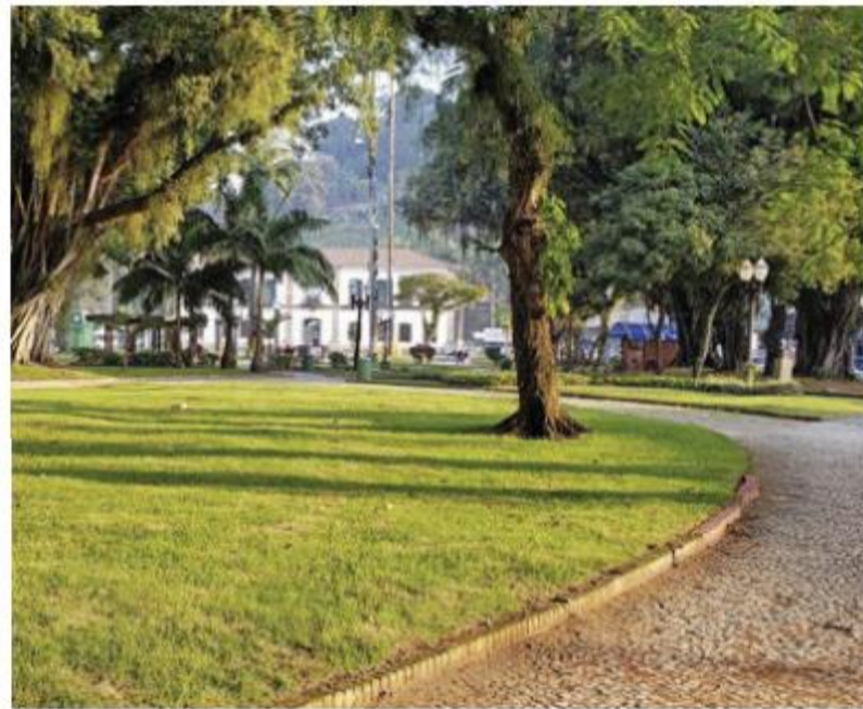
No local da antiga fonte, a Prefeitura colocou grama, que ainda dá sinais de crescimento

Praça e tudo que há nela integram o tombamento do prédio da antiga Casa de Câmara e Cadeia (Velha) pelo IPHAN e CONDEPHAAT, que não foram consultados