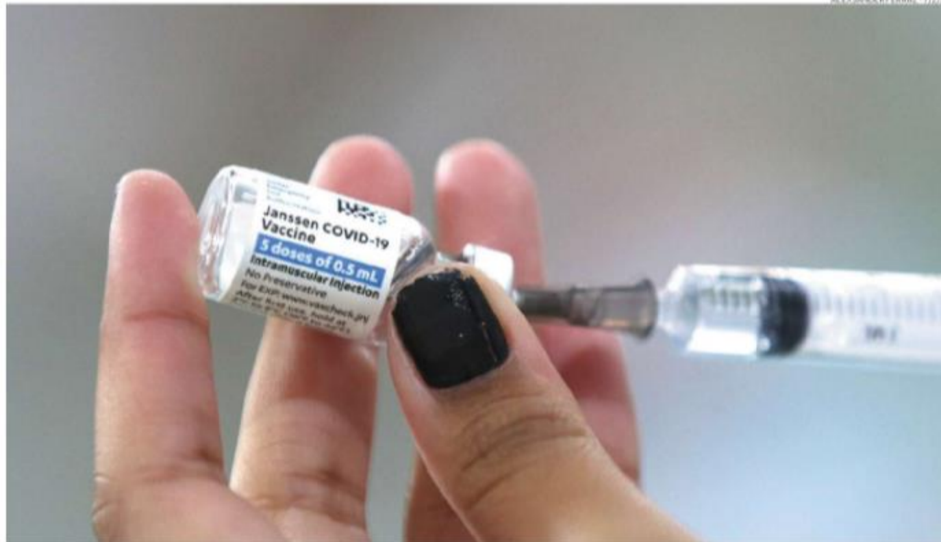
Secretaria Municipal de Saúde fará um levantamento para identificar trabalhadores que já foram imunizados e os que ainda não se vacinaram

A obrigatoriedade da vacinação pode ser comparada ao uso de equipamentos de proteção individual (EPIs) por trabalhadores da construção civil. Quem trabalha sem a devida proteção corre riscos e a legislação prevê que o empregador pode demitir os colaboradores que se recusam a usar os equipamentos dessa natureza.