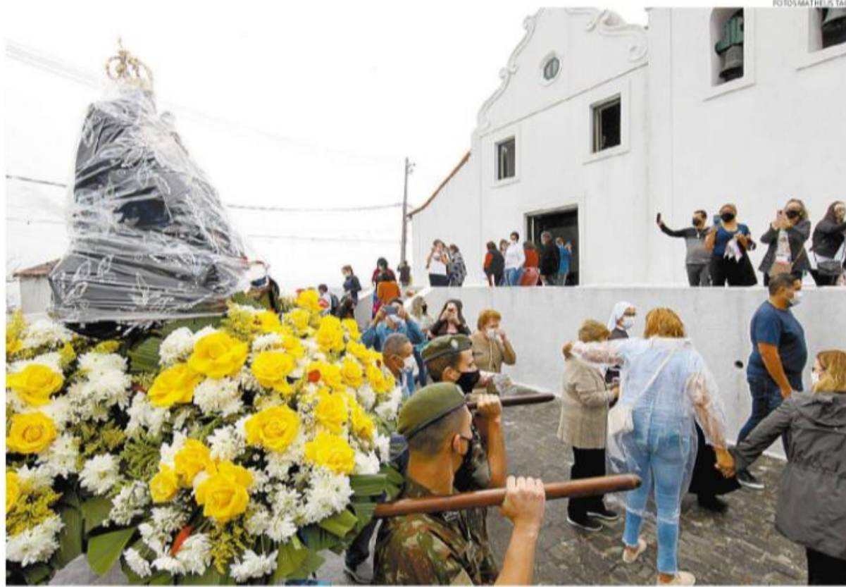
Na tarde de ontem, apesar da chuva, a imagem deixou o santuário no Monte Serrat e seguiu em carreta por ruas e avenidas de Santos