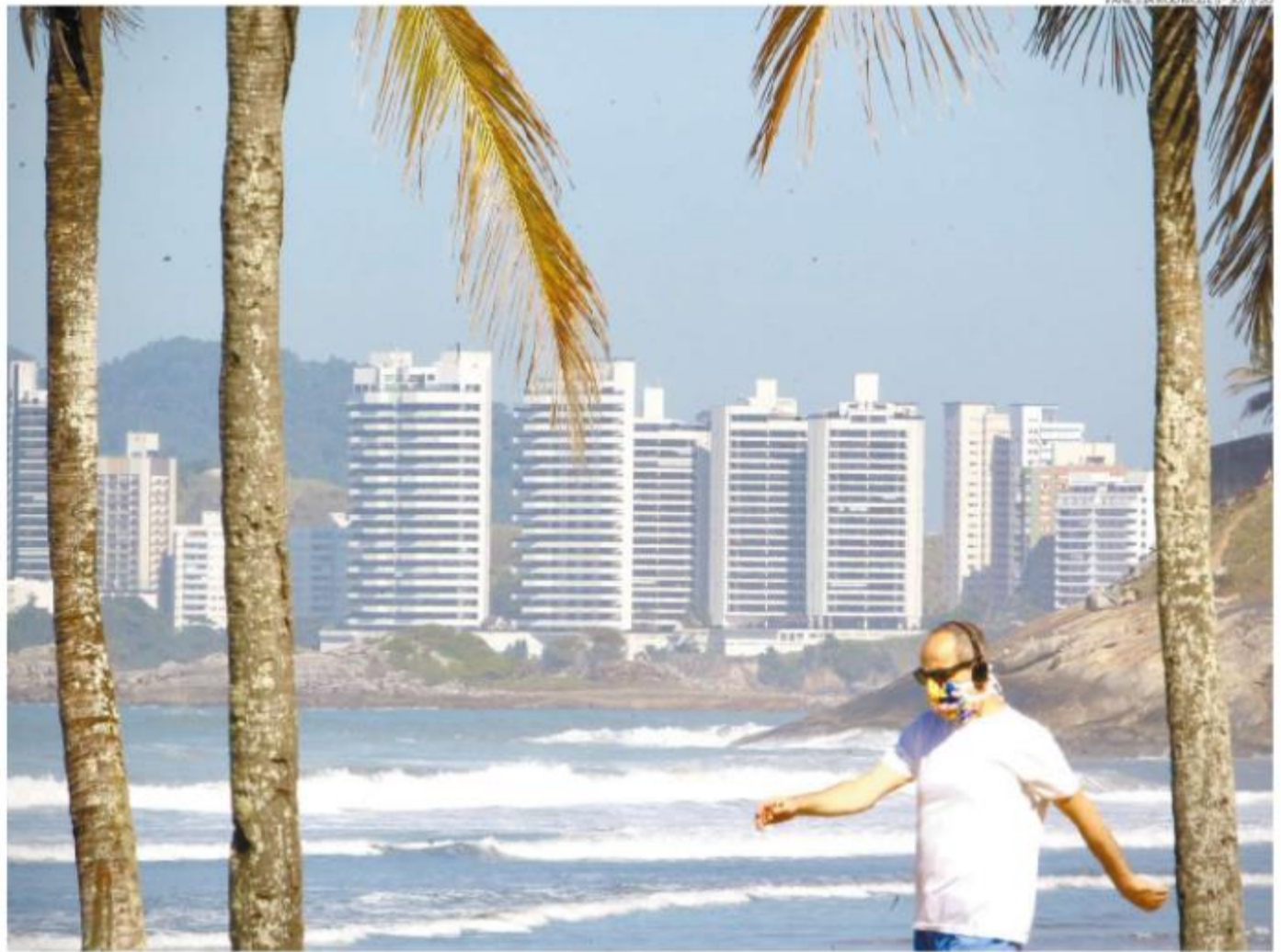
As praias devem ser procuradas por quem estiver em busca de momentos de lazer, mas autoridades se preocupam com o novo coronavírus

A Cidade afirma trabalhar junto ao setor de turismo para que os protocolos sejam respeitados. A caute-