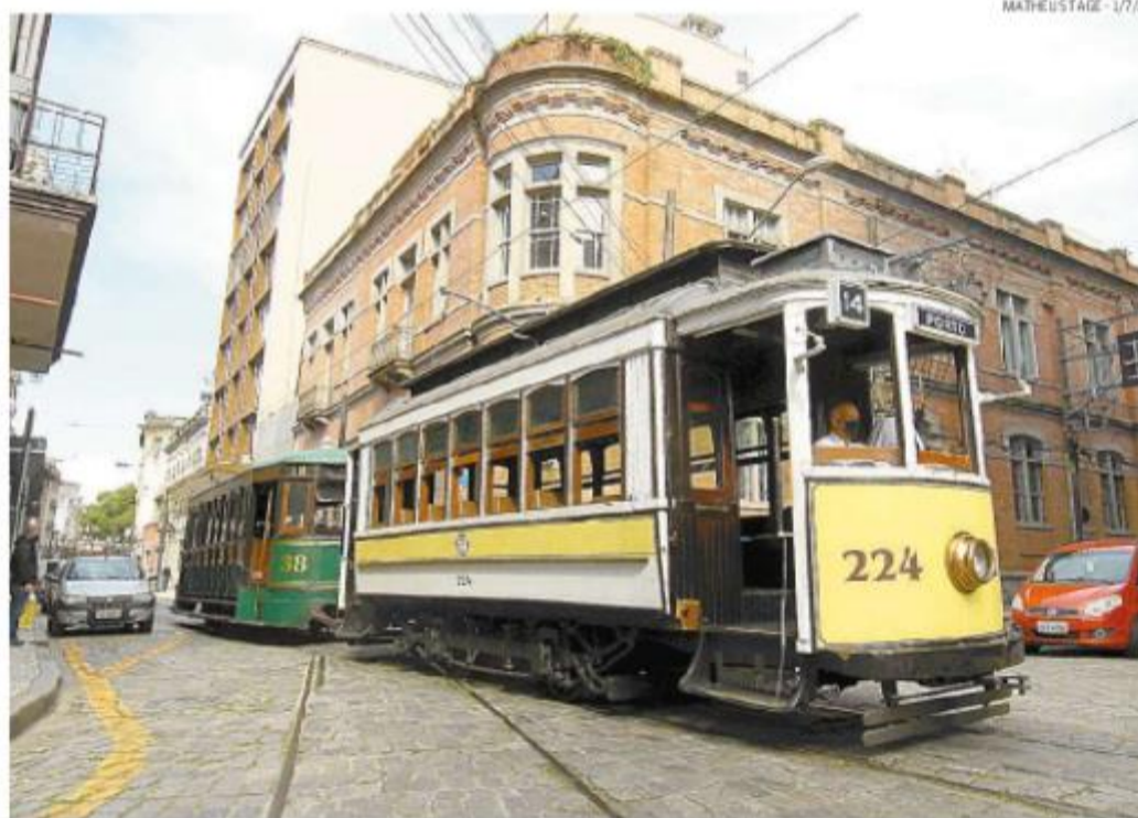
Na semana passada, bondes de Santos voltaram a circular nos dias e horários dos tempos pré-pandemia

la fica evidente no momento em que, questionada sobre os eventos que podem ser realizados no próximo verão, como o Réveillon e o Carnaval, a Administração reforça que a pandemia e novas variantes “impossibilitam, neste momento, fazer prognóstico detalhado”.