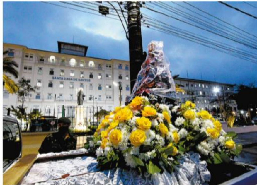
Carreata também passou na porta de hospitais de Santos, levando fé e esperança a funcionários e pacientes