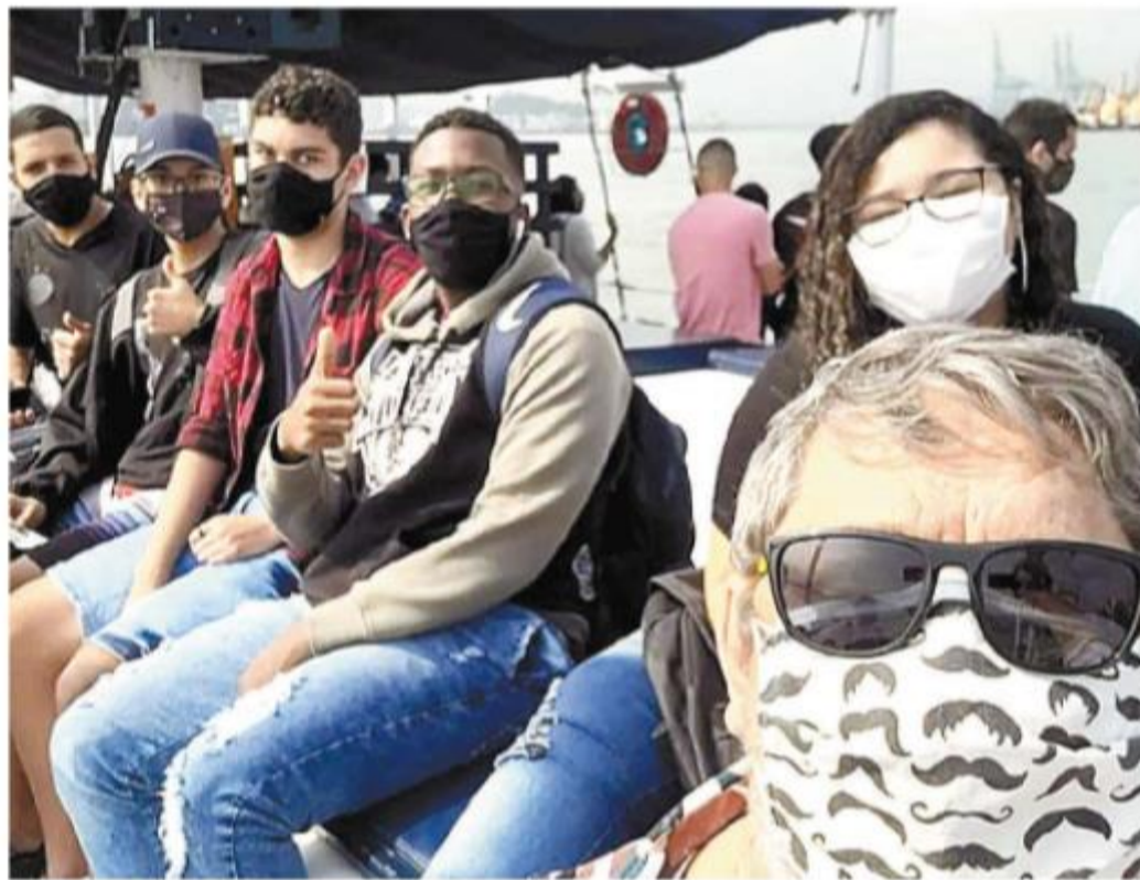
Mais de 200 alunos demonstraram interesse em uma excursão pelo canal de navegação do Porto de Santos

“A gente sabe que, nesta fase, o que eles (jovens) mais querem é ter relacionamentos pessoais, ter a sua turma da classe. Tanto que muitos relatam essa dificuldade no ambiente virtual, nem ligam a câmera. Existe uma turma de Ensino Médio que entrou no início deste ano que não tinha nem se conhecido pessoalmente, ainda. Nem nós, professores, os conhecemos. Eu, que já tomei as duas doses da vacina, percebi que as coisas estão um pouco mais tranquilas, e a escuna é um lugar aberto, arejado. A adesão foi muito grande, tanto que tive que dividir em dois dias”, disse.