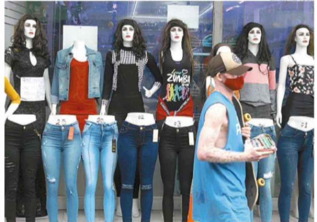
Infectologistas pedem cautela à população diante de indicadores que apontam queda de mortes por covid

Praia Grande teve o maior número de óbitos em 24h: quatro. Santos confir-