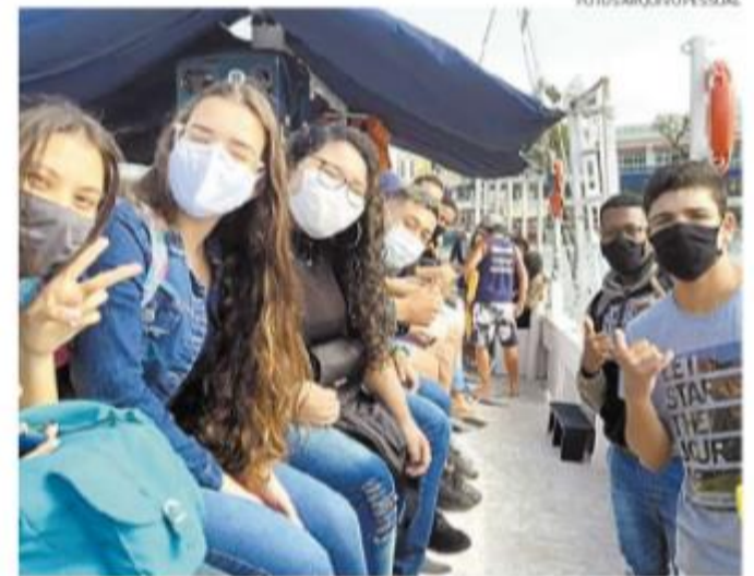
Olhos nos olhos, de forma inédita, mas sem abraços, devido à pandemia

que, como o atual prédio da Etec não tem janelas e a circulação de pessoas é intensa, a Comissão Interna de Prevenção de Acidentes (Cipa) e o Centro Paula Souza vetaram o retorno às aulas presenciais neste ano. Ele sugeriu à direção da Etec que se use o o auditório, onde seria possível ter aulas pessoalmente.