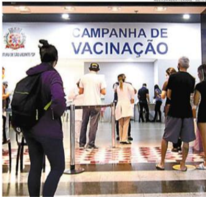
O Brisamar Shopping, no Centro, aplica doses da vacina das 9h às 20h