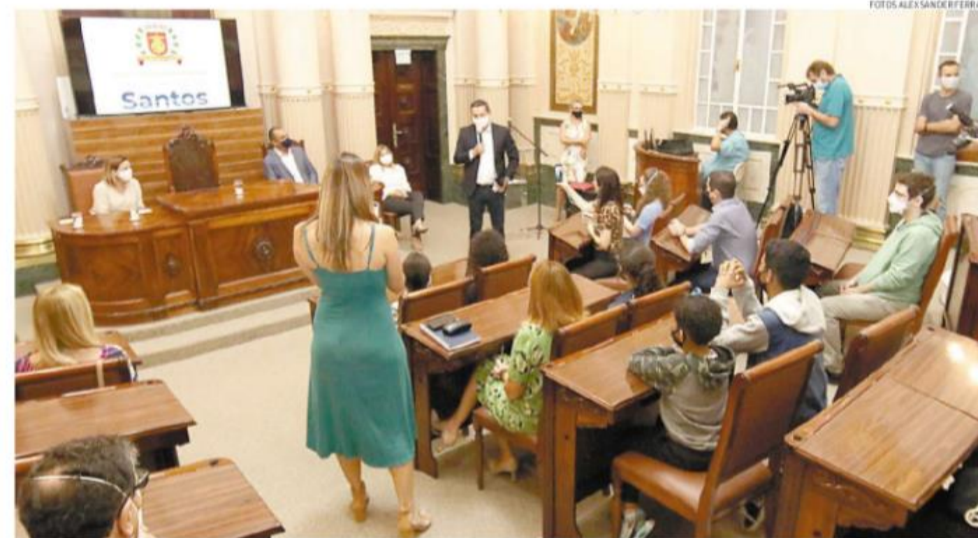
Projeto piloto de visita ao Palácio José Bonifácio ocorreu ontem, com estudantes do colégio que recebe o nome do patriarca da Independência

O roteiro, com duração de uma hora, terá supervisão de guia de turismo e mostrará detalhes e curiosidades do edifício, inaugurado em janeiro de 1939. Entre os destaques, estão o Sa-