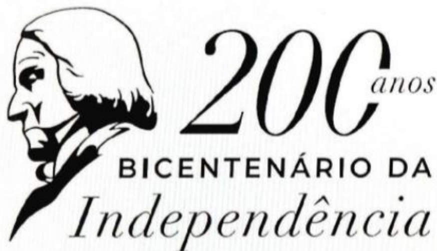
Logomarca com o perfil de José Bonifácio de Andrada e Silva ilustrará documentos e eventos municipais

Além disso, os visitantes poderão conhecer os recursos tecnológicos do Centro de Controle Operacional (CCO). O equipamento entrou em operação há um ano para a integração de serviços públicos e forças de segurança em benefício do monitoramento da Cidade, de acordo com o Município.