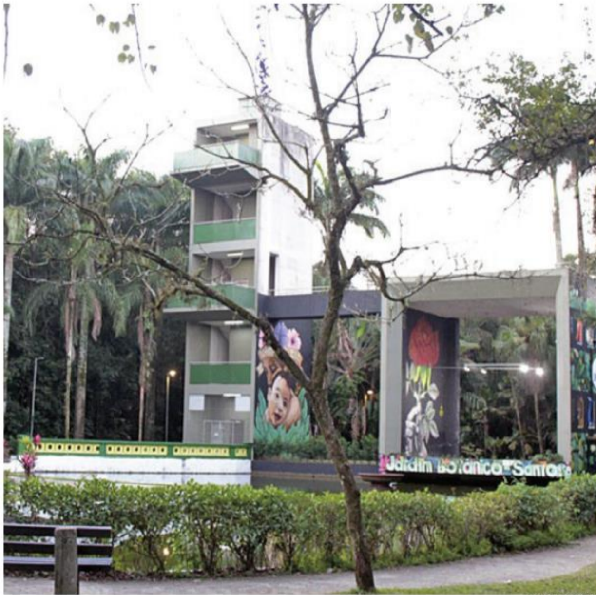
A falta de segurança dentro e fora do equipamento é apenas um dos problemas que tomam conta do Jardim Botânico Chico Mendes

Os guardas alertam que é comum a extração de frutos, mudas ou galhos sem as devidas autorizações e acompanhamentos e que tudo é feito por conta da dificuldade de visualizar. Em regra, o guarda fica rondando e não consegue impedir já que o parque é imenso e possui duas entradas. "Já foram apreendidos 15