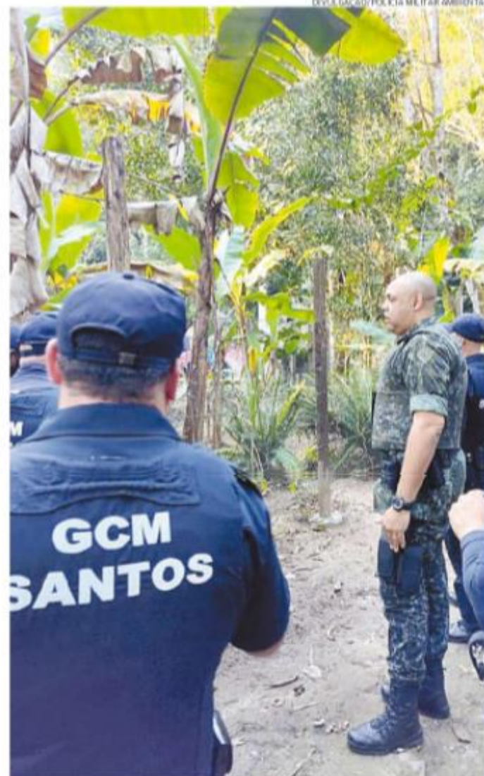
GCM atuará, por exemplo, em demandas sobre áreas de preservação

Outra mudança tem a ver com a proteção animal. A Guarda Municipal atenderá ainda demandas de animais abandonados. "A capacitação envolve o primeiro atendimento para, depois, ser feito o encaminhamento para entidades que abrigam esses animais", menciona.