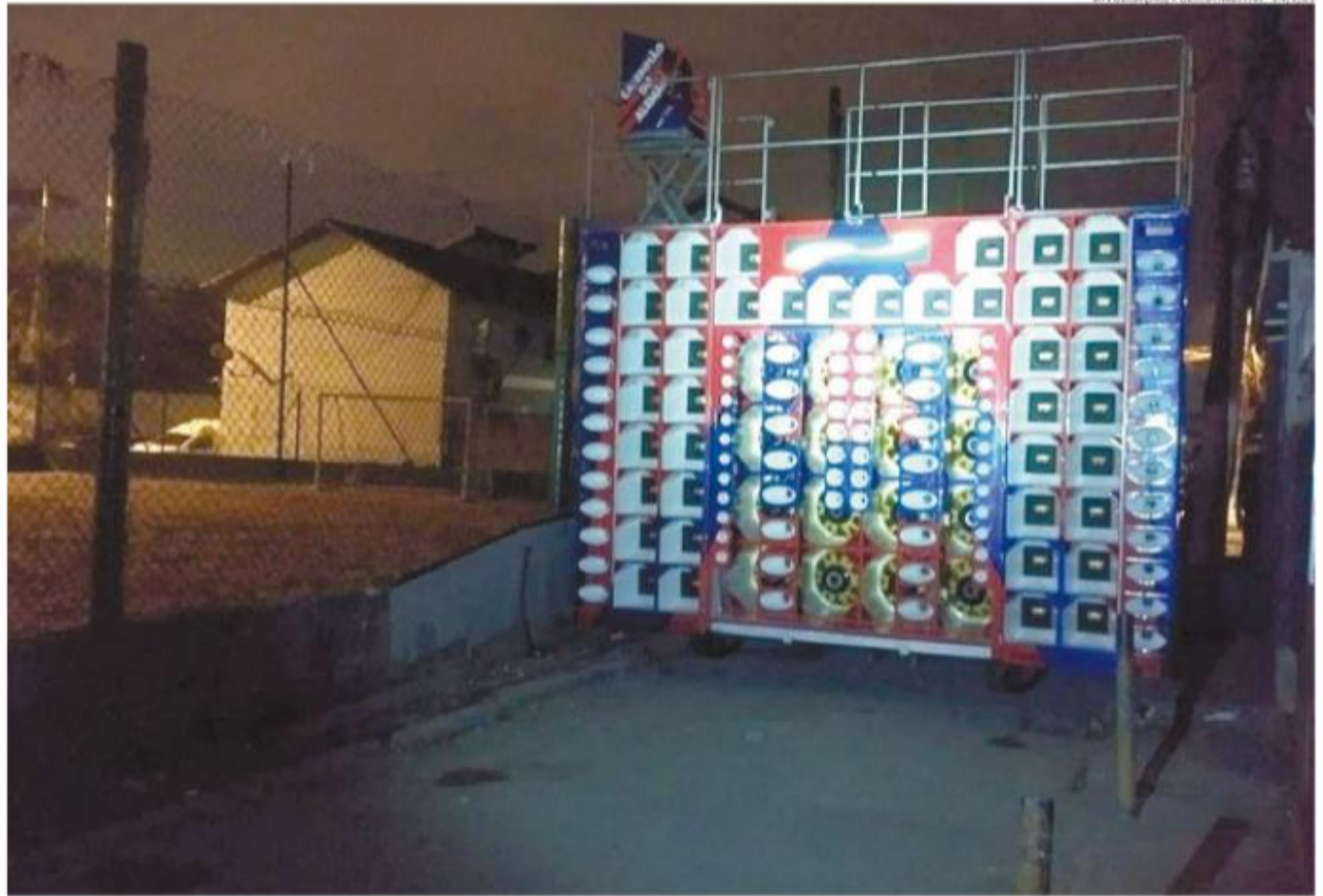
A nova lei classifica, como perturbação do sossego público, o barulho provocado por aparelhos sonoros instalados sem licença da Prefeitura

A Prefeitura não respondeu se tem efetivo suficiente nem quais são os critérios que classificam o som como perturbação do sossego.