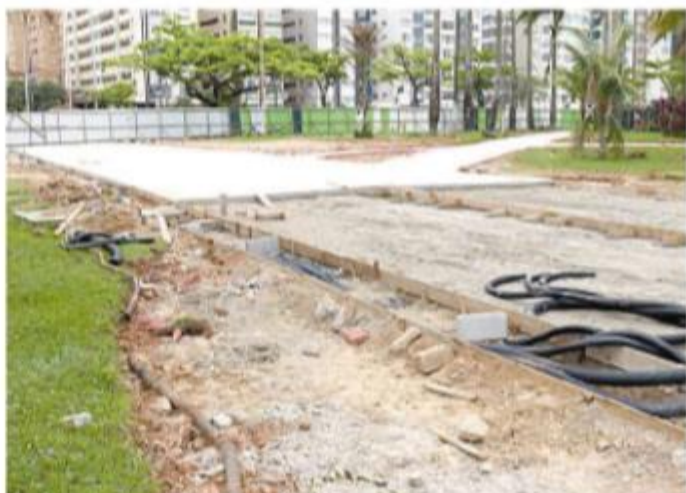
Já se está remodelando a parte do jardim mais próxima à ciclovia...

Outra novidade é a pista de pump track – pista de asfalto para praticantes de ciclismo e skate.