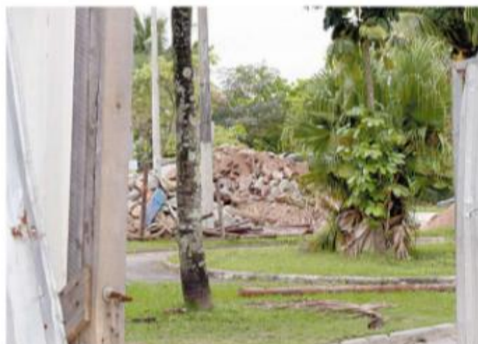
... que inclui paisagismo e instalações subterrâneas para cabos e tubos

sos municipais. O valor, porém, pode ser reduzido, porque a concorrência pública prevê a escolha de quem oferecer o menor preço pa-