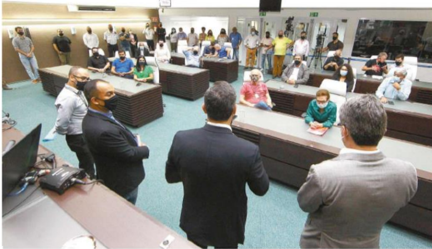
Montante previsto para investimentos em obras e equipamentos municipais equivalerá a 12% da peça orçamentária, diz o chefe do Executivo

Também fazem parte dessa lista de intervenções a revitalização do Parque Roberto Mário Santini, no José Menino — fruto de um convênio firmado com o Governo do Estado —, a cons-