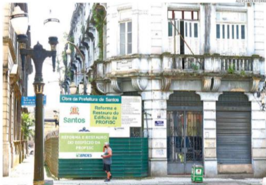
A previsão é de que os serviços, com reforço em pilares, lajes e vigas, comecem dentro de um mês

A previsão é de que os serviços, com reforço em pi-