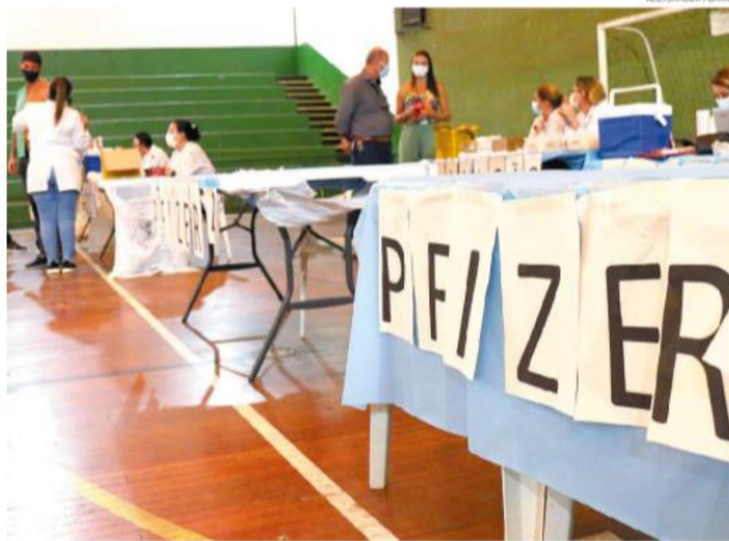
No Complexo Esportivo Rebouças, na Ponta da Praia, por volta das 10h30 de ontem, não se viam filas

"Elas estão descobertas, principalmente, contra a variante Delta. Só com segunda dose é que as pessoas terão imunização completa. O único mecanismo efetivo para conter essa variante é a velocidade vacinal. Quanto mais rápido a gente completar o esquema vacinal, menos propagação do vírus vai ter".