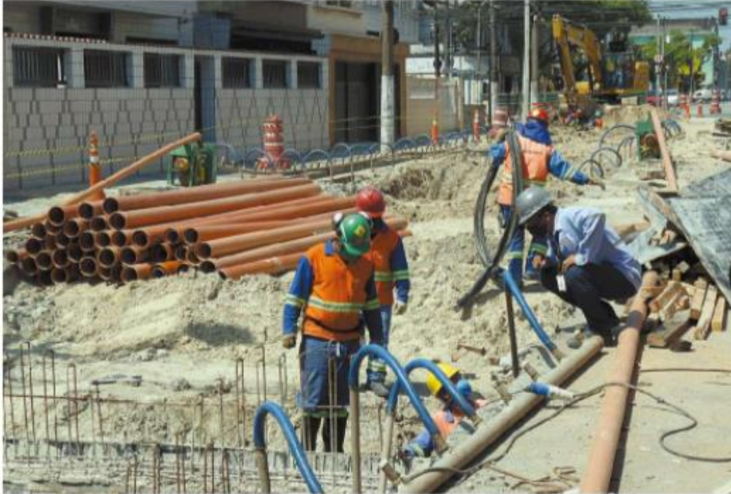
Obras do Veículo Leve estão na altura da Rua Campos Melo e da Avenida Conselheiro Rodrigues Alves (foto)