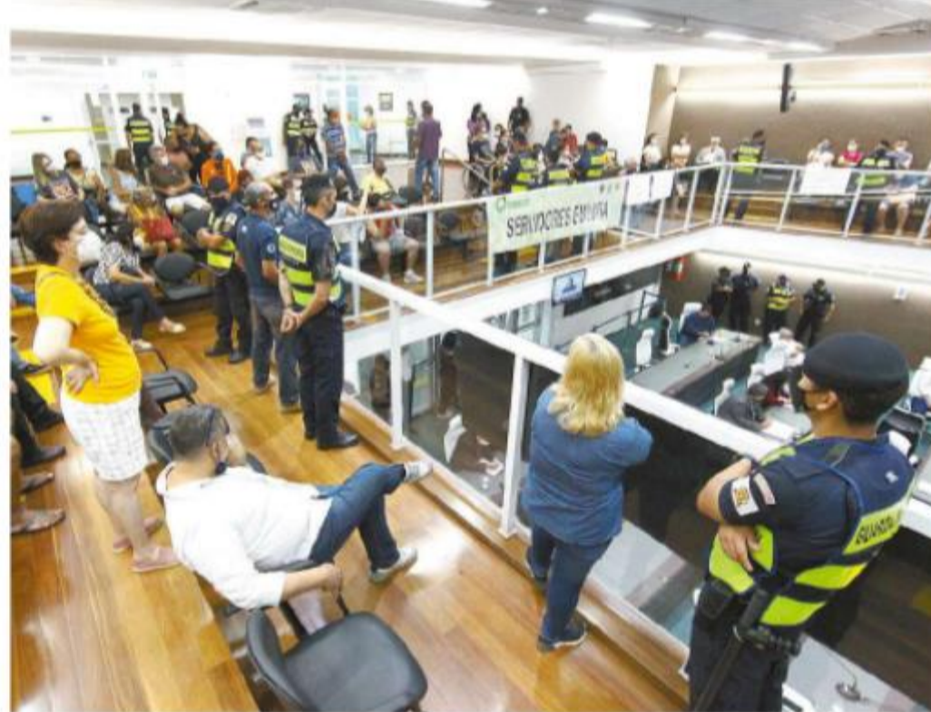
Galerias estavam cheias; projeto de lei do Executivo foi aprovado na sessão de ontem por 15 votos a cinco