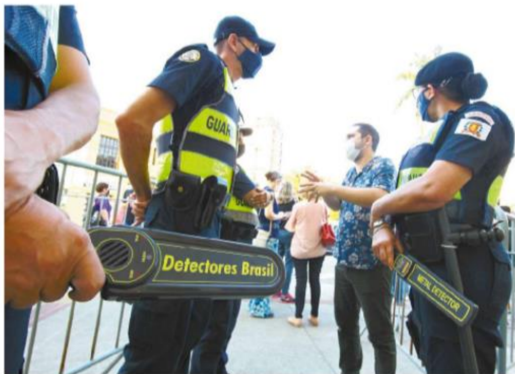
Para entrar no prédio do Legislativo, visitantes eram revistados e passavam por detector de metais