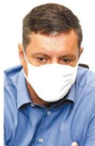
Prefeito: valorização dos bairros

"Alguns trechos precisam de autorização da Prefeitura de Santos para adentrarmos, e a gente tem respeitado. A Prefeitura também