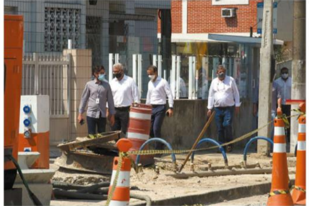
Representantes municipais e estaduais viram os serviços, que ocorrem no sentido Macuco/Encruzilhada