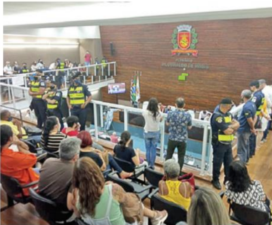
Mas a Prefeitura envia guardas municipais para a Câmara de Vereadores com medo dos servidores

Guarda: "O Centro de Controle Operacional (CCO) é mais utilizado para vigiar o trabalho dos guardas do que os equipamentos públicos"