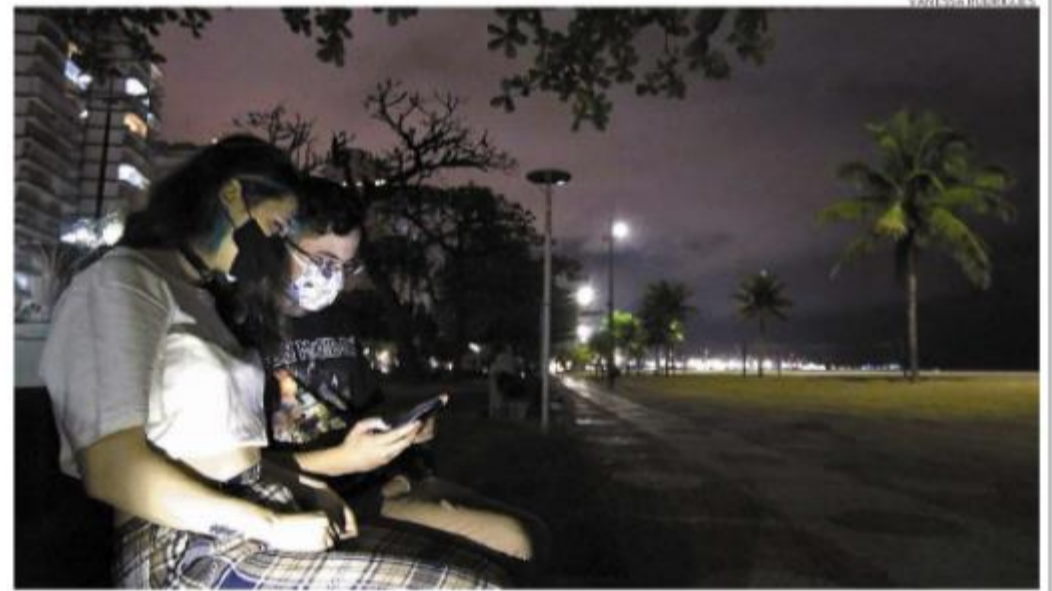
Iluminação parcial tem vindo de edifícios à beira-mar e de celulares de frequentadores, quase às escuras

Conforme o Município, a reativação na faixa de areia será por etapas. Depende da realização dos serviços de recuperação da infraestrutura e da instalação de dispositivos de proteção pa-