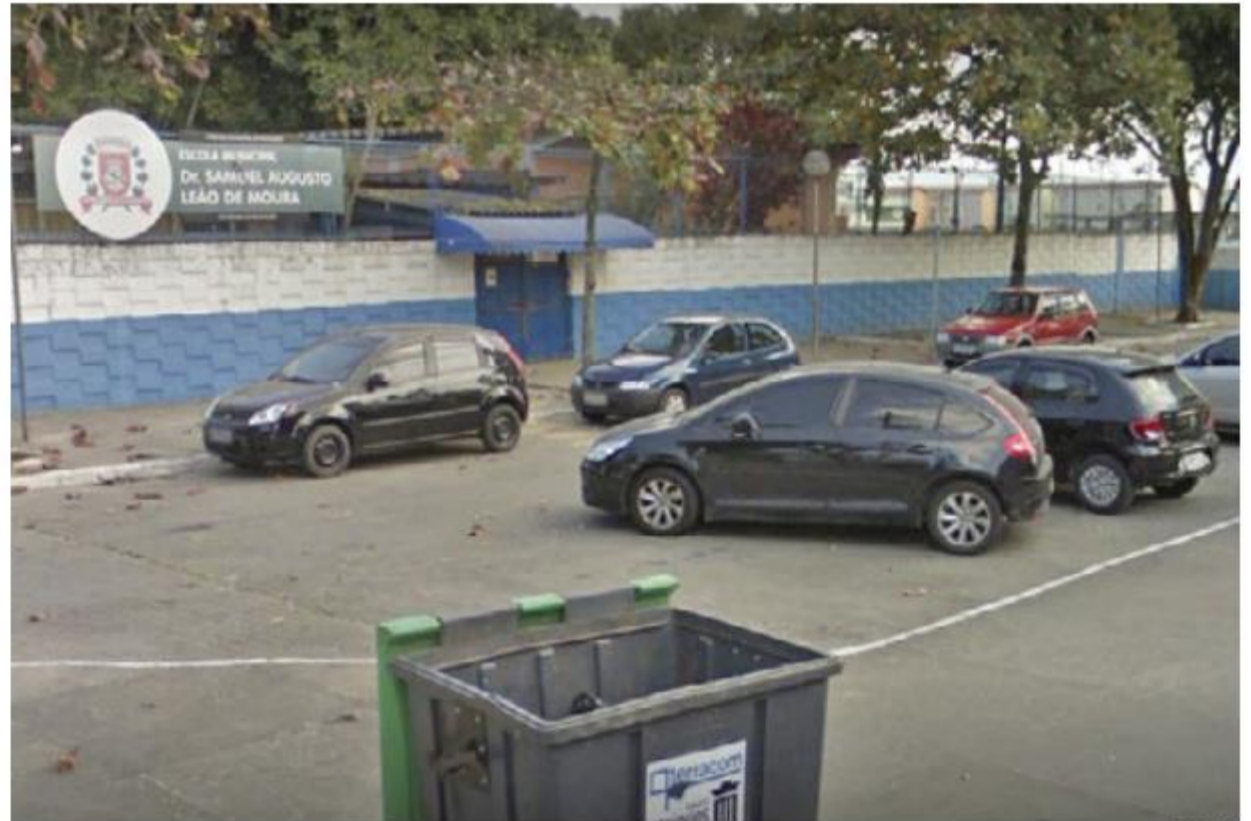
Desde a última quarta, alunos da Unidade Municipal de Ensino (UME) Samuel Augusto Leão Moura estão sem aula por causa dos furtos

A escola vai ficar à disposição para atender os alunos que não puderem permanecer em casa e as aulas presenciais serão retomadas assim que o serviço de recolocação dos fios que foram furtados estiver concluído.