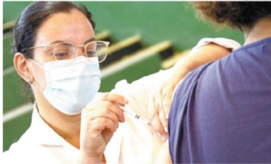
Cidade continua aplicando segunda dose do imunizante e a de reforço para determinados públicos