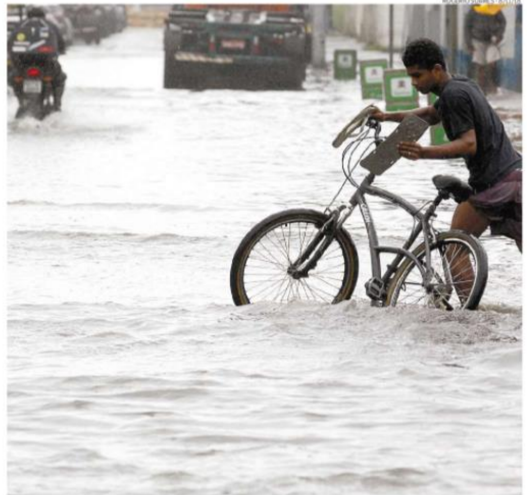
Regiões sob risco de inundações motivam preocupação das prefeituras, que planejam evitar desastres

Itanhaém informa que realiza o planejamento de ações de assistência a possíveis moradores em áreas de risco, sem detalhar os locais. Guarujá também não apontou as áreas de maior risco.