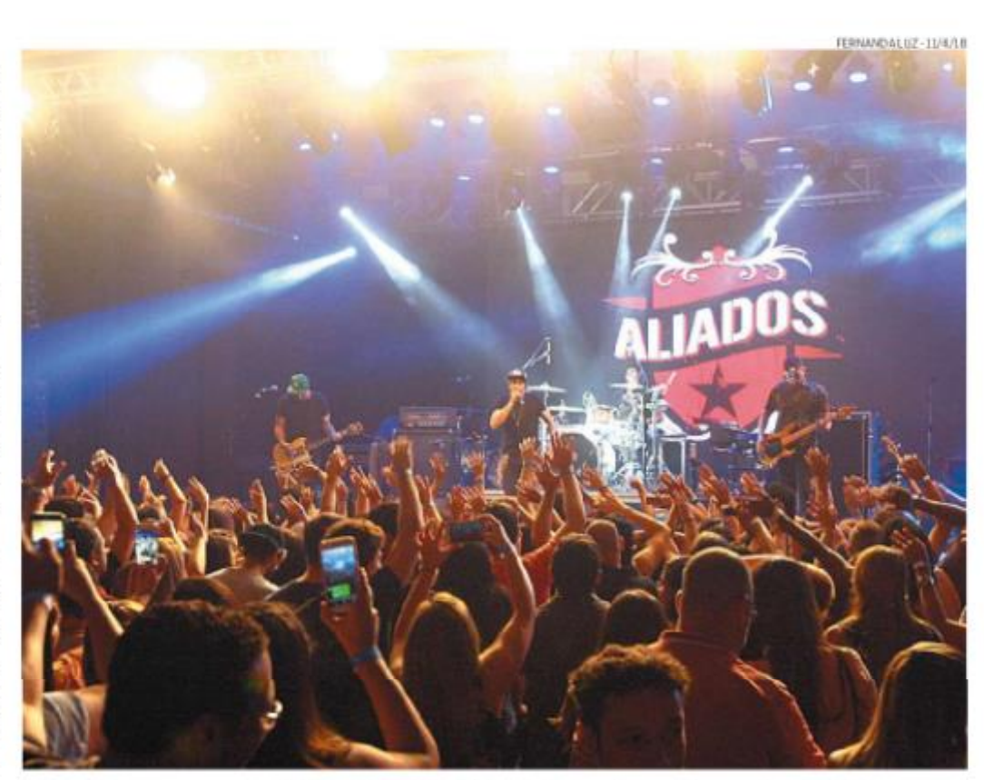
Governador sugere que capacidade máxima de público onde possa haver aglomeração seja 30% menor

"Após a constatação de uma alta elevação no número de casos de coronavírus em São Paulo e deliberação dos médicos que compõem o Comitê Científico do Estado, o Governo decidiu recomendar que organizadores de eventos públicos, especialmente os musicais e esportivos, reforcem medidas preventivas para evitar a disseminação da covid",