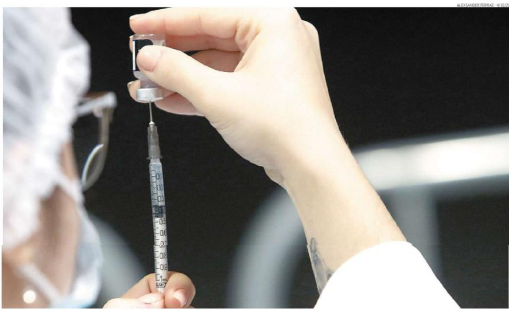
Imunizante será da Pfizer, em versão pediátrica e com doses inferiores às que são aplicadas nos demais públicos. Já é possível cadastrar crianças no VacinaJá (vacinaJa.sp.gov.br)

Ainda na coletiva, o governador João Doria (PSDB) disse que já está disponível o cadastro de crianças na plataforma VacinaJá, que tem como objetivo agilizar