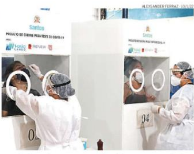
Na Baixada Santista, 3.311 exames de covid-19 esperam resultado

O número de internados nos leitos de unidades de Terapia Intensiva (UTIs) subiu de 42 para Entre os 97 leitos de UTI, a ocupação é de 56%. Na rede SUS, a taxa é de 64% e, na particular, de 49%.(BA)