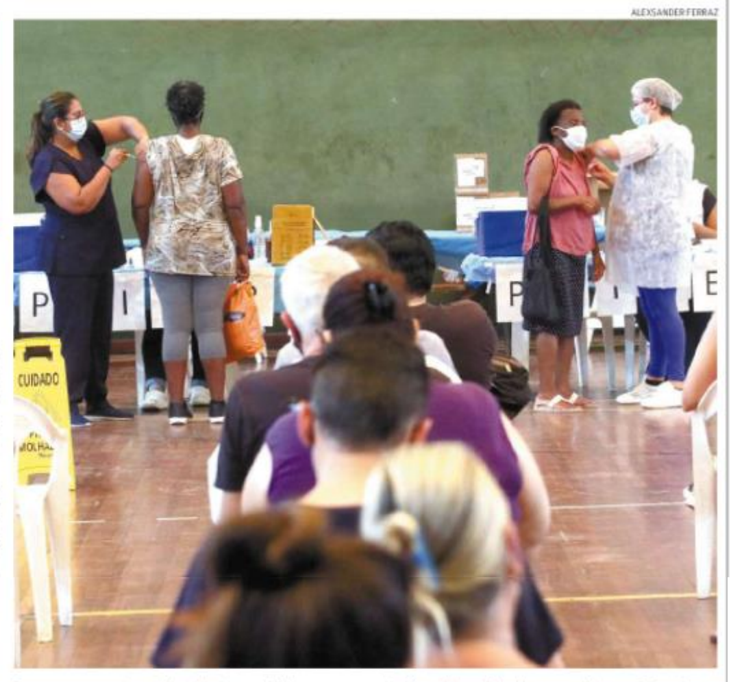
Procura crescente por imunizantes coincide com aumento de confirmações de coronavírus na Baixada

"Temos aplicado (as doses) em turistas que vieram para cá e não estão com o esquema vacinal completo. Não adianta proteger só os municipes (...). Do Natal para cá, 10% do público que tomou a terceira dose é composto por pessoas de fora de Peruíbe.