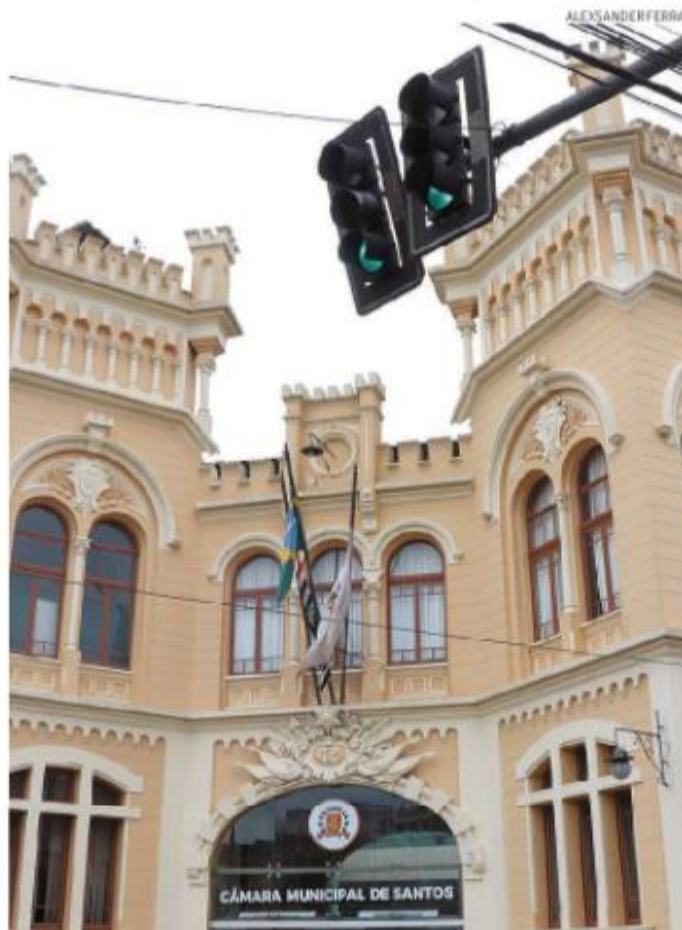
Santos é a única na região a promover duas sessões por semana