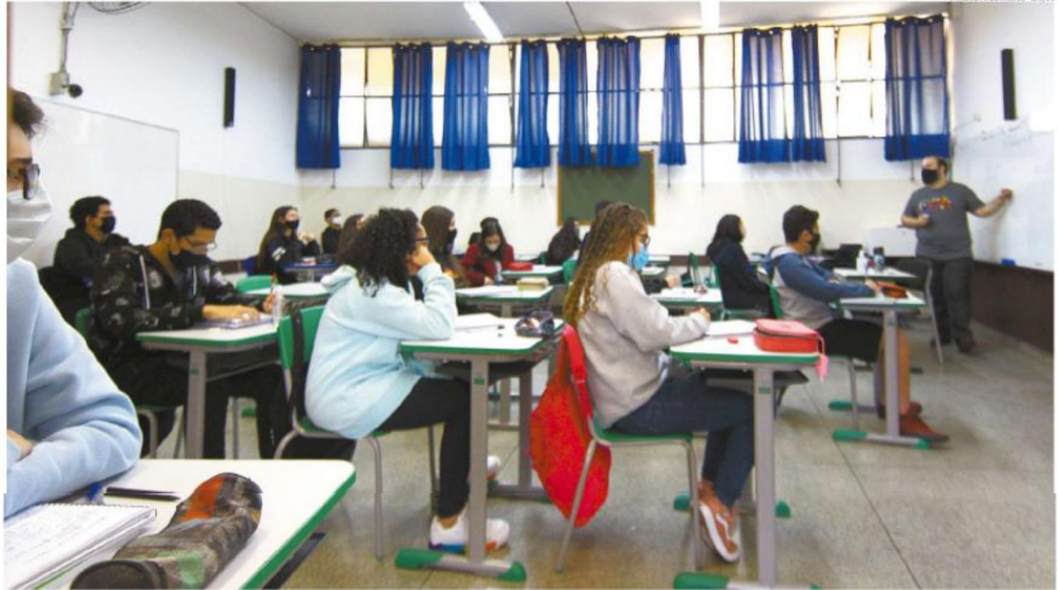
Retomada das aulas nos colégios estaduais da região será totalmente presencial e continuando a seguir protocolos de saúde, como a utilização de máscaras e de álcool em gel

Uma resolução publicada no Diário Oficial do Estado do último sábado determina que o responsável legal dos estudantes matriculados na rede pública estadual de ensino deverá apresentar o documento comprobatório de vacinação completa contra a covid-19 ou atestado médico que evidencie contraindi-