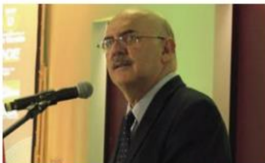
MAR BUENOS DIÁRIO DO LITORAL

Santistas de destaque. O cidadão santista e ministro da Educação do Governo de Jair Bolsonaro, Milton Ribeiro, volta a ser destaque nacional. Agora, não por suas falas homofóbicas, mas por permitir interferência pouco republicanas em sua pasta. Conforme o Estadão, numa conversa gravada, o ministro admitiu que prioriza o atendimento a prefeitos que chegam ao ministério por meio dos pastores Arilton Moura e Gilmar Santos.