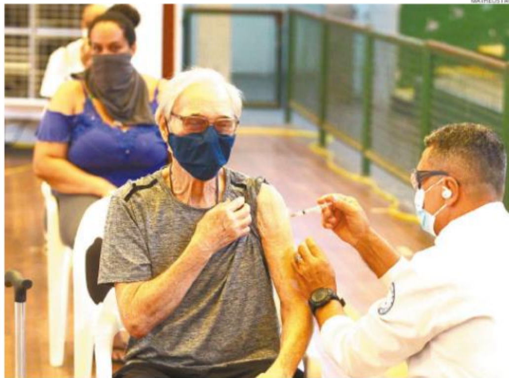
Também em Santos, começou ontem a oferta da quarta dose a maiores de 80 anos: foram 982 aplicações

Há 2.364 casos suspeitos de contaminação em investigação aguardando resultados de exames. O número de pacientes considerados recuperados na região está em 186.774.