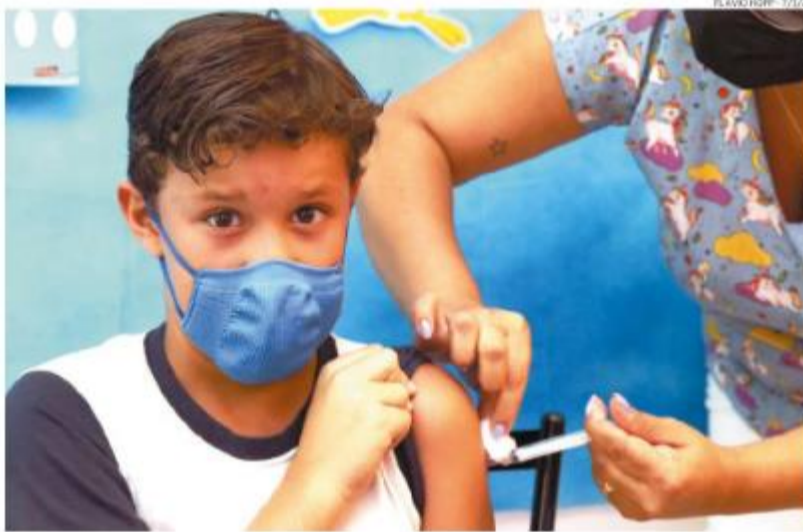
Vacinação contra coronavírus está disponível, inclusive para crianças, em postos de saúde da Baixada