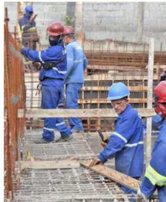
O sistema contra enchentes do programa de macrodrenagem Santos Novos Tempos entrará em funcionamento em janeiro

Na obra são investidos R$ 37,5 milhões, sendo R$ 22 milhões oriundos de empréstimo do FGTS (Programa Avançar Cidades), supervisionado pela Caixa Econômica Fede-