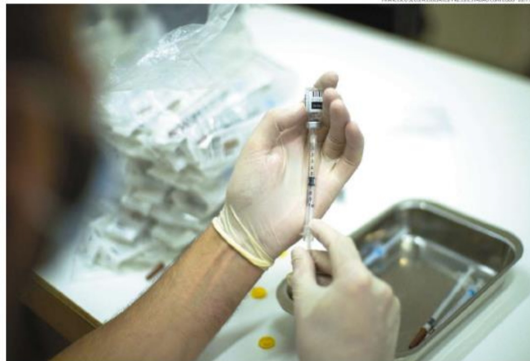
Há vacina contra a doença, mas ela é produzida na Dinamarca e não está disponível no Brasil. Estados Unidos e União Europeia também esperam

"É importante manter as medidas de higiene, como lavar as mãos, usar álcool em gel, utilizar máscaras