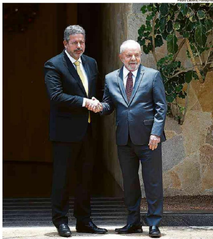
Lula cumprimenta Arthur Lira após reunião na residência oficial da Presidência da Câmara

No Qatar, seleção brasileira volta a desafiar domínio europeu neste século