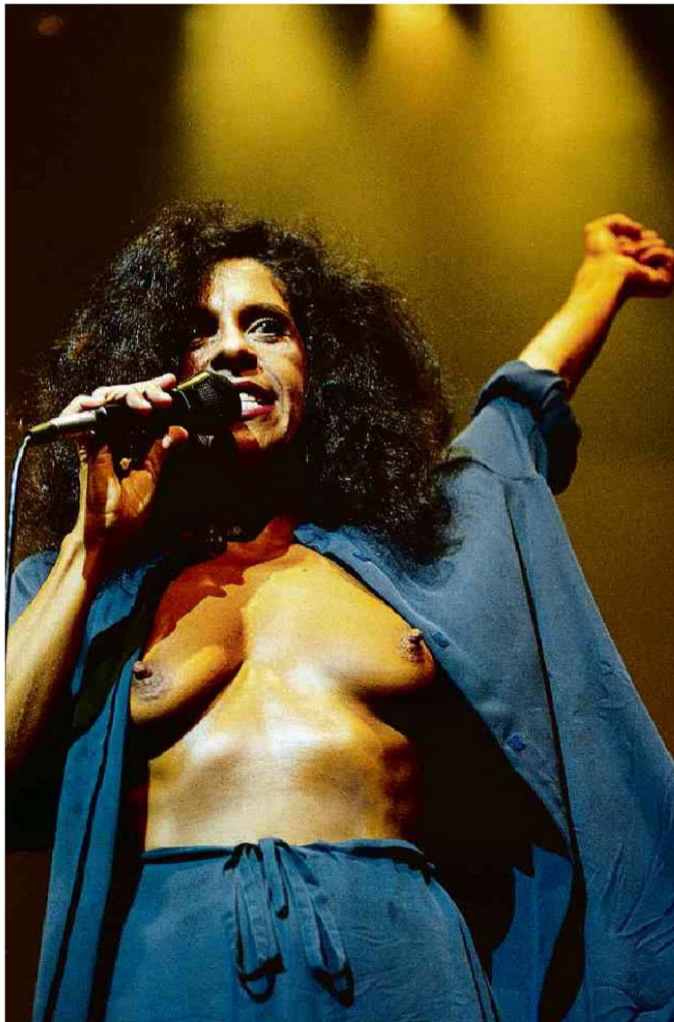
Gal Costa canta na estreia do show 'O Sorriso do Gato de Alice', dirigido por Gerald Thomas, no Rio de Janeiro, em 1994; transgressão marcou carreira da artista. Luciana Whitaker - 3.mar.994/Folhapress