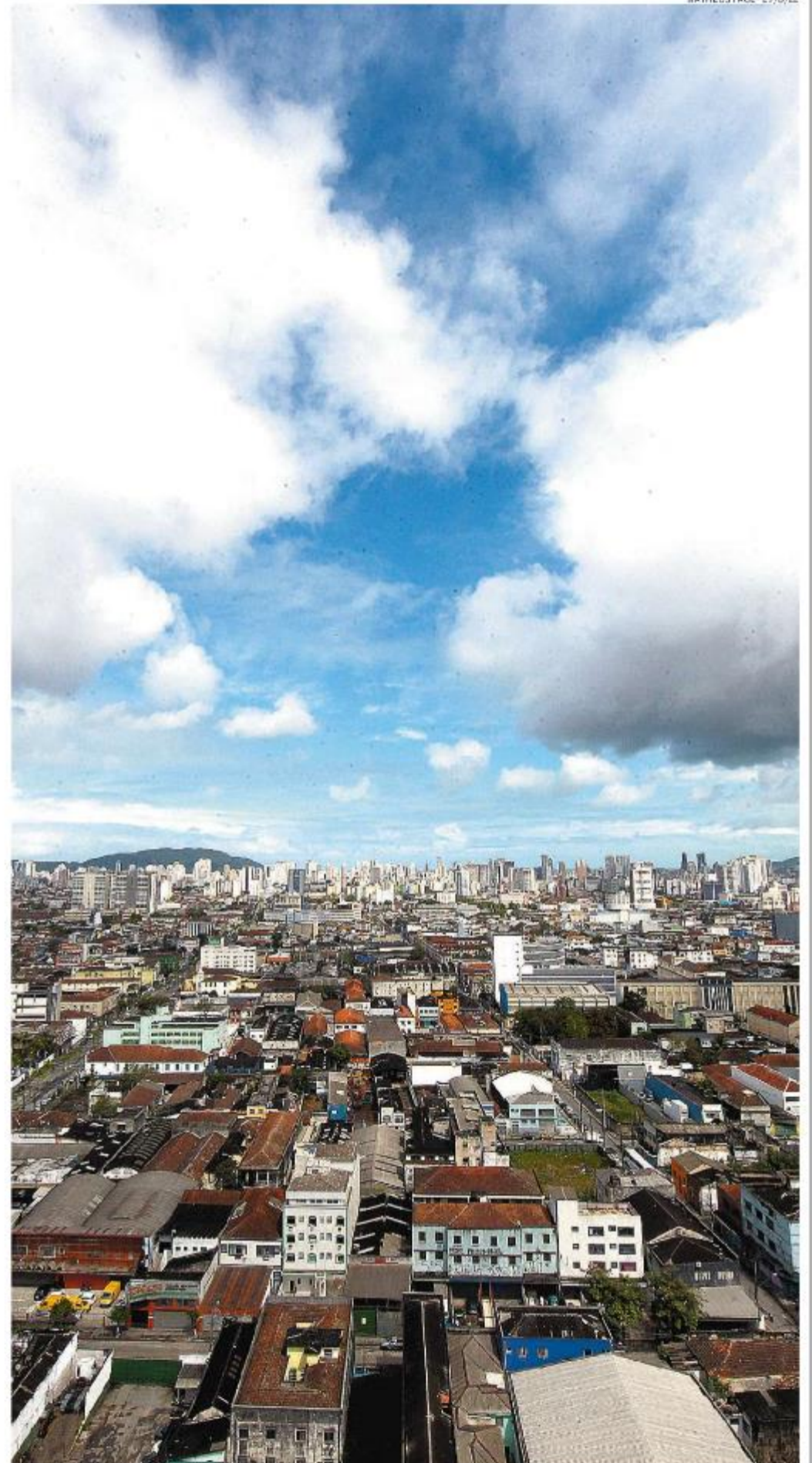
Secretário: “O Plano Diretor é a linha mestra da política urbana da Cidade, com um olhar para o futuro”

A questão da sustentabilidade também foi lembrada pelo secretário, em especial quanto à ocupação da Área Continental, que representa cerca de 240 quilômetros quadrados (km 2 ) do território santista, ante menos de 40 km 2 da área insular. “Nós reduzimos as áreas de expansão, focando na vocação para Porto e de forma sustentável. Uma cidade com esse pensamento é possível por meio da otimização do território”.