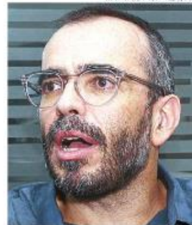
MATHEUSTAGE - 16/3/20

O ministro Alexandre de Moraes, presidente do Tribunal Superior Eleitoral (TSE), multou a coligação PL-PP-Republicanos por litigância de má-fé – que o Código de Processo Civil caracteriza, por exemplo, por “provocar incidente manifestamente infundado” num processo.