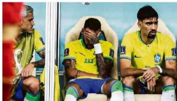
Neymar chora após ficar machucado e ser substituído na partida de estreia do Brasil na Copa, contra a Sérvia

Cartas para al. Barão de Limeira, 425, São Paulo, CEP 01202-900. A Folha se reserva o direito de publicar trechos das mensagens. Informe seu nome completo e endereço