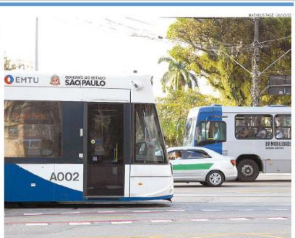
MATHEUS DAZE - 16/11/22