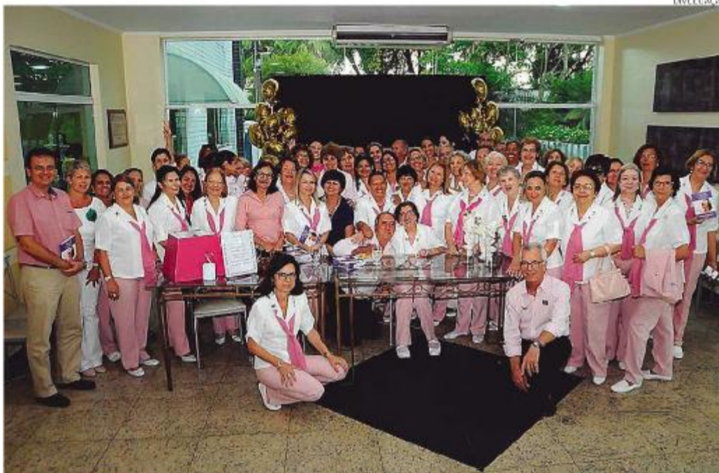
Por conta da pandemia, Rosinhas aumentaram a assistência a pacientes com sequelas e seus familiares

“Na pandemia, acabamos vendo que a necessidade de ajuda ia além da oncologia. A gente abriu o leque. Hoje, a gente atende pessoas com sequelas de AVC (Acidente Vascular Cerebral), sequelas de covid-19, pacientes com ELA (Esclerose Lateral Amiotrófica). Normalmente são doenças de longa duração, que precisam de ajuda, de alimentação enteral, de suplemento, as famílias precisam de cestas básicas. A gente am-