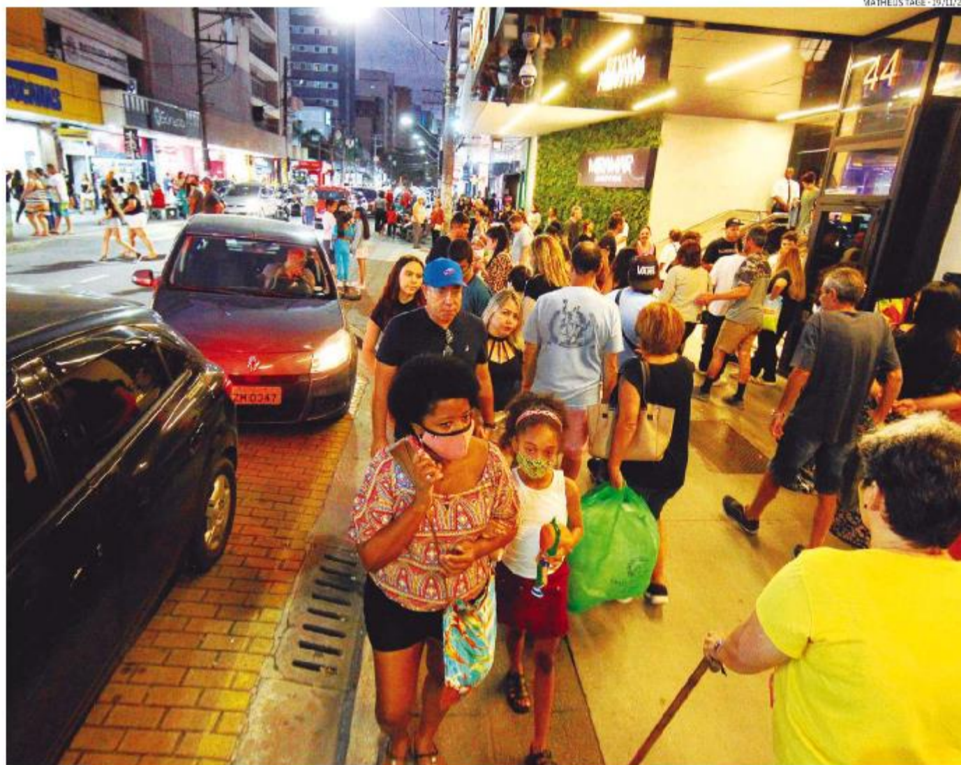
Sindicato do Comércio Varejista da Baixada Santista acredita que as vendas de fim de ano vão superar a expectativa pela Black Friday

A Associação Paulista dos Supermercados (Apas) também é otimista, mas informou, por nota, que ainda não possui expectativa de vendas porque está realizando a pesquisa com seus associados.