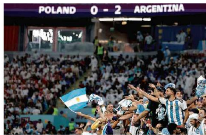
Torcida na arena 974 festeja bom futebol e gols de Mac Allister e Julián Álvarez.

Em clima de Bombonera, a Argentina bateu a Polónia por 2 a 0, apesar de Messi perder pênalti. Em primeiro no grupo, evitou a França nas oitavas. A Austrália eliminou a Dinamarca. p.1