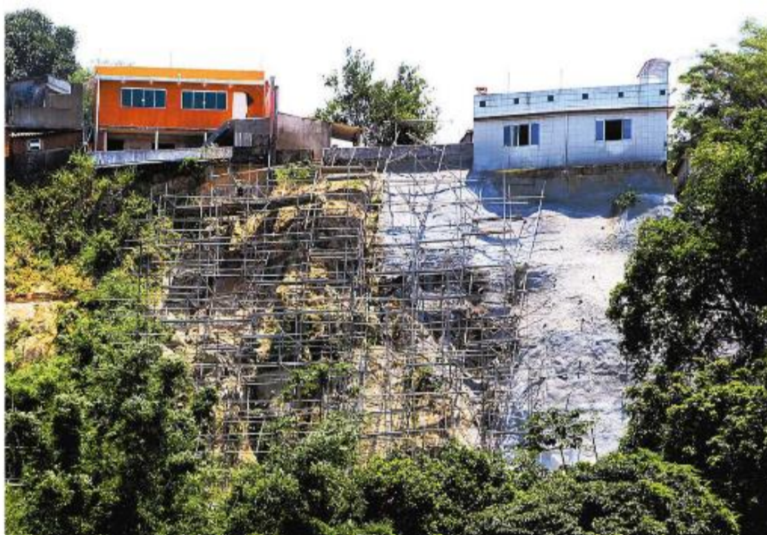
Objetivo é agir antes que moradores em áreas de risco sejam atingidos por escorregamentos de terra

“Este verão terá influência do fenômeno (meteorológico) La Niña até a metade de fevereiro. Em alguns períodos, será muito comum a presença de frente fria e chuva. Haverá momentos em que não choverá, depois, virá muita chu-