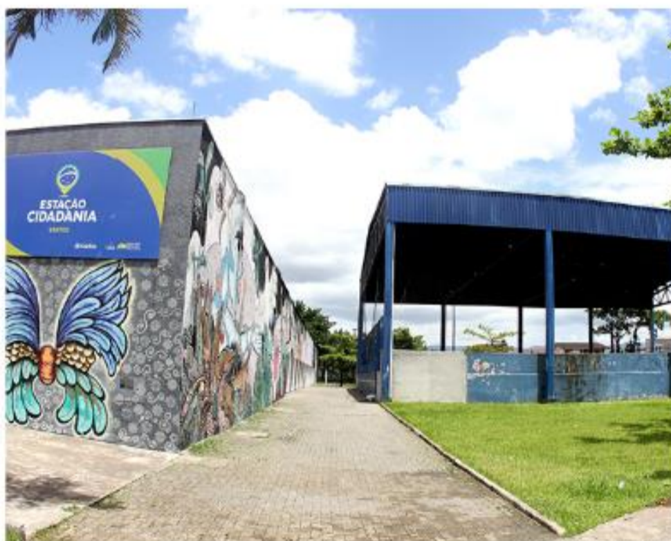
O CEU das Artes, segundo os manifestantes, não vem cumprindo o objetivo de gerar cultura e cidadania

Outro lembrou ainda que os equipamentos são fundamentais no item inclusão, sempre presente no esporte, educação e nas artes. Segundo lembra, o equipamento, após inaugurado, chegou a funcionar somente quatro meses. O cineteatro está intacto, mas sem projetor de audiovisual. To-