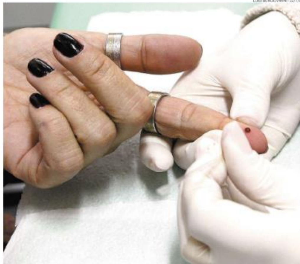
O teste é gratuito, feito a partir de uma gota de sangue retirada de um dedo. Resultado sai em 20 minutos

“Os mais jovens não viveram a fase mais crítica da doença, e os avanços tecnológicos e farmacológicos foram muito significativos nesse período. Hoje, o tratamento para pacientes