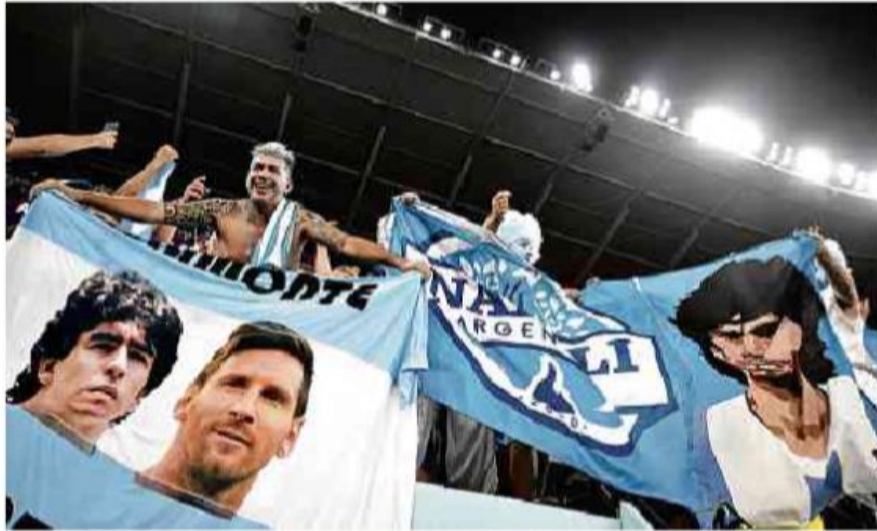
Torcedores argentinos comemoram vitória da sua seleção sobre a Polônia, em Doha, pela Copa do Mundo

Cartas para al. Barão de Limeira, 425, São Paulo, CEP 01202-900. A Folha se reserva o direito de publicar trechos das mensagens. Informe seu nome completo e endereço