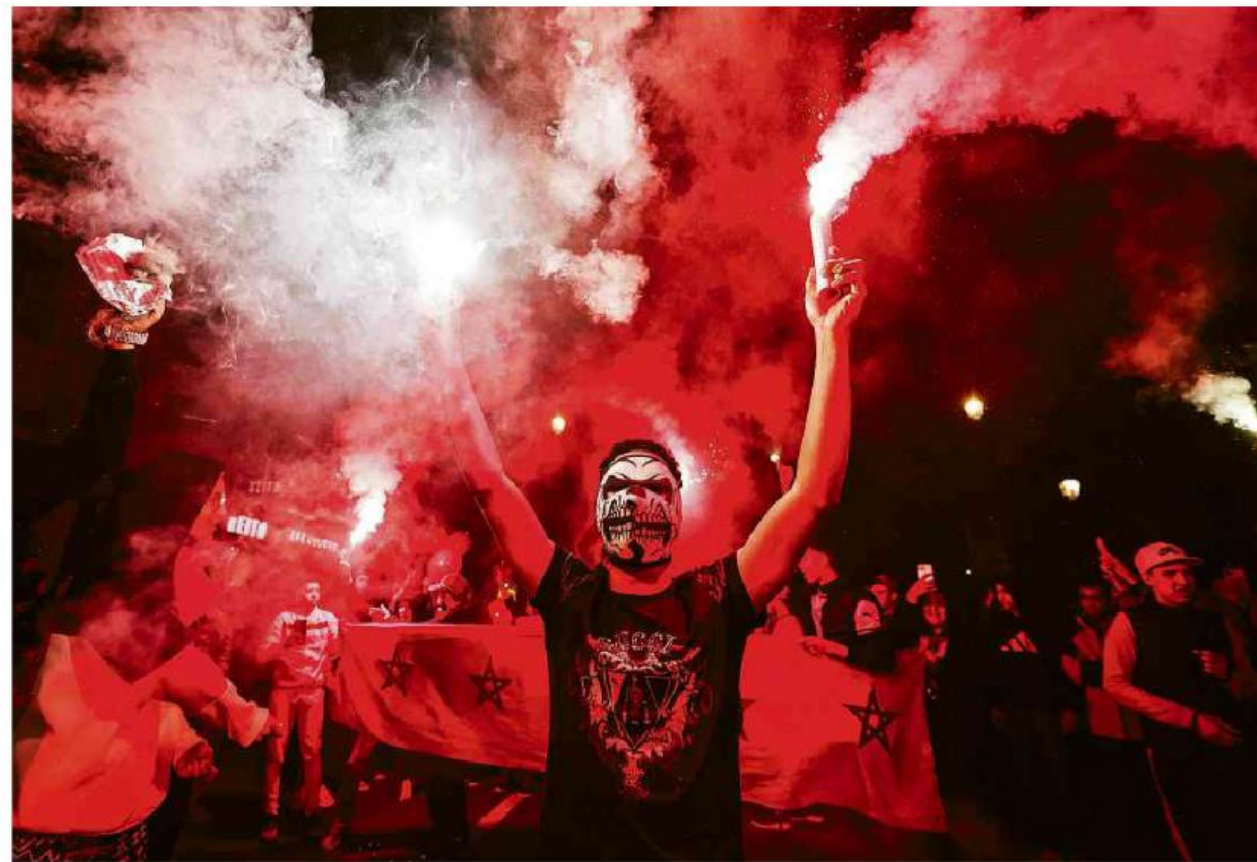
Marroquinos comemoram na capital, Rabat, a vitória de sua seleção sobre a Espanha, nos pênaltis, pelas oitavas de final da Copa do Mundo

Pontas mostram que as verdades são relativas p.7