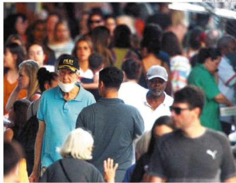
Profissional salienta que usar máscara é recomendável em ambientes com alta concentração de pessoas

"Além do que, há um alto percentual da população não devidamente vacinada, ou parcialmente vacinada, contra covid-19 e contra Influenza. Mesmo quem recebeu a quarta dose da vacina do coronavírus há mais de seis meses já tem uma redução da imunidade específica", observa. (GF)