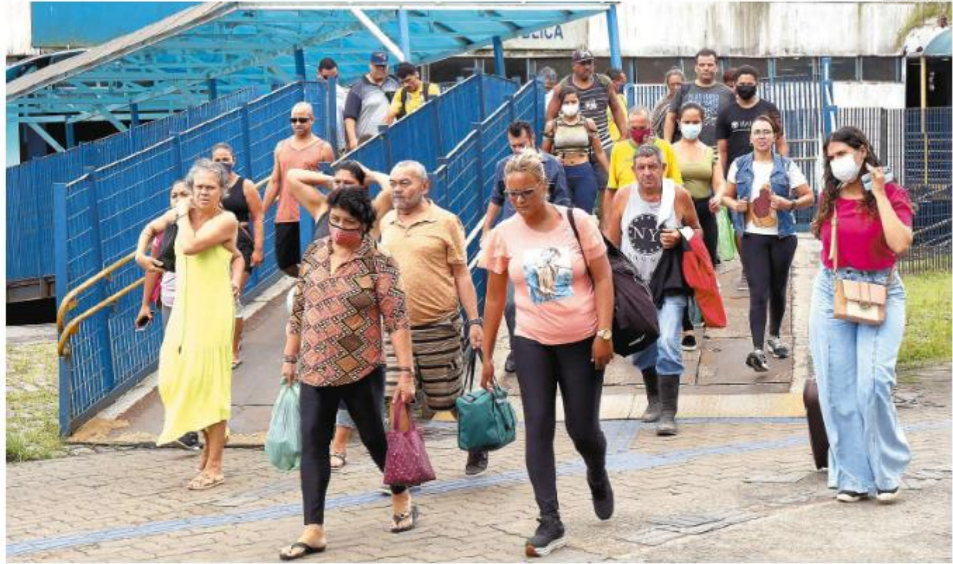
Utilização também é obrigatória nos serviços intermunicipais de transporte, como a travessia de barcas entre Santos e Vicente de Carvalho. Na foto, desembarque do lado santista

São Vicente retomou a obrigatoriedade no transporte público e a manteve nas unidades de saúde. A Prefeitura também diz fazer cons-