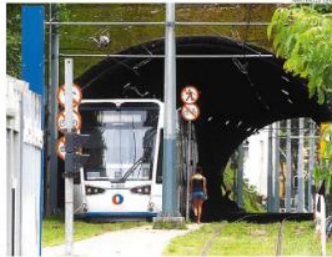
Objetivo é evitar que pessoas transitem e fiquem dentro da ligação

são, o túnel do VLT receberá cinco conjuntos de peças que funcionarão como