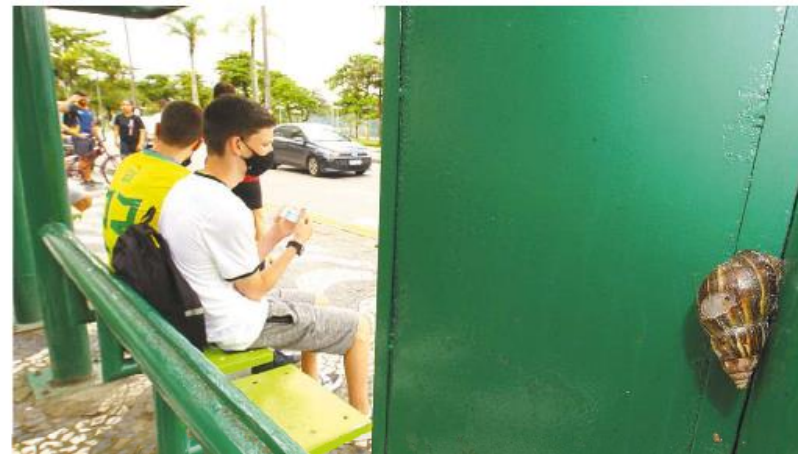
Caramujos também podem ser vistos no ponto de ônibus defronte ao casarão, no Bairro Aparecida

Em nota, o Poder Público informou que o projeto de restauro do Escolástica Rosa está aprovado, mas