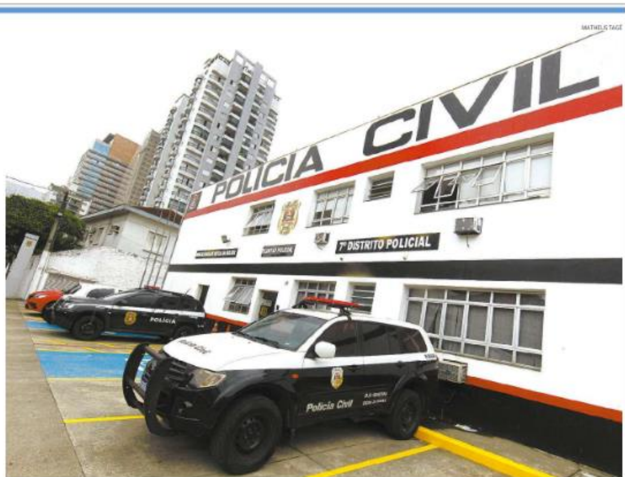
Haverá um centro de apoio com psicólogos, assistente social e intérprete de Libras. O 7º DP fica na Rua Dr. Assis Corrêa, 50, no Gonzaga

“O Centro de Apoio Técnico é um serviço criado para amparar e proteger todas as pessoas com deficiência que sejam vítimas de violência ou violação de direitos. O atendimento pode ser feito tanto presencialmente quanto de forma remota. Com essas duas novas inau-