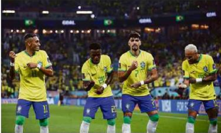
Raphinha, Vinicius Jr, Lucas Paquetá e Neymar comemoram gol em jogo contra a Coreia do Sul pela Copa

Cartas para al. Barão de Limeira, 425, São Paulo, CEP 01202-900. A Folha se reserva o direito de publicar trechos das mensagens. Informe seu nome completo e endereço