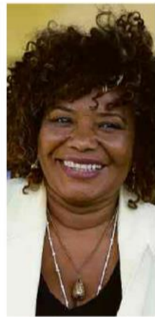
Margareth Menezes, futura ministra

A cantora baiana Margareth Menezes aceitou convite de Lula para assumir reconstrução do Ministério da Cultura em meio a críticas por sua inexperience em gestão pública.