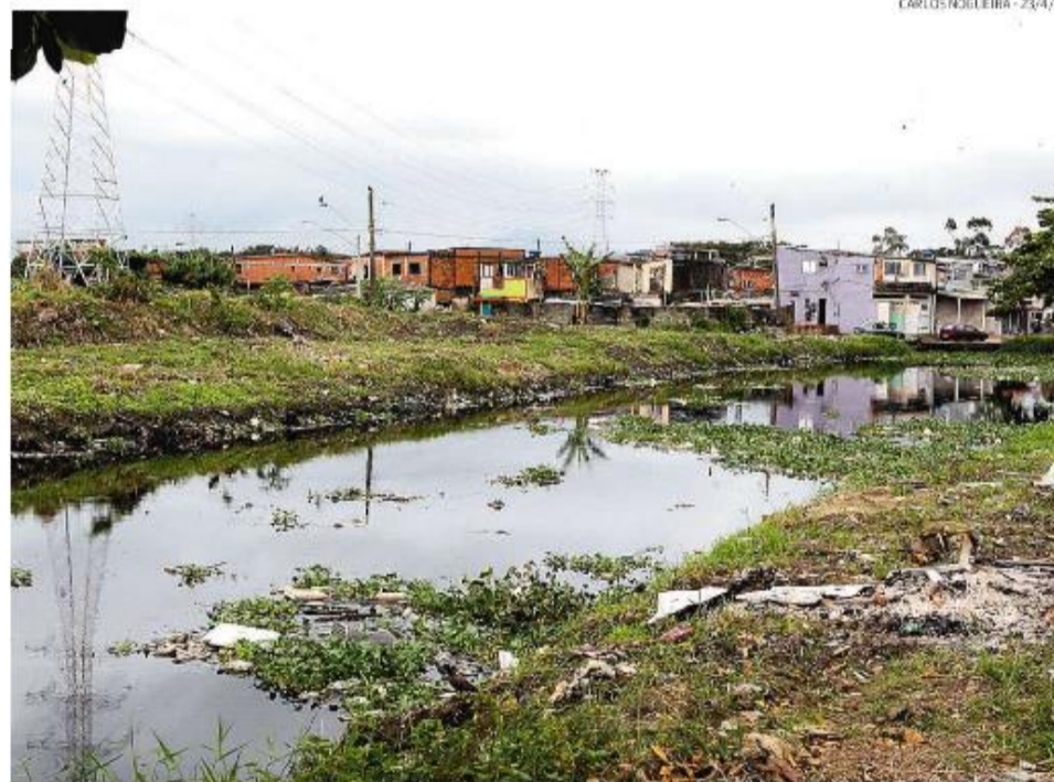
Esperam-se melhoria na qualidade de vida da população, de condições ambientais e desenvolvimento social

Reguladora de Serviços Públicos do Estado e Agência Nacional de Águas), além da Agem (Agência Metropolitana), teria atribuições claras neste processo para atendimento ao novo Marco Legal”, reforça a supervisora da Sabesp.