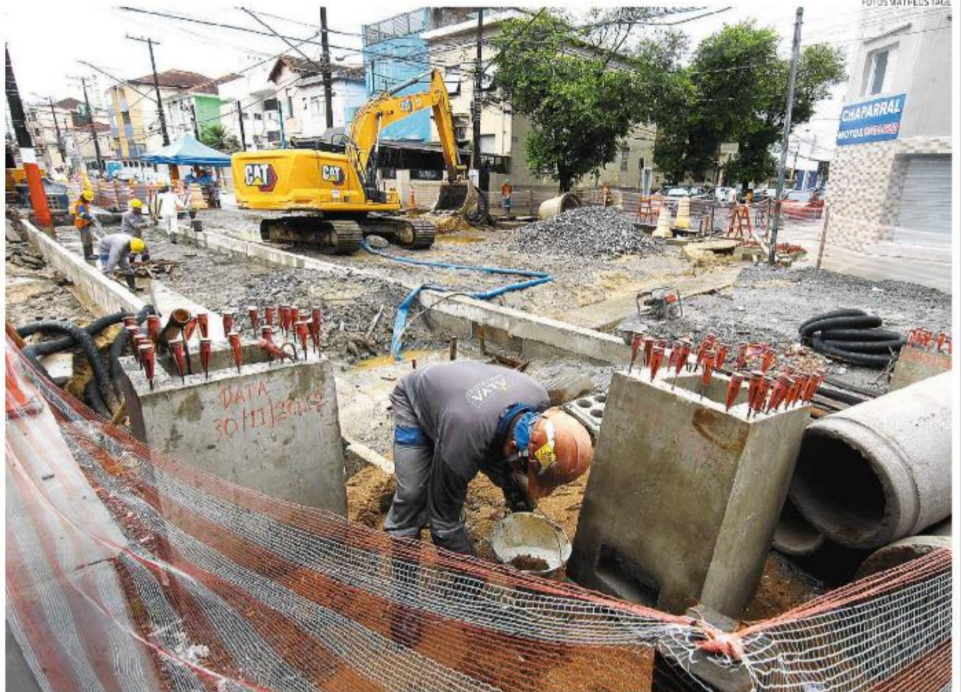
Segunda fase do VLT tinha previsão inicial de entrega até março próximo, mas está apenas 32% prontas. Por isso, EMTU admitiu rever prazo

No texto, ela citou problemas de realocação de postes, estações de embarque e desembarque canceladas devido à “constatação de erro grave de conceito e projeto defronte a comércio e residências”, indefinições quanto a desapropriações tardias, redes novas de esgoto com problemas frequentes de entupimento, lama e calçadas com inclinações “absur-