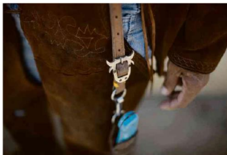
Parte da vestimenta do Grupo Encourados de Pedrão, na Bahia