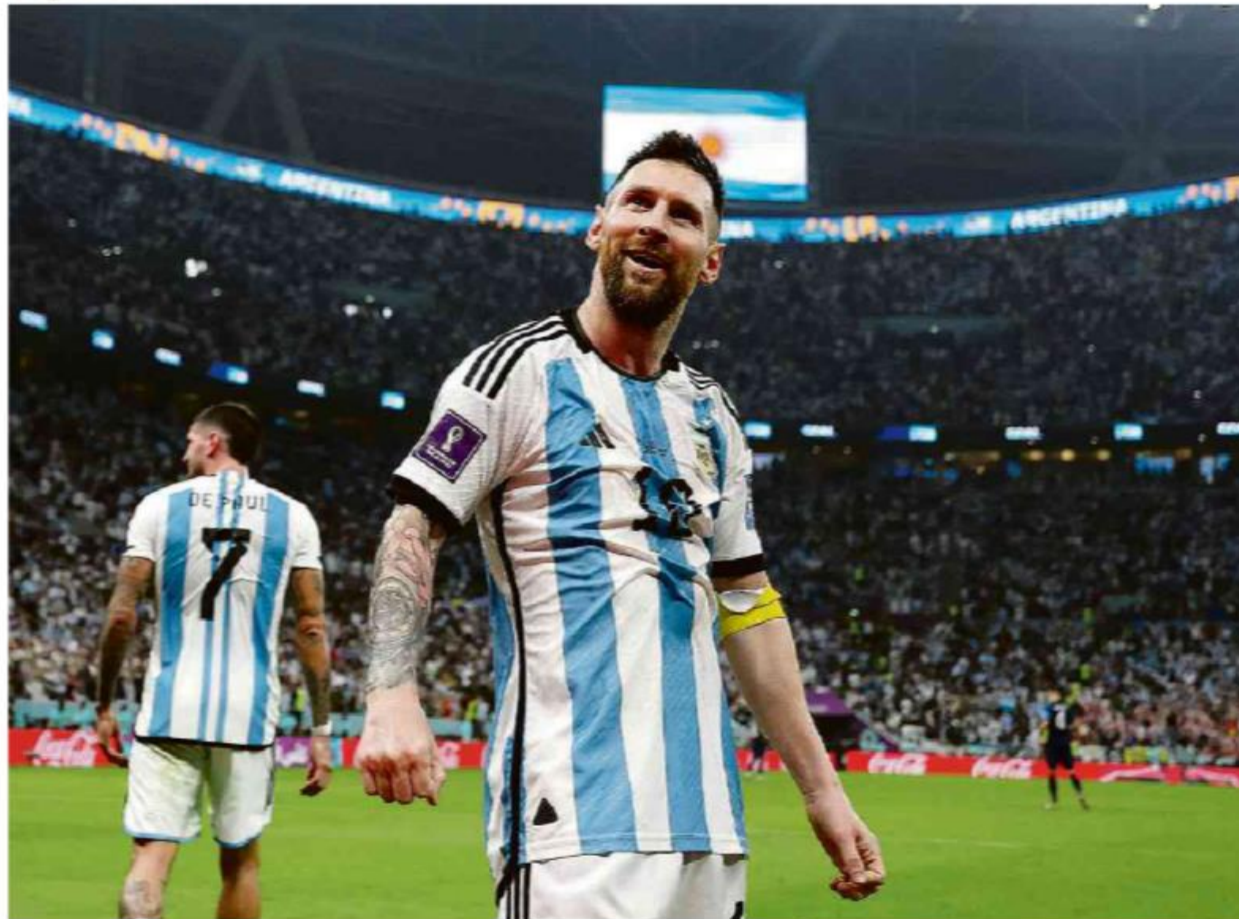
Messi festeja o terceiro e mais bonito gol da Argentina contra a Croácia, marcado pelo atacante Julián Álvarez após jogada do camisa 10.