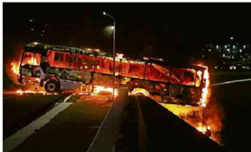
Manifestantes bolsonaristas entram em confronto com a polícia e queimam ônibus em Brasília

Cartas para al. Barão de Limeira, 425, São Paulo, CEP 01202-900. A Folha se reserva o direito de publicar trechos das mensagens. Informe seu nome completo e endereço