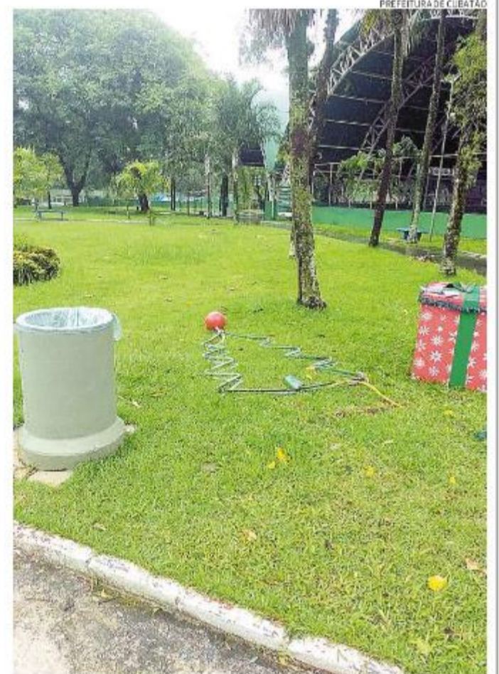
PREFEITURA DE CUBATÃO

Segundo a Prefeitura de Praia Grande, não se regis-