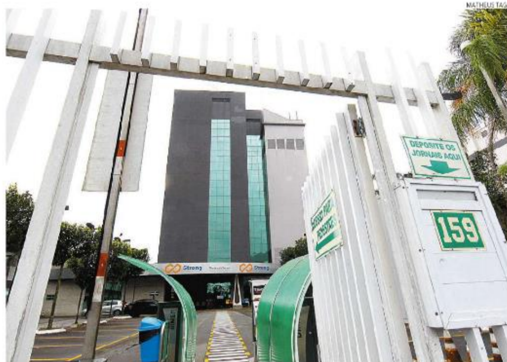
Edifício abriga o Centro Comercial Strong, localizado na Avenida Conselheiro Nébias, 159, no Paquetá

A intenção é iniciar a ocupação do imóvel de forma gradativa, adaptando o prédio já existente e ajustando os espaços escolares, dando apoio ao cumprimento da Jornada Ampliada e expandindo essas atividades ao longo do ano. Desta forma, seria contemplado o maior nú-