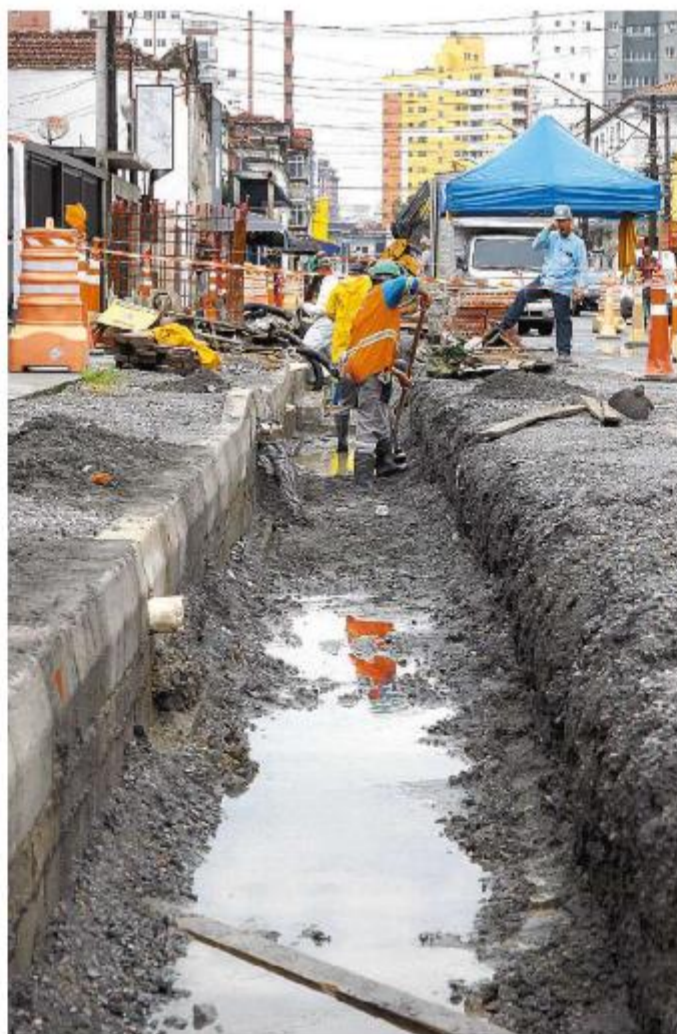
Obras permitem escoar a água acumulada na superfície, diz empresa