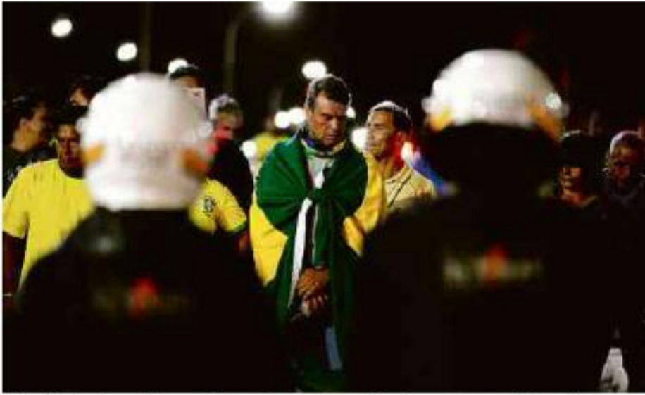
Manifestantes bolsonaristas durante confronto com a polícia após diplomação de Lula, em Brasília

Cartas para al. Barão de Limeira, 425, São Paulo, CEP 01202-900. A Folha se reserva o direito de publicar trechos das mensagens. Informe seu nome completo e endereço