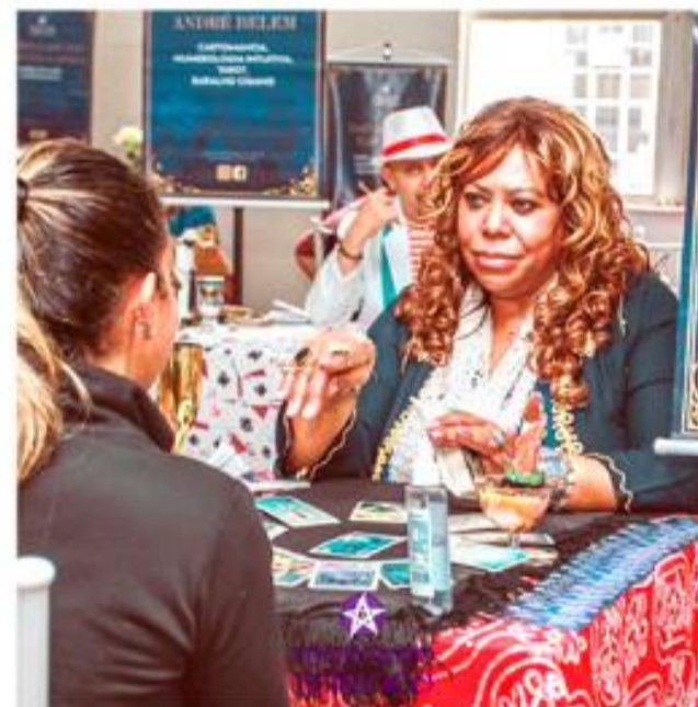
Mercado Místico contará com leitura de tarô e outras atividades

Uma área de alimentação será montada para oferecer maior conforto ao público. Entre as opções é possível encontrar o delicioso acarajé, cuscuz paulista, comida baiana, bobó de camarão, moqueca de camarão,