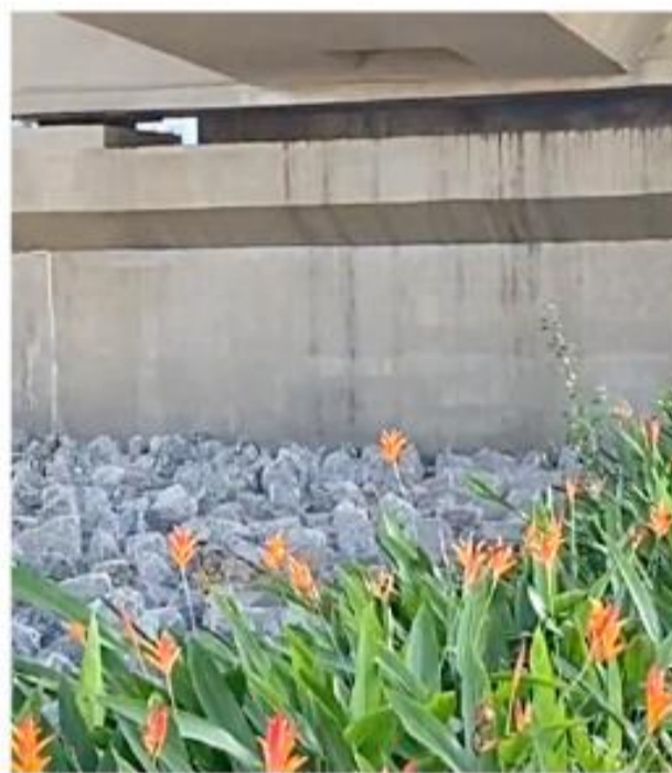
Colocação de pedras sob viaduto santista é vista como higienista

A busca diária e desesperada por comida exposta no filme, dificultada pela aporofobia, arquitetura higienista e violência (tripé básico do longa-metragem), sensibiliza o espectador que se vê diante de revelações fortes e emocionantes de pessoas em situação de rua que, claramente, têm os direitos humanos retirados em