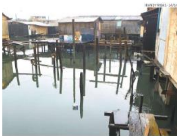
Proposta inicial para a Vila Gilda foi desenvolvida quatro anos atrás pelo escritório do hoje falecido arquiteto Jaime Lerner, de Curitiba (PR)