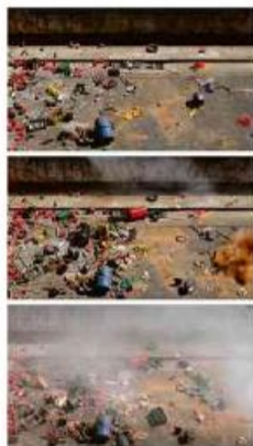
'O Século', em retrospectiva no Masp