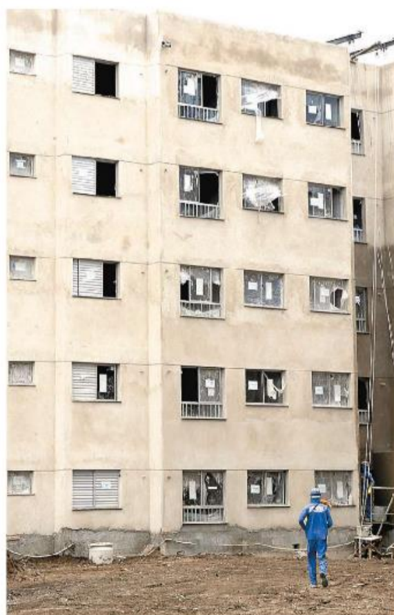
Santos, ao todo, será contemplada com 1.260 unidades no próximo ano