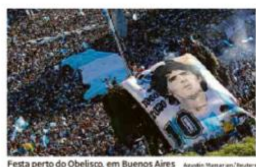
Festa perto do Obelisco, em Buenos Aires