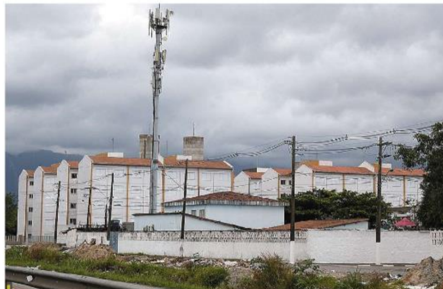
No Parque Bitaru, em São Vicente, estão ficando prontos 1.120 apartamentos para moradores de Santos