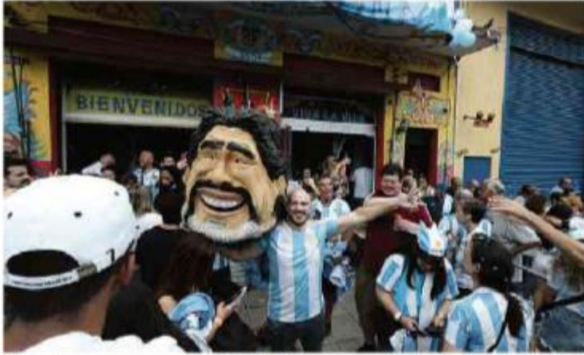
Torcedores comemoram vitória da Argentina na Copa do Mundo em restaurante no bairro da Mooca, em São Paulo

Cartas para al. Barão de Limeira, 425, São Paulo, CEP 01202-900. A Folha se reserva o direito de publicar trechos das mensagens. Informe seu nome completo e endereço