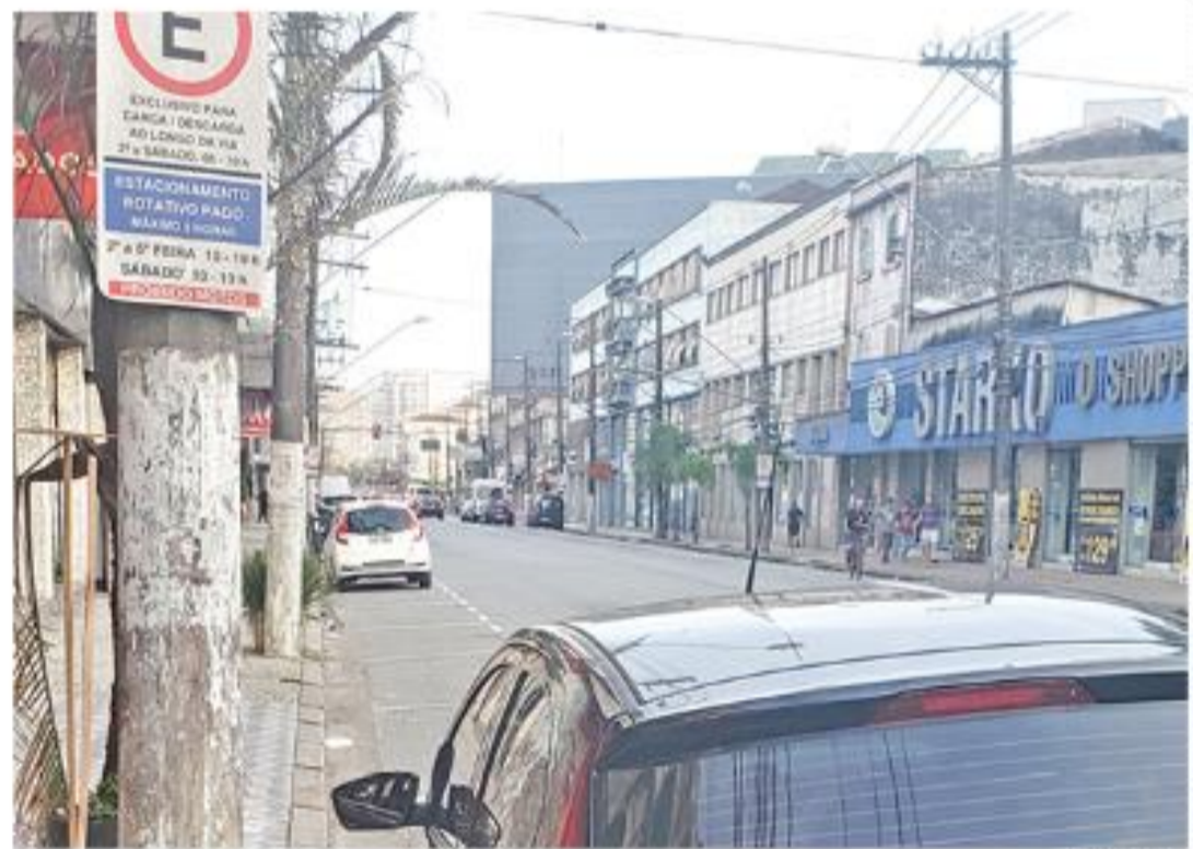
As vagas de Zona Azul chegarão nesta semana à Rua Olyntho Rodrigues Dantas, em Santos

O tempo limite de uso por vaga é de duas horas, ao preço de R$ 5,64. Outros valores