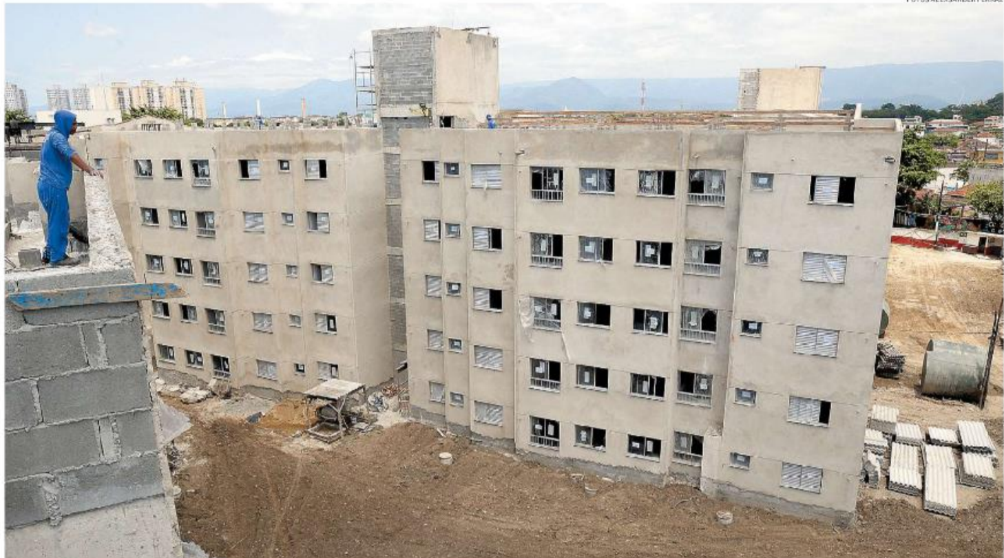
Em convênio com a CDHU, o empreendimento Santos Y - Bananal, na Caneleira, será entregue no próximo semestre, de acordo com a Cohab Santista. Serão 140 apartamentos

"A Prefeitura já concluiu a implantação de toda a infraestrutura no entorno e a construção de equipamentos públicos. A obra está