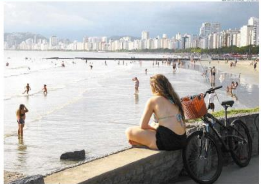
Quase sem restrições contra a covid-19, o movimento deverá superar o das duas temporadas anteriores