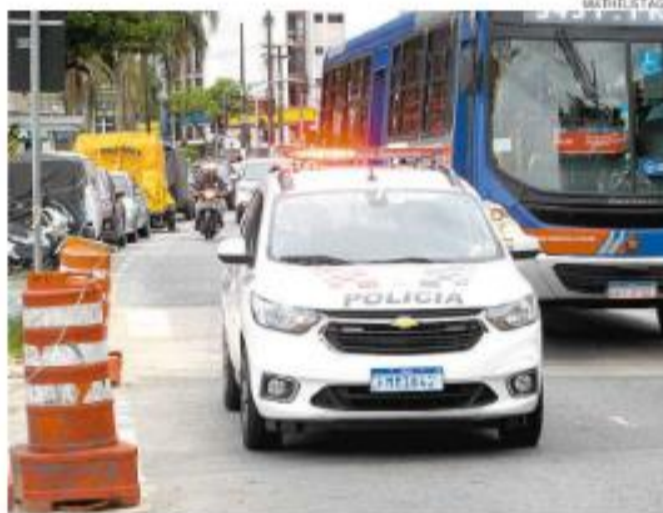
A Baixada terá 2,4 mil policiais a mais até o Carnaval, em fevereiro

O efetivo vai se concentrar em lugares com maior circulação de pessoas, co-