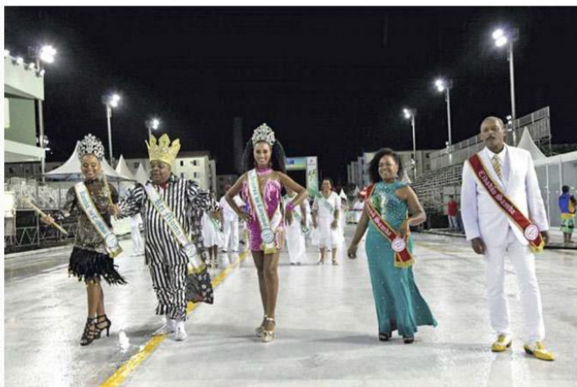
SISAN HODAS / PREFEITURA MUNICIPAL DE SANTOS