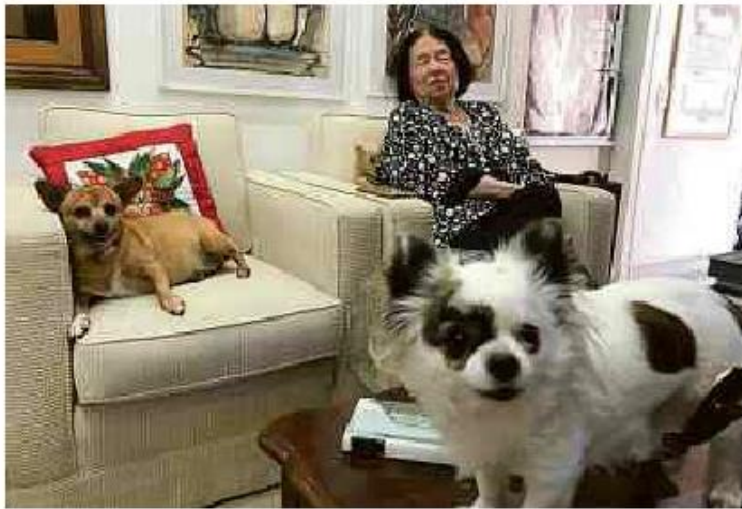
Nélida Piñon e suas cachorrinhas (e herdeiras), Suzy Piñon e Pilara Piñon

Cartas para al. Barão de Limeira, 425, São Paulo, CEP 01202-900. A Folha se reserva o direito de publicar trechos das mensagens. Informe seu nome completo e endereço