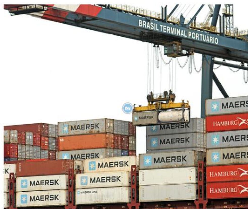
Os embarques apresentaram crescimento de 15,7%, chegando a 109,8 milhões de toneladas

Todos os segmentos de carga apresentaram crescimento significativo e estabeleceram suas maiores marcas para o período. A carga geral solta cresceu 42,3%, somando 8,9 milhões de toneladas, com destaque para a celulose (7,4 milhões de toneladas). Os granéis sólidos tiveram alta de 16,7%, acumulando 76,2 milhões de toneladas, com destaque para os embarques de soja em grão (25,4 milhões de toneladas), milho (13,3 milhões de toneladas) e açúcar (18,9 milhões de toneladas) e para as descargas de fertilizantes (7,4 milhões de toneladas). Os granéis líquidos somaram