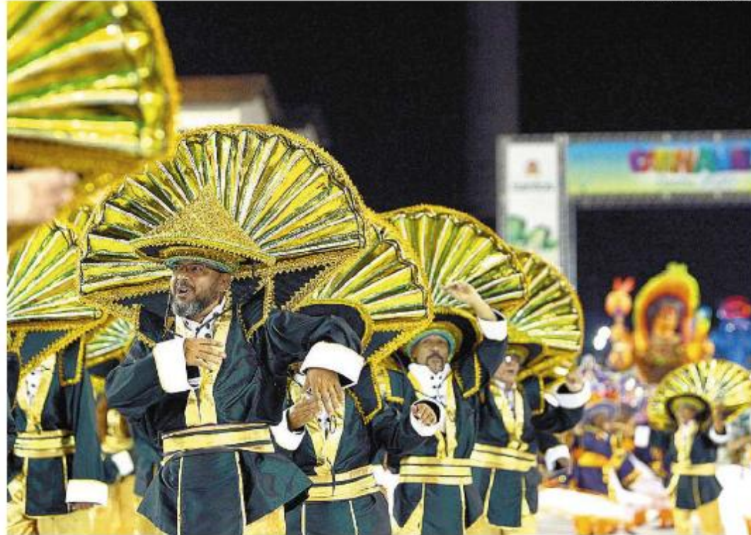
Cidade teve desfile oficial de escolas de samba pela última vez em 2020, pouco antes da pandemia