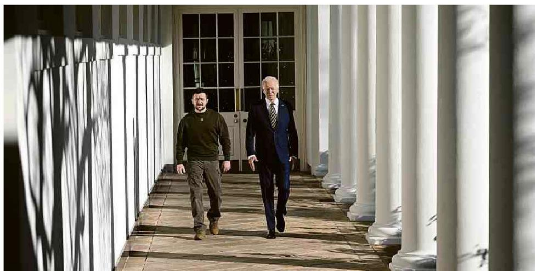
Zelenski caminha ao lado de Joe Biden na Casa Branca, em 1ª viagem desde a invasão russa