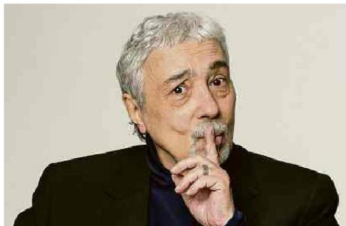
Sucesso na TV e no teatro: 3 prêmios Molière

A PEC da Gastança amplia o teto de gastos em R$ 145 bilhões no próximo ano. O texto ainda autoriza outros R$ 23 bilhões em investimentos fora da regra fiscal. Política A7 e Mercado A12