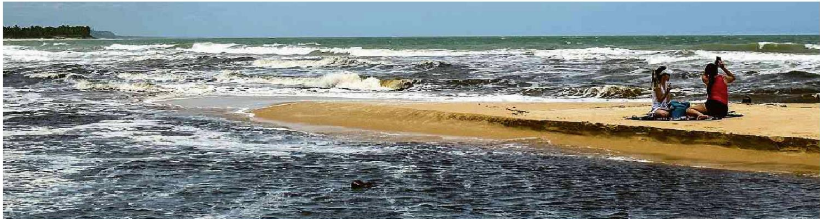
Turistas aproveitam o dia de sol na praia de Coqueiros, ao lado do rio Trancoso, no sul da Bahia, um dos destinos mais procurados no final de ano e nas férias de verão