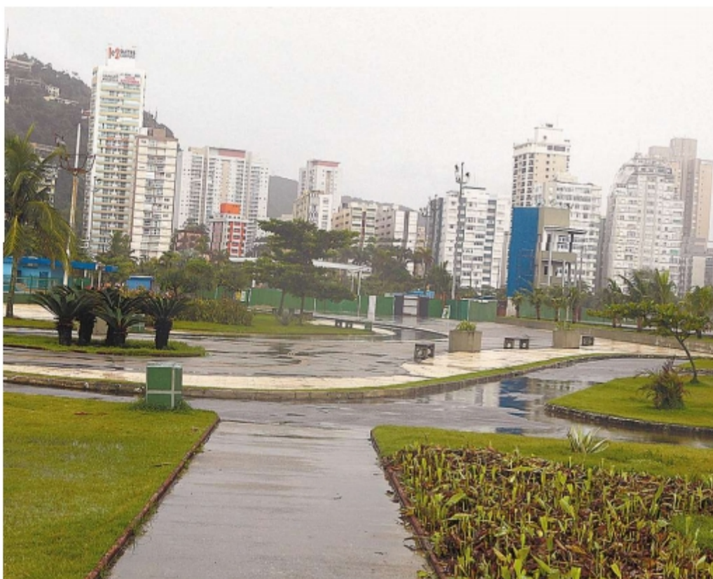
Depois do Aquário, o emissário é o ponto que mais recebe visitas aos finais de semana, dizem vereadores

tros equipamentos, a liberação da verba enfrenta muita burocracia.