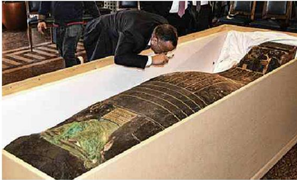
Mostafa Waziri, chefe do Conselho Supremo de Antiguidades do Egito, inspeciona no Cairo o sarcófago devolvido dos EUA para o país

Cartas para al. Barão de Limeira, 425, São Paulo, CEP 01202-900. A Folha se reserva o direito de publicar trechos das mensagens. Informe seu nome completo e endereço