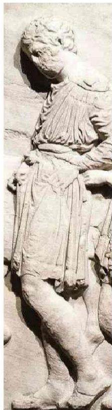
Detalhe de esculturas conhecidas como Mármores de Elgin.

Empossada, Ana Moser diz que foco será democratização, não alto rendimento