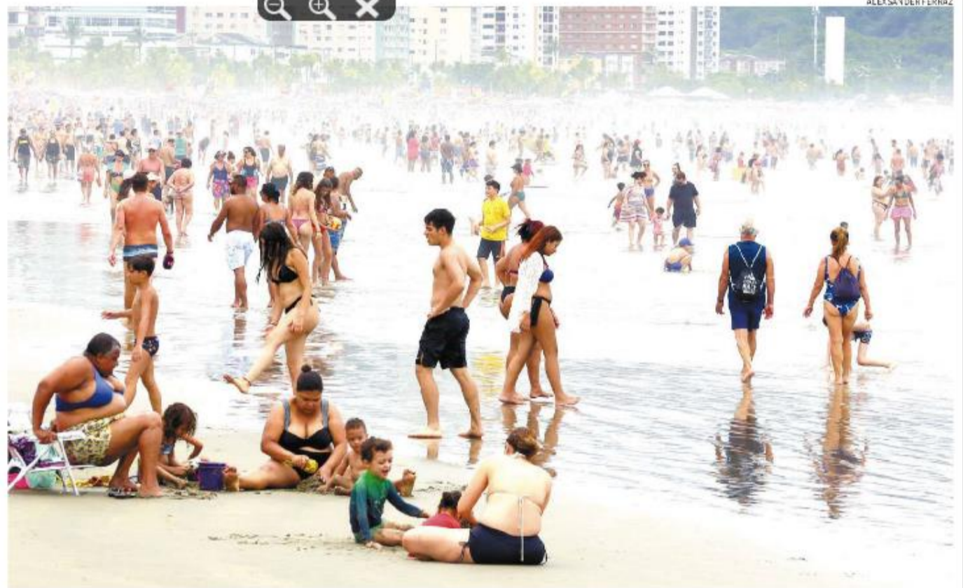
Diversos fatores podem influenciar na balneabilidade das praias, mas o principal deles é a chuva; coleta de esgoto também entra na lista

Em São Vicente, as praias do Gonzaguinha e Prainha estão com bandeira vermelha. No balanço anterior, a dos Milionários também estava, mas voltou para a ban-