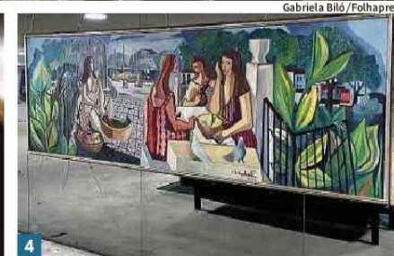
1 Destruição causada por bolsonaristas vista a partir do Palácio do Planalto 2 Brasão da República e cadeira do Supremo Tribunal Federal removidos por invasores e deixados na Praça dos Três Poderes 3 Golpista destrói quadro no Planalto 4 Paineis de Di Cavalcanti furado por manifestantes, no Planalto

“É preciso que essa gente seja punida de forma exemplar, que ninguém nunca mais ouse com a bandeira nacional nas costas se fingir de nacionalistas” Luiz Inácio Lula da Silva presidente da República