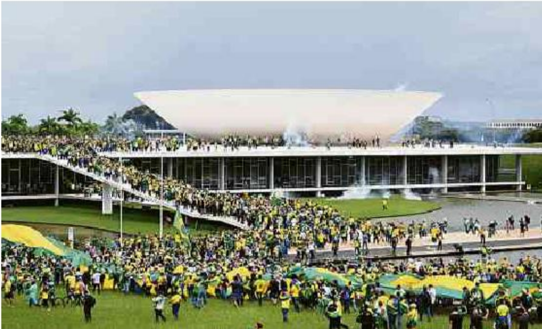
Apoiadores do ex-presidente Jair Bolsonaro invadem Congresso Nacional, STF e Palácio do Planalto, em Brasília

Cartas para al. Barão de Limeira, 425, São Paulo, CEP 01202-900. A Folha se reserva o direito de publicar trechos das mensagens. Informe seu nome completo e endereço