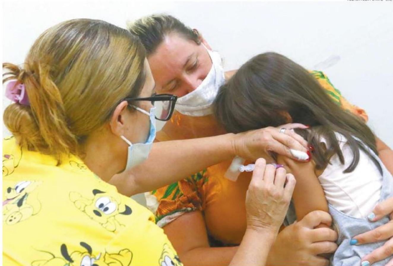
Prefeituras cobram governos Estadual e Federal a regularizar a remessa de vacinas. Em geral, número de unidades disponíveis tem sido baixo

A Secretaria de Saúde de Bertioga informou que a va-