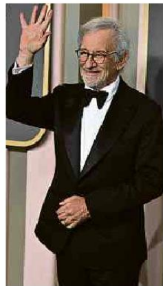
Steven Spielberg venceu como melhor diretor por 'Os Fabelmans'

Globo de Ouro volta à TV com diversidade entre os vencedores, mas sem mea culpa