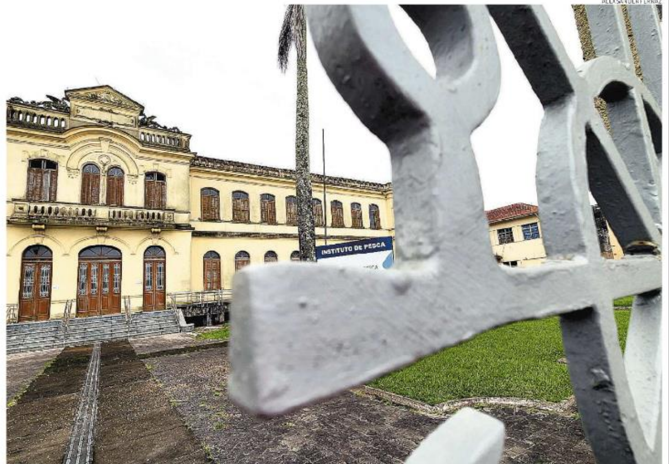
Obra é “complexa” porque está concentrada nas instalações elétricas, segundo o Governo Estadual. Condephaat liberou reforma em novembro

O espaço fechou em outubro do ano passado. No site da instituição, é possível ver uma mensagem com a informação e um QR Code para se fazer um tour vir-