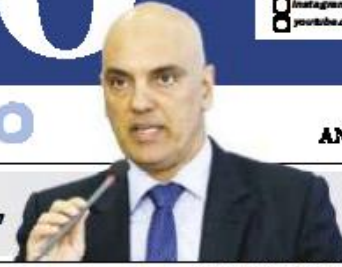
IMAGEM DA MARCA/AGÊNCIA BRASIL

Moraes avisa que prisões não são colônia de férias para golpistas. BRASIL/A7