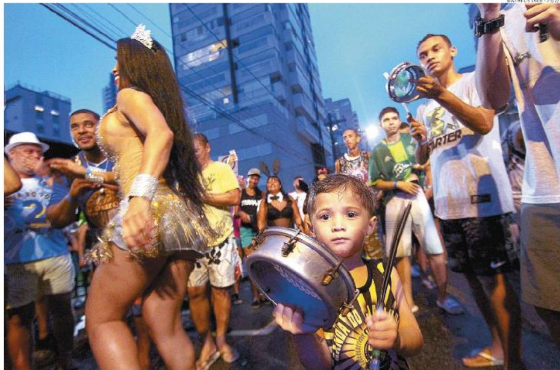
Festas de rua poderão ocorrer até 21 de fevereiro, mediante autorização do Comitê Municipal de Segurança e Fiscalização de Eventos Carnavalescos

O requerimento terá de ser dirigido ao comitê com