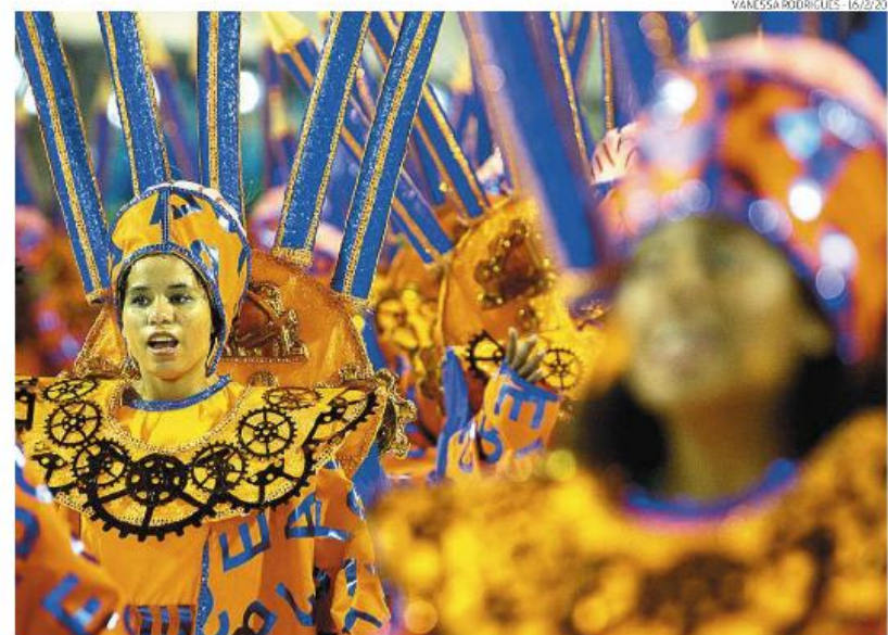
Evento está marcado para os dias 10 e 11 de fevereiro, uma semana antes da data oficial do Carnaval

Na sequência, desfilam quatro escolas que integram o Grupo Especial: Brasil, Amazonense, X-9 e