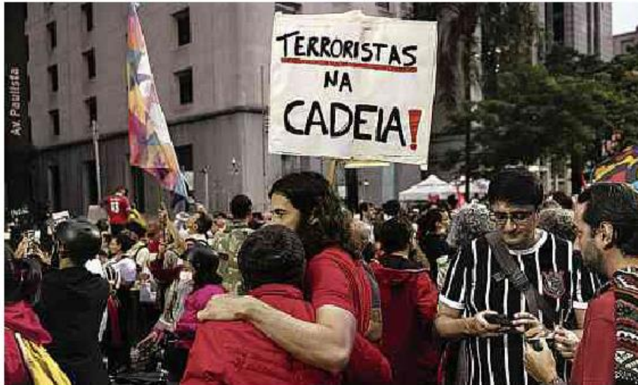
Manifestantes participam de ato em apoio à democracia na avenida Paulista, em São Paulo

Cartas para al. Barão de Limeira, 425, São Paulo, CEP 01202-900. A Folha se reserva o direito de publicar trechos das mensagens. Informe seu nome completo e endereço