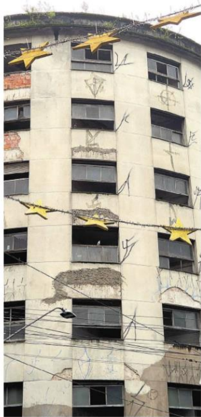
Edifício está com muitas janelas sem vidros e serve de abrigo a aves

"Durante muitos anos, só balada e restaurante não deram a vitalidade que esperamos para a região. Se comparar com outros centros históricos do mundo, você verá que, nesses, convivem restaurantes, atividade de rua, habitação, hotel, um Centro vivo. É isso que queremos trazer", comentou.