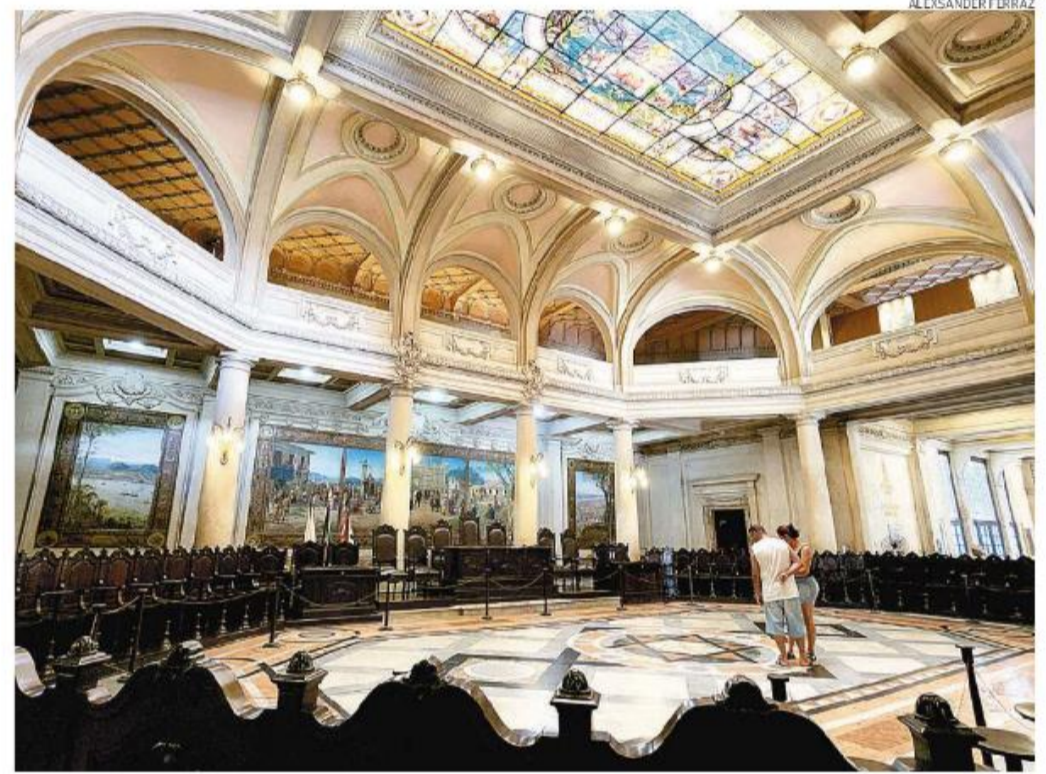
Uma das atividades será um workshop de fotografia no museu e nas ruas que ficam no entorno do prédio

A ideia é que crianças, pais ou cuidadores vivenciem experiências lúdicas