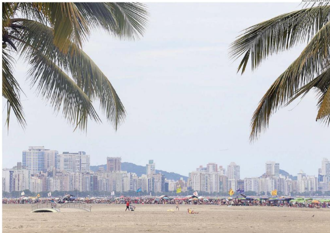
Baixada Santista tem oito cidades classificadas como estâncias turísticas, entre elas Santos (foto), e um Município de Interesse Turístico (MIT)