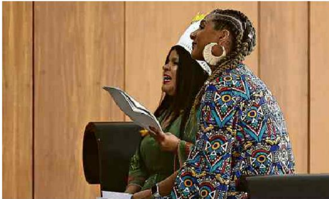
As ministras Sônia Guajajara, dos Povos Indígenas, Anielle Franco, da Igualdade Racial, no Palácio do Planalto

Cartas para al. Barão de Limeira, 425, São Paulo, CEP 01202-900. A Folha se reserva o direito de publicar trechos das mensagens. Informe seu nome completo e endereço