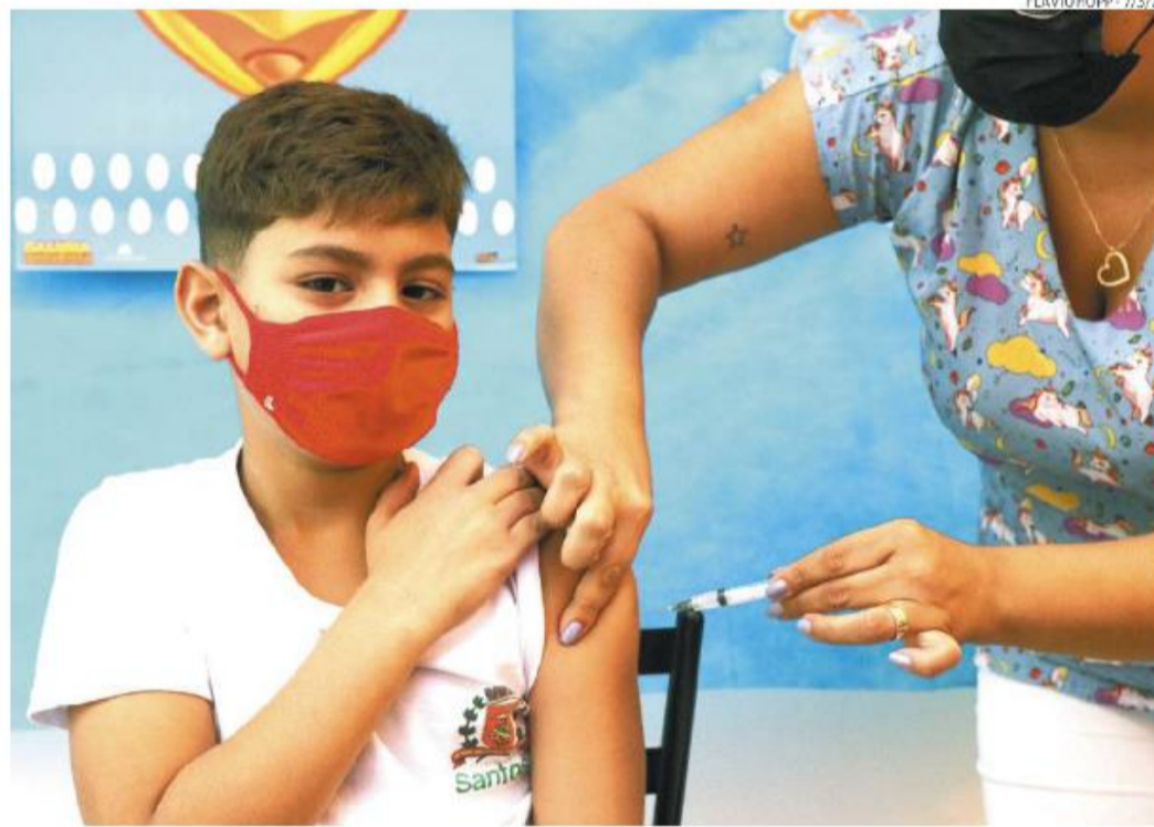
Das nove cidades locais, sete estão sem a Pfizer pediátrica e interromperam imunização dos 5 aos 11 anos

Um novo aditivo, segundo o ministério, “deve ser