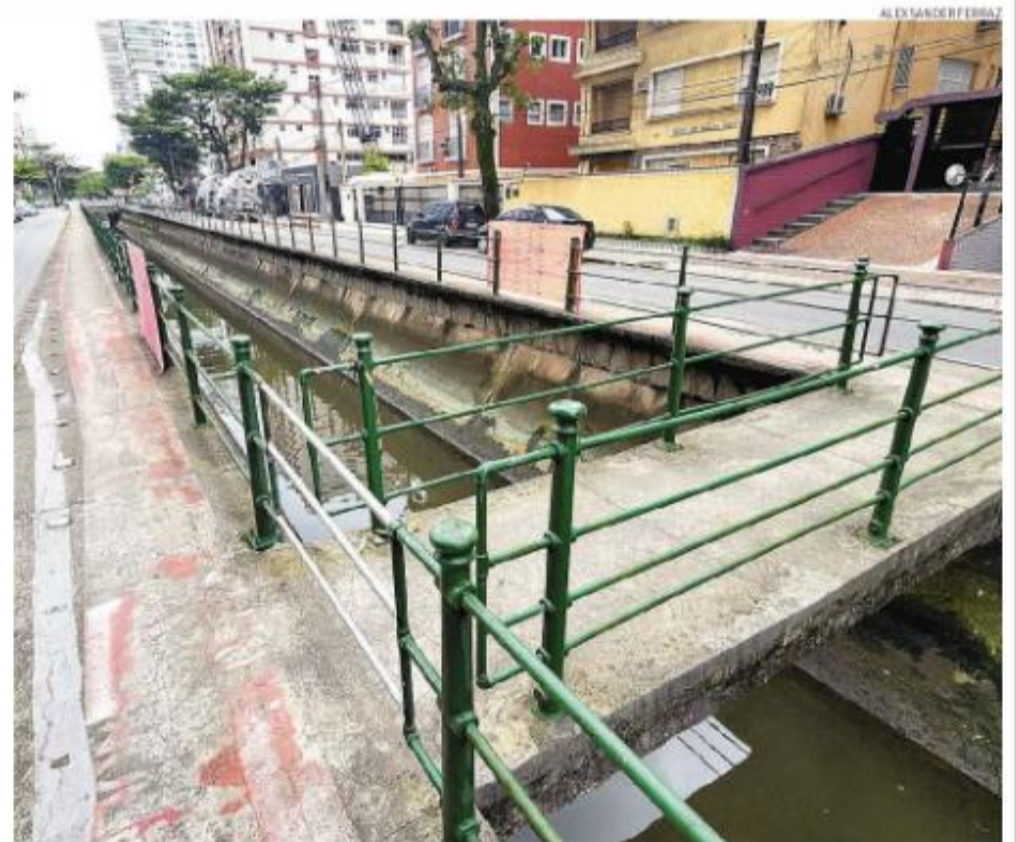
Ponte de concreto está com danos estruturais e começa a ser reformada em 60 dias, indica a Prefeitura

Para que o visual original das pontes seja mantido, mas considerando a necessidade de adaptações estruturais, os restauros são feitos em conjunto com o Conselho de Defesa do Patrimônio Cultural do Município (Condepasa).