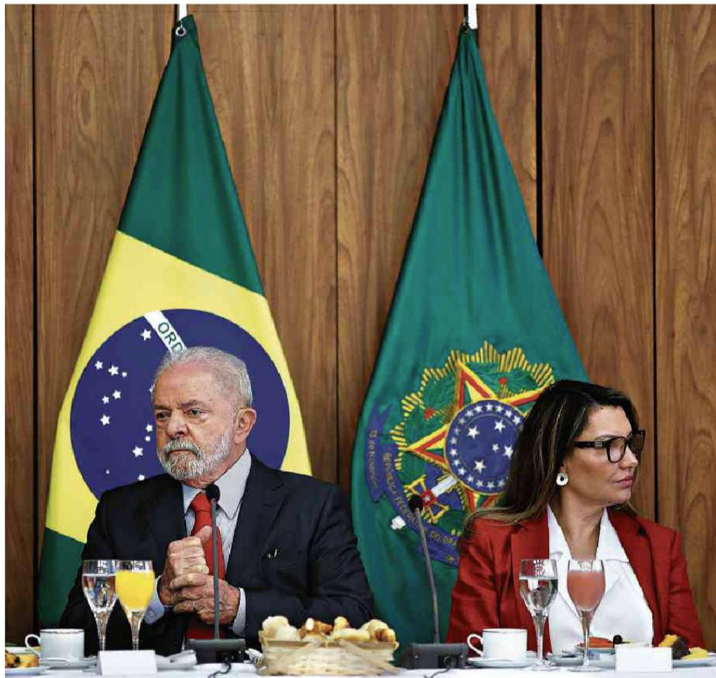
Luiz Inácio Lula da Silva (PT) e a primeira-dama, Janja, em café da manhã com jornalistas no Palácio do Planalto

Caso é novo indício jurídico contra ex-presidente, mas feito ainda é incerto A5