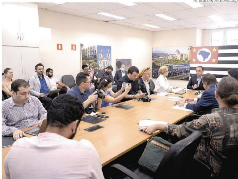
Secretário estadual de Turismo e Viagens (ao microfone) diz que região ficará com maior parte da verba

Com isso, o PIB do turismo paulista atingiria R$ 299,4 bilhões. De acordo com a secretaria, o avanço se deve, principalmente, ao turismo doméstico. São esperados 45 milhões de turistas nacionais em todo o Estado, estimulados por três grandes atividades: o turismo rodoviário, a hotelaria e