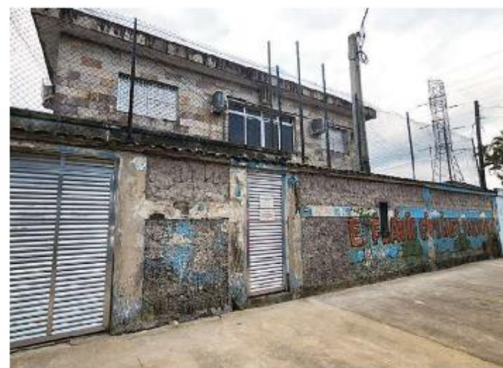
Prédio do colégio Flávio Cipriano Barbosa também será demolido

interno (coberto), playground e quadra poliesportiva. Todos serão climatizados e com acessibilidade.