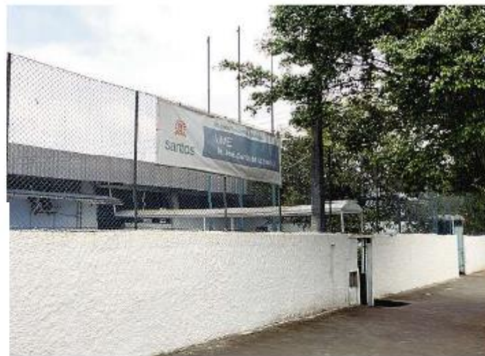
Atual sede da escola Azevedo Júnior fica em área de mangue e cede