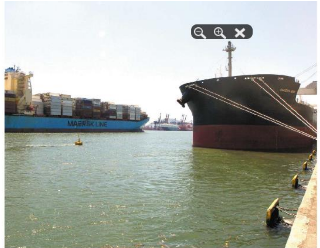
Mesmo com desestatização fora do radar do Governo Federal, ligação entre as duas margens segue em pauta