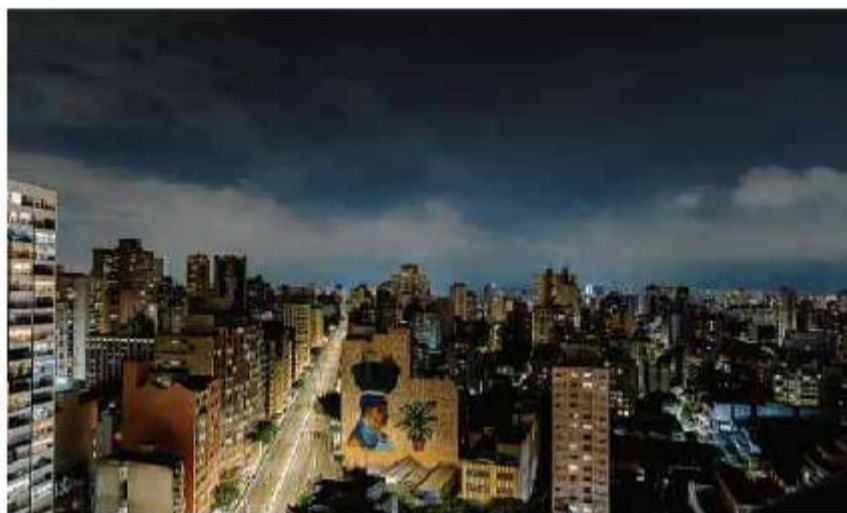
Vista do céu a partir do edifício Racy, na avenida São João, em São Paulo

Cartas para a l. Barão de Limeira, 425, São Paulo, CEP 01202-900. A Folha se reserva o direito de publicar trechos das mensagens. Informe seu nome completo e endereço