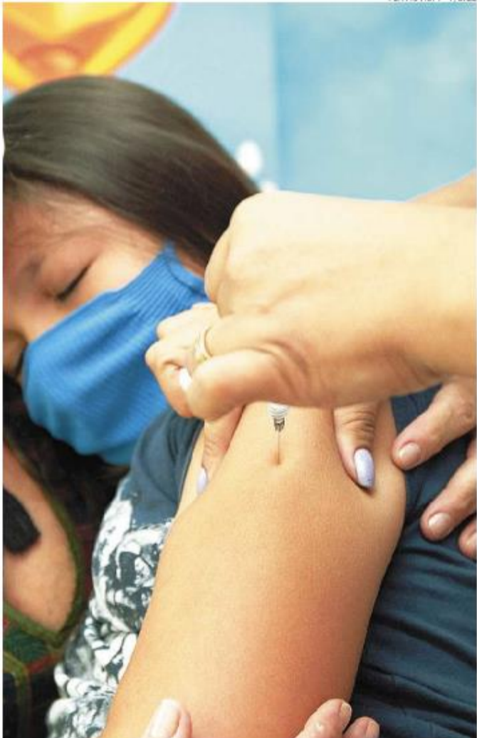
Há cidades com vacinação infantil parcialmente parada desde dezembro