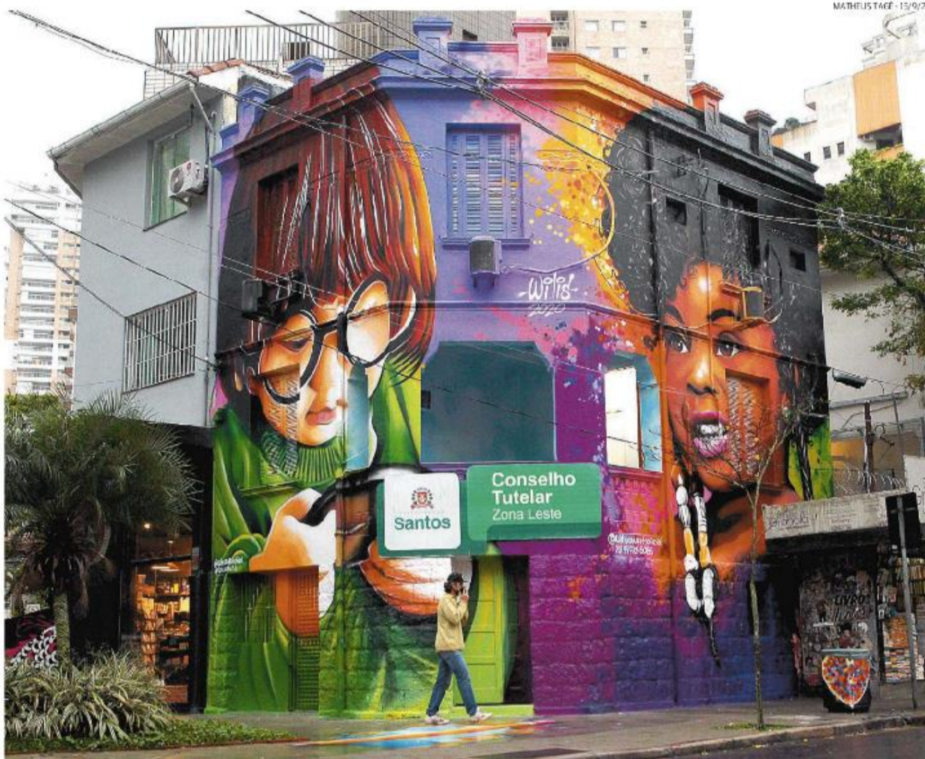
Conselho Tutelar da Zona Leste é uma das três unidades nas quais trabalham, ao todo, 15 conselheiros escolhidos por voto direto de eleitores

O presidente ressalta que o conselheiro tutelar é importante por representar a sociedade na missão de proteger e defender crianças e adolescentes. “Precisamos encontrar cidadãos que estejam comprometidos, efetiva-