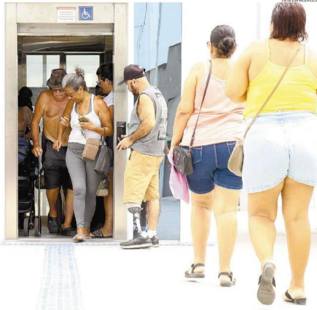
Após um início conturbado, o elevador funciona. Mas, se houver problemas, um cartaz informa como agir

Usuários ouvidos por A Tribuna confirmaram o alívio com a situação. Quem tem problemas de mobilidade que exigem a utilização