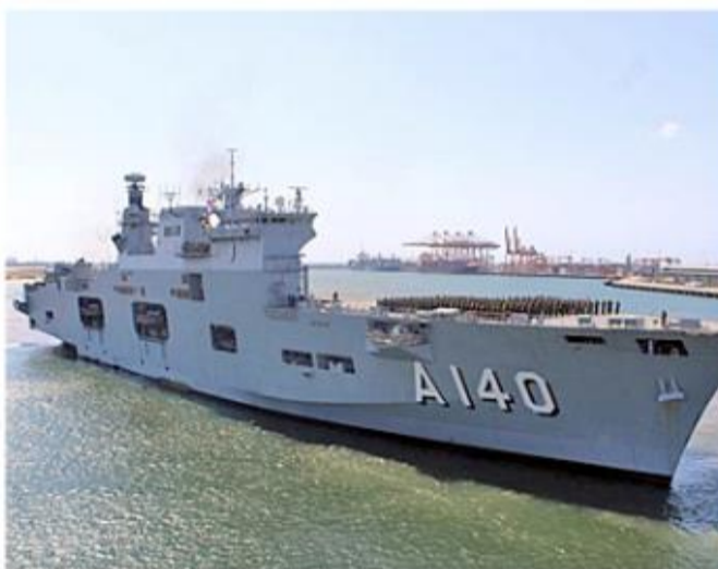
A embarcação atracada em Santos foi aberta à visitação do público

Antes de ser adquirida, a embarcação foi utilizada pela marinha real britânica. Em seu histórico estão operações