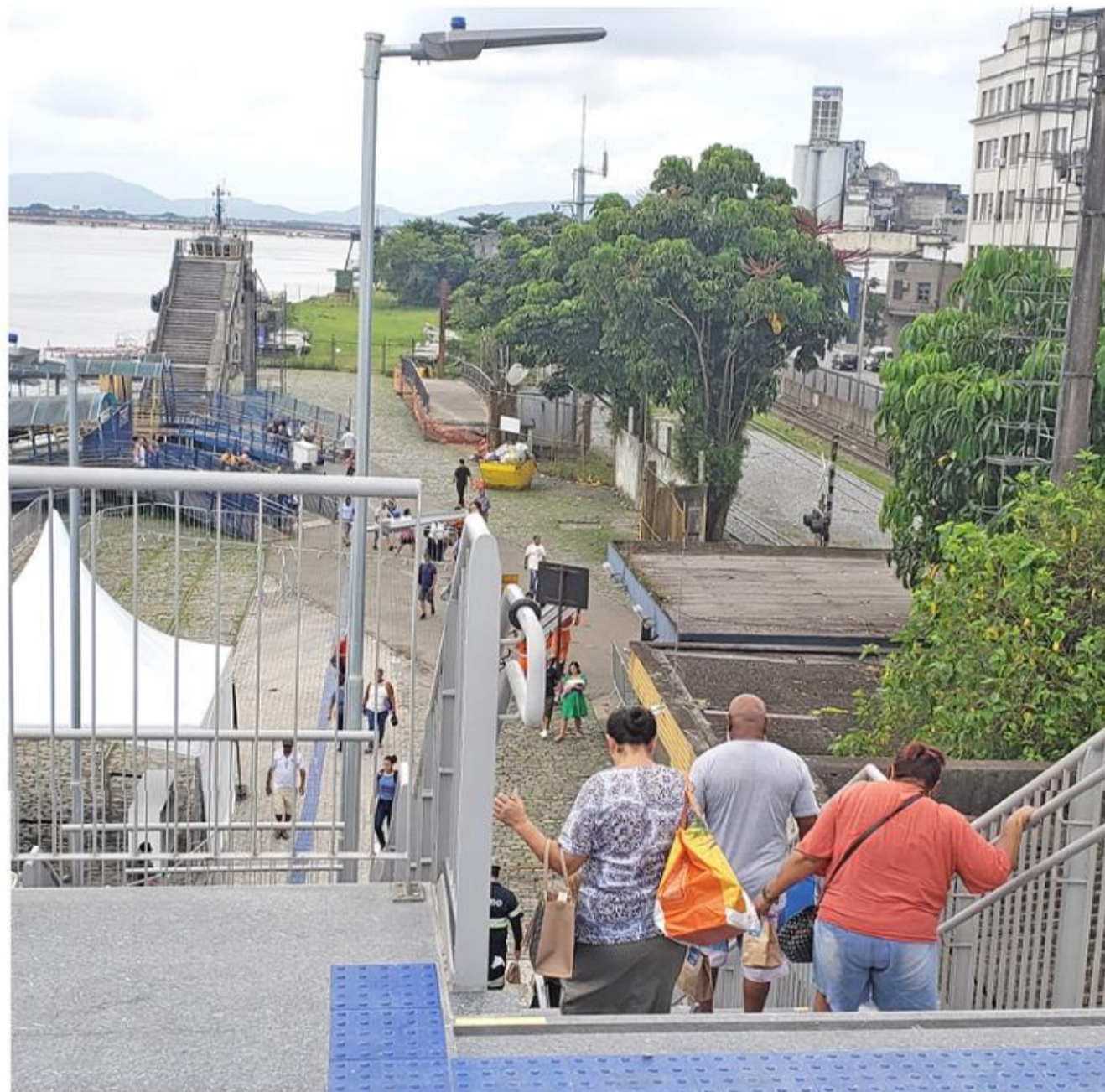
Passarela de pedestres que leva à travessia de barcas entre Santos e Guarujá vem sendo desaprovada por grande parte da população

A Prefeitura e a Rumo já alegaram que a SPA responde pela passarela. A SPA informa que não elaborou o projeto, mas somente analisou suas possíveis interferências nas atividades do Porto e que ele foi submetido aos órgãos municipais pertinentes, incluindo o Conselho de Defesa do Patrimônio Cultural de Santos (Condepasa).