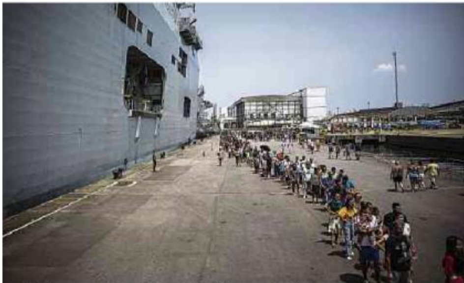
Navio gigante da Marinha atrai milhares de visitantes no porto de Santos (SP)

Cartas para al. Barão de Limeira, 425, São Paulo, CEP 01202-900. A Folha se reserva o direito de publicar trechos das mensagens. Informe seu nome completo e endereço