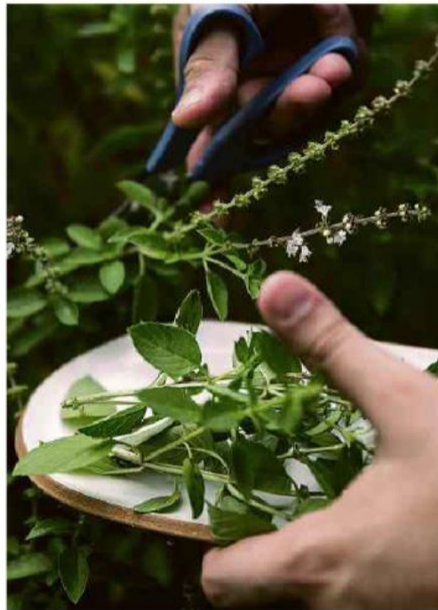
Horta com temperos na cozinha de pesquisa e inovação do restaurante Mocotó, em São Paulo.

comida C8 Chefs no Brasil seguem tendência e investem em ciência buscando renovação