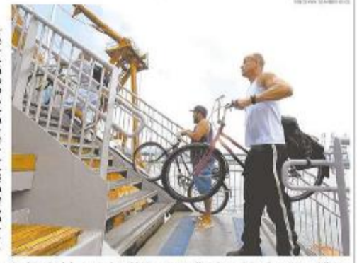
Canaletas planejadas para condicionar bicicletas na estação de que a via, de acordo com ciclistas

REPORTAGEM Uma solução para facilitar a travessia de barcas entre Santos e Vicente de Carvalho tem causado muitas reclamações. Inaugurada há dez dias, a passarela no local da Alfândega de Santos não tem agradado aos usuários. São queixas de sobre o elevador que não funciona, a escadaria íngreme e as canaletas que serviram para que ciclistas conduzissem bicicletas — mas esse dispositivo não atende a quem precisa de ajuda para subir e descer. O jeito é subir devagar, com a ajuda de porteiros que podem, eventualmente, abrir os portões de acesso à estação ou, no caso das bicicletas, carregá-las nos trens. Para isso, algumas pessoas pagam extras.