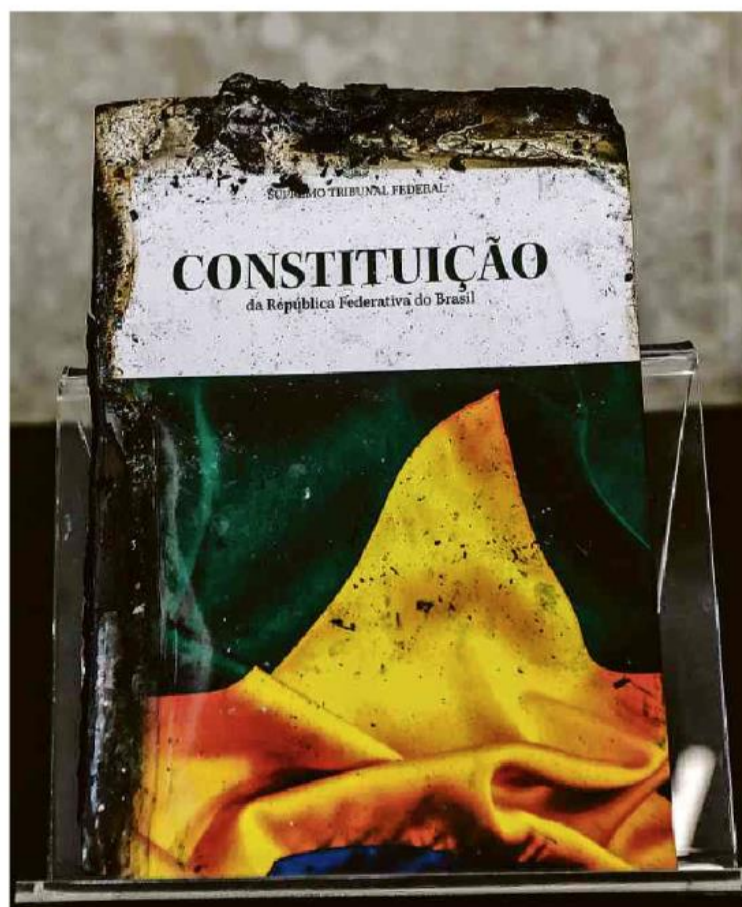
Constituição queimada por golpistas é exibida no STF, ainda em reforma.