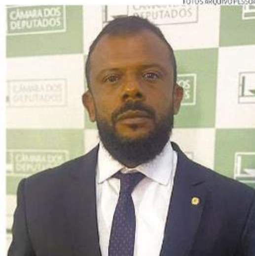
Da Cunha fala em segurança pública e em esporte