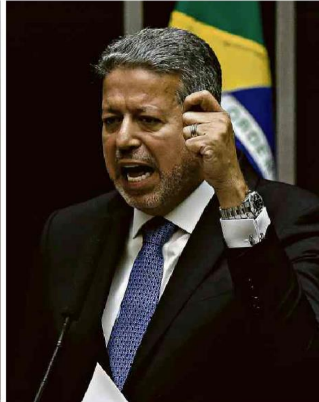
Votação recorde mantém Arthur Lira (PP-AL) à frente da Câmara.