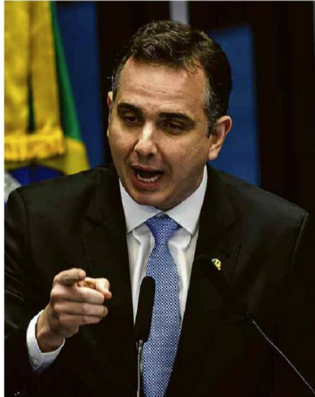
Rodrigo Pacheco (PSD-MG) foi reeleito para presidir o Senado.

No Senado, pesa o fato de Pacheco não ser unanimidade; na Câmara, a gestão do Orçamento é um complicador. Ao Executivo Lira propôs "não uma relação de subordinação, mas de pacto" para aprimorar as políticas públicas. Política A4 a A7