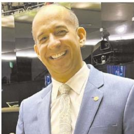
Barbosa diz que terá ligação seca como prioridade