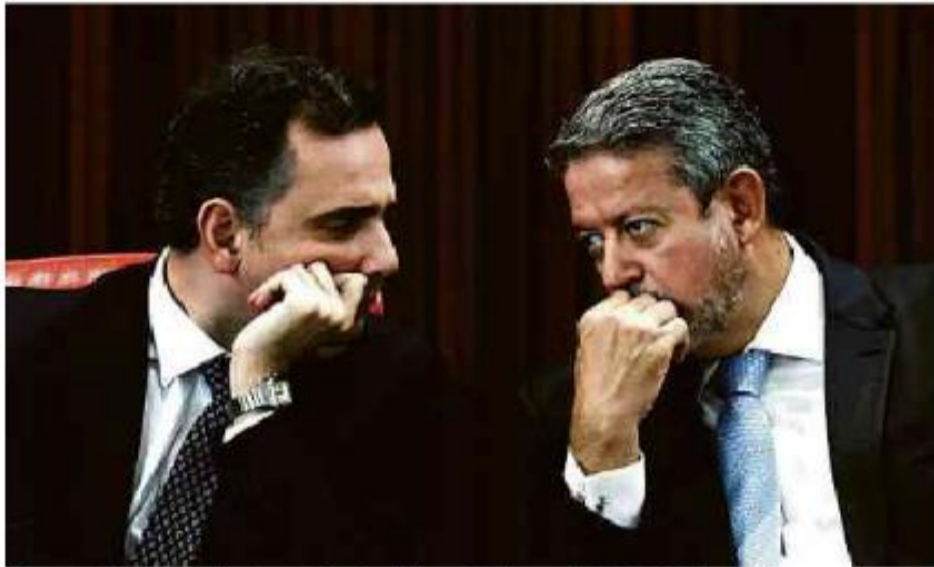
Os presidentes do Senado, Rodrigo Pacheco (PSD-MG), e Câmara dos Deputados, Arthur Lira (PP-AL), em Brasília

Cartas para al. Barão de Limeira, 425, São Paulo, CEP 01202-900. A Folha se reserva o direito de publicar trechos das mensagens. Informe seu nome completo e endereço