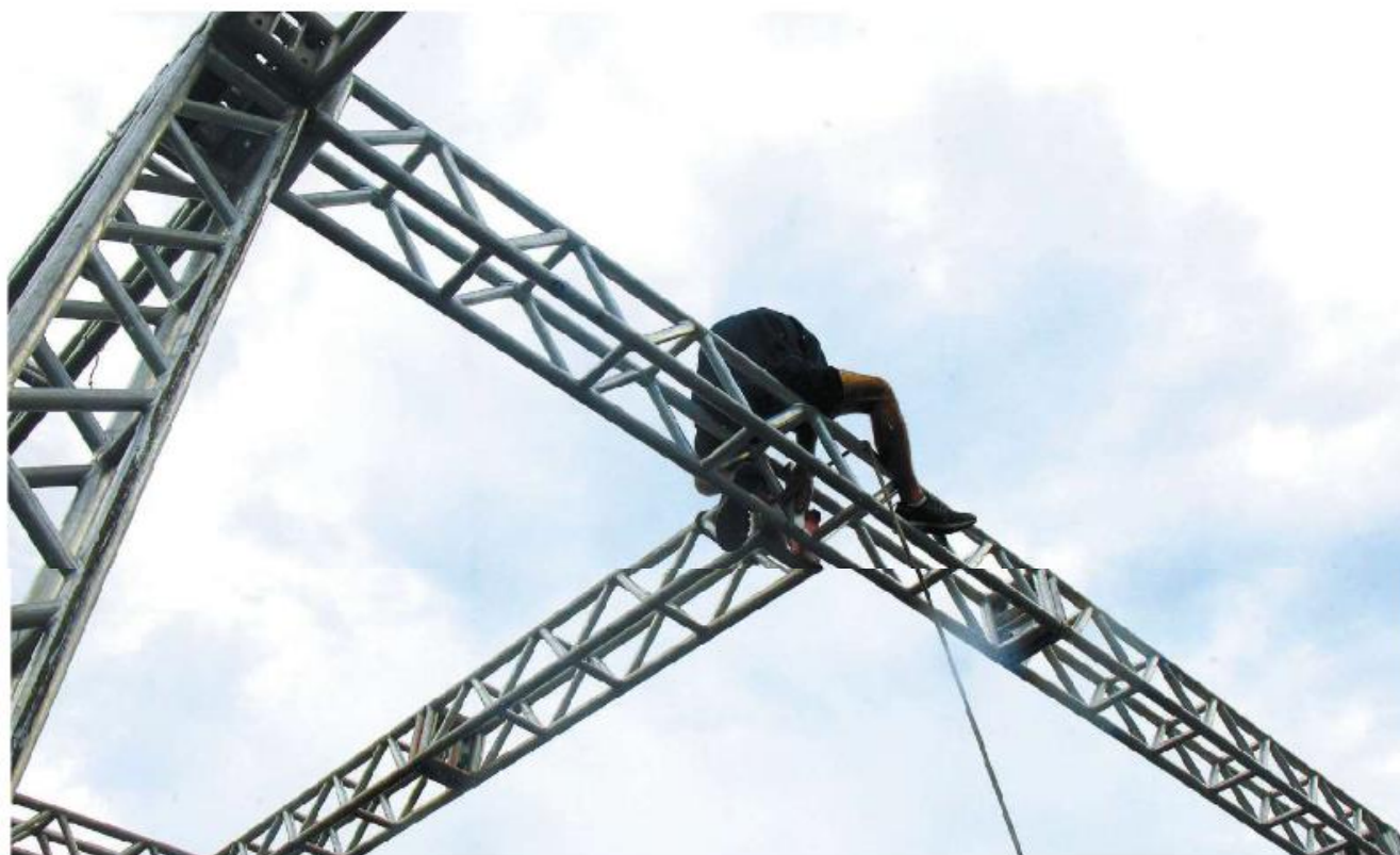
... que necessitam de mais atenção, como a revisão e a conferência do material utilizado. O desfile será na Avenida Afonso Schmidt, s/nº

Para crianças de até 2 anos, não há cobrança, mas os pais deverão retirar ingressos para elas.