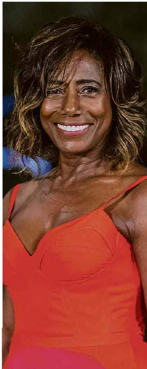
Glória Maria, como repórter, viajou por mais de cem países, cobriu guerra e entrevistou ícones

Depois de dois anos, festa para Iemanjá volta às ruas e praias de Salvador