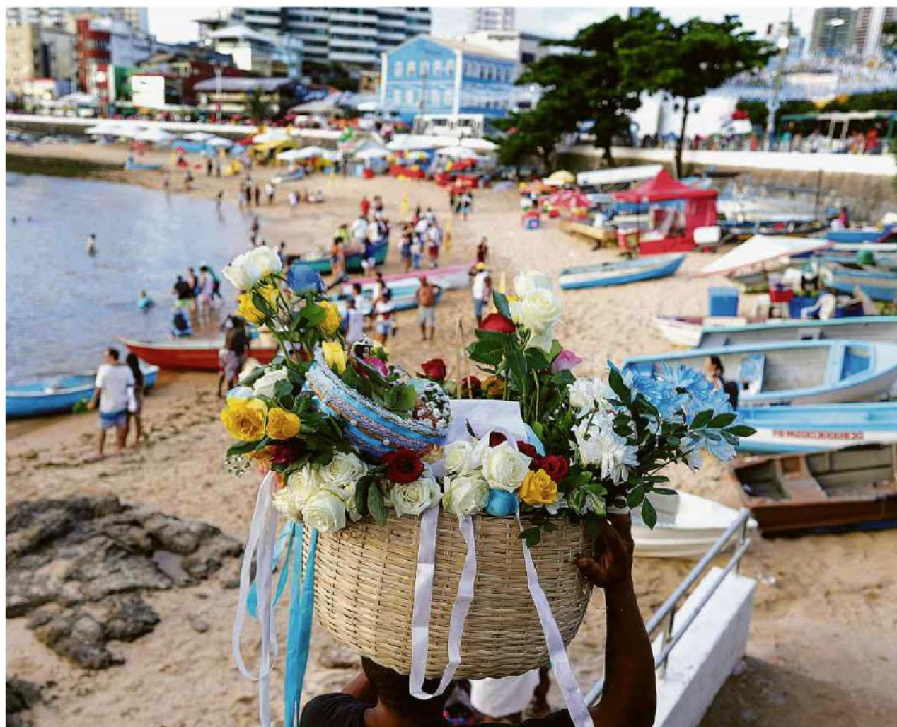
Oferecida de flores para Iemanjá em praia do Rio Vermelho, Salvador; em 2021 e 2022, pandemia restringiu a tradição, que fez cem anos

Foco nos líderes A respeito de denúncias do senador Marcos do Val.