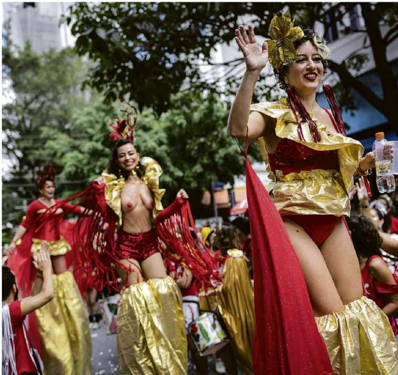
Mulheres festejando neste domingo (12) no bloco Confraria do Pasmado, que tomou as ruas do bairro de Pinheiros, na zona oeste de São Paulo

Somados, os partidos da base lulista chegam a 223 parlamentares. Mesmo que não haja divergências internas — algo improvável, como mostra o histórico —, o número ainda seria insuficiente para a aprovação de PEC (proposta de emenda à Constituição), que demanda 308 votos, ou mesmo de projetos de lei complementar (257 votos). Política A6