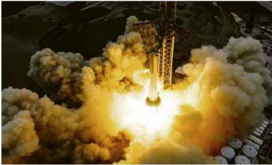
Disparo estático de 31 motores do Super Heavy B7 da SpaceX, primeiro estágio do veículo Starship SpaceX

Cartas para al. Barão de Limeira, 425, São Paulo, CEP 01202-900. A Folha se reserva o direito de publicar trechos das mensagens. Informe seu nome completo e endereço