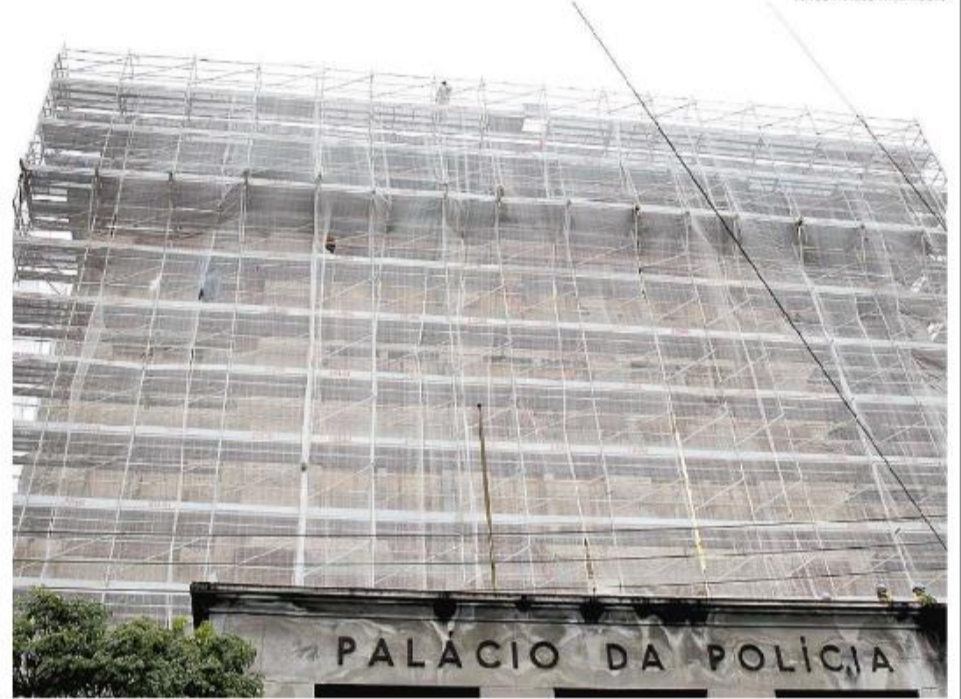
Policiais lotados no prédio alegam estar expostos a condições insalubres desde o início das obras

O prédio foi interditado em fevereiro de 2021, a pedido do Sindicato dos Delegados da Polícia Civil (Sind-