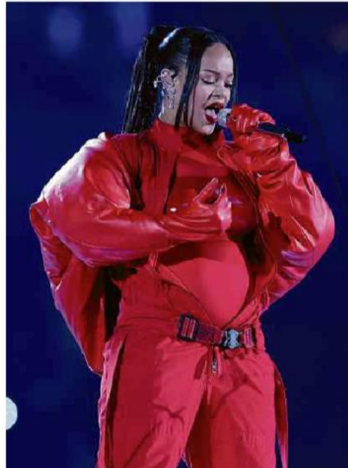
Grávida pela 2ª vez, Rihanna se apresenta no intervalo do Super Bowl, no Arizona (EUA)

Como A24, estúdio de 'Pearl', empilha indicações no Oscar e é xodó de cinéfilos