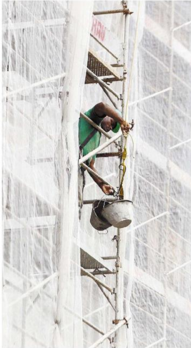
Mais de 70 pessoas trabalham na reforma, que custa R$ 10,2 milhões