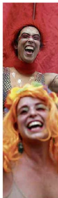
Pré-Carnaval do bloco Bastardo na zona oeste 11.fev.23