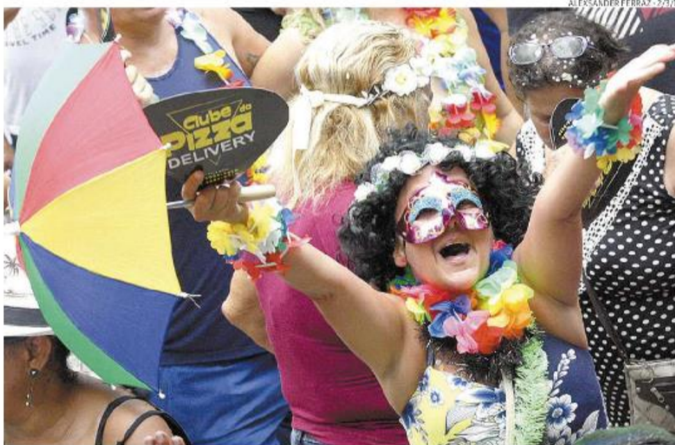
Festa começa amanhã, ao meio-dia, com mais uma edição do Carnabonde, que chegará à 21ª edição

com mais uma edição do Carnabonde. O evento, em sua 21ª edição, fará da Praça Mauá um autêntico baile à moda antiga, repleto de foliões, a partir do meio-dia. A entidade homenageada será o Clube Sírio-Libanês, que promoveu bailes e matinês durante décadas no Gonzaga. A partir das 15h30, o bon-