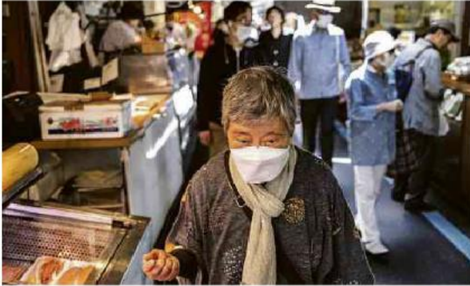
Mulher idosa caminha por mercado de rua no distrito de Tsukiji, em Tóquio Charly Triballeau - 22.abr22/AFP

Cartas para al. Barão de Limeira, 425, São Paulo, CEP 01202-900. A Folha se reserva o direito de publicar trechos das mensagens. Informe seu nome completo e endereço