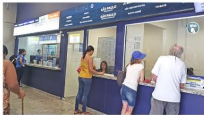
Já foi confirmada a partida de mais de 80 veículos extras

A Estação Rodoviária efetuou, no período correspondente à primeira semana de fevereiro, 1.407 partidas, embarcando 25.512 pessoas. Dessa maneira, a previsão é de que mais de 33 mil pessoas passem pelo local no período de carnaval.