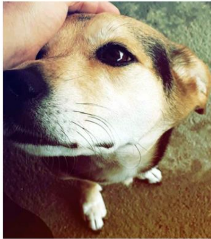
NAIR BUENODIÁRIO DO LITORAL

Em 2020, Furtado encaminhou para todos os deputados estaduais da Baixada Santista e para os demais parlamentares que atuam na causa animal um requerimento solicitando o empenho junto ao então governador João Dória para que