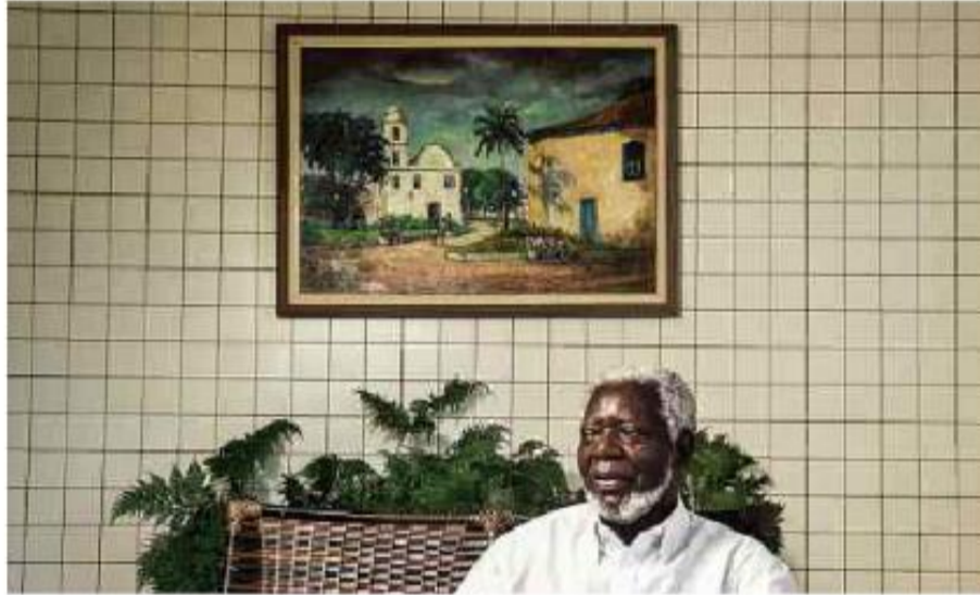
O antropólogo e professor Kabengele Munanga durante entrevista para a Folha em Itanhaém (SP)

Cartas para al. Barão de Limeira, 425, São Paulo, CEP 01202-900. A Folha se reserva o direito de publicar trechos das mensagens. Informe seu nome completo e endereço