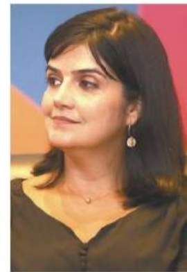
Audrey: youtubers concorrem