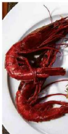
Crustáceo é pescado por apenas um barco no Brasil.

Aposta de baixo risco A respeito de proposta de Lula para a paz na Ucrânia.