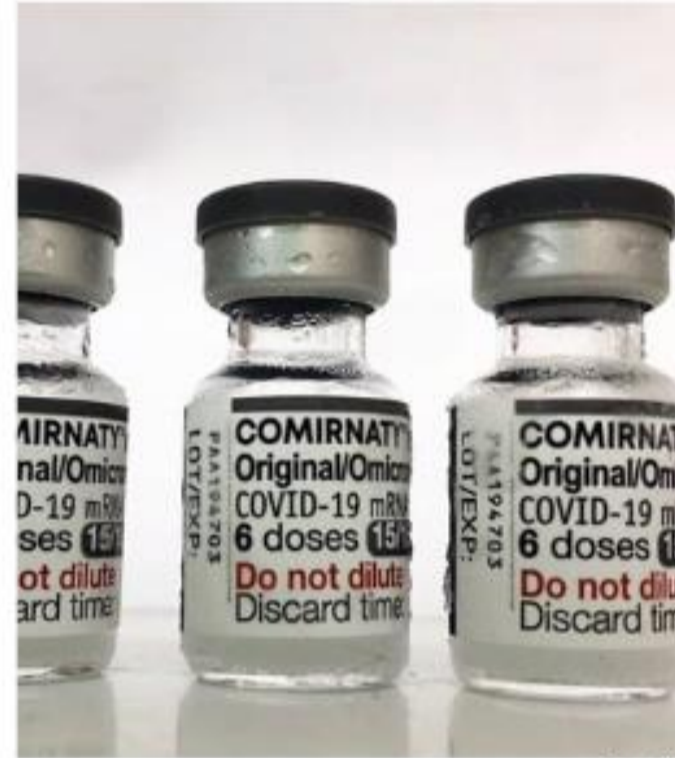
Em Santos, as policlínicas aplicam o imunizante de segunda a sexta

São Vicente começou a aplicar a vacina Bivalente no último sábado (25), no posto fixo de vacinação do Brisamar Sho-