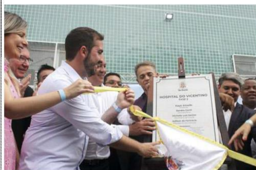
WABER/IMAGEM DO LITORAL

Os ovos de Páscoa sempre são mais caros do que barras de chocolate. As empresas dizem que o custo para fazer é bem maior. Em nota a Abicab (Associação Brasileira da Indústria de Chocolates, Amendoim e Balas) diz que "Os ovos passam por um processo de produção de alta complexidade com custos de fabricação superiores, além disso, são embalados manualmente e as próprias embalagens são maiores e mais sofisticadas do que as de chocolates de linha regular". SEU DINHEIRO/A5