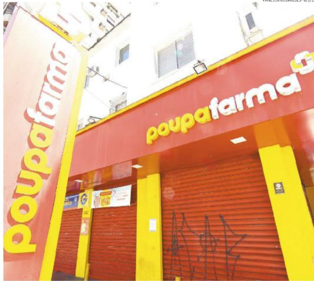
Lojas fecharam em fevereiro. Apesar de a rede não confirmar, dezenas de funcionários foram demitidos