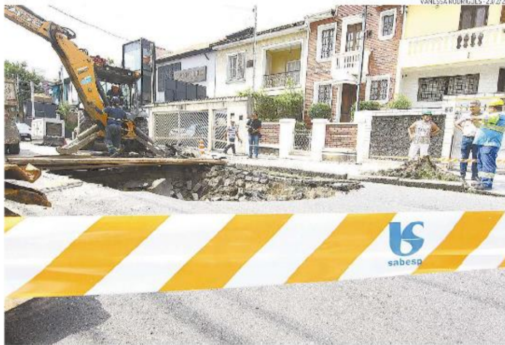
Já fechado, buraco surgiu na via, na altura do número 50, no Boqueirão, no dia 23 último. Motoboy se feriu

“Está prevista contratação de obra para recuperação definitiva deste coletor de esgoto, que não passou por intervenção em 2022. Atualmente, estão sendo feitos estudos para definição de estratégia e das tecnologias a serem implantadas para minimizar os