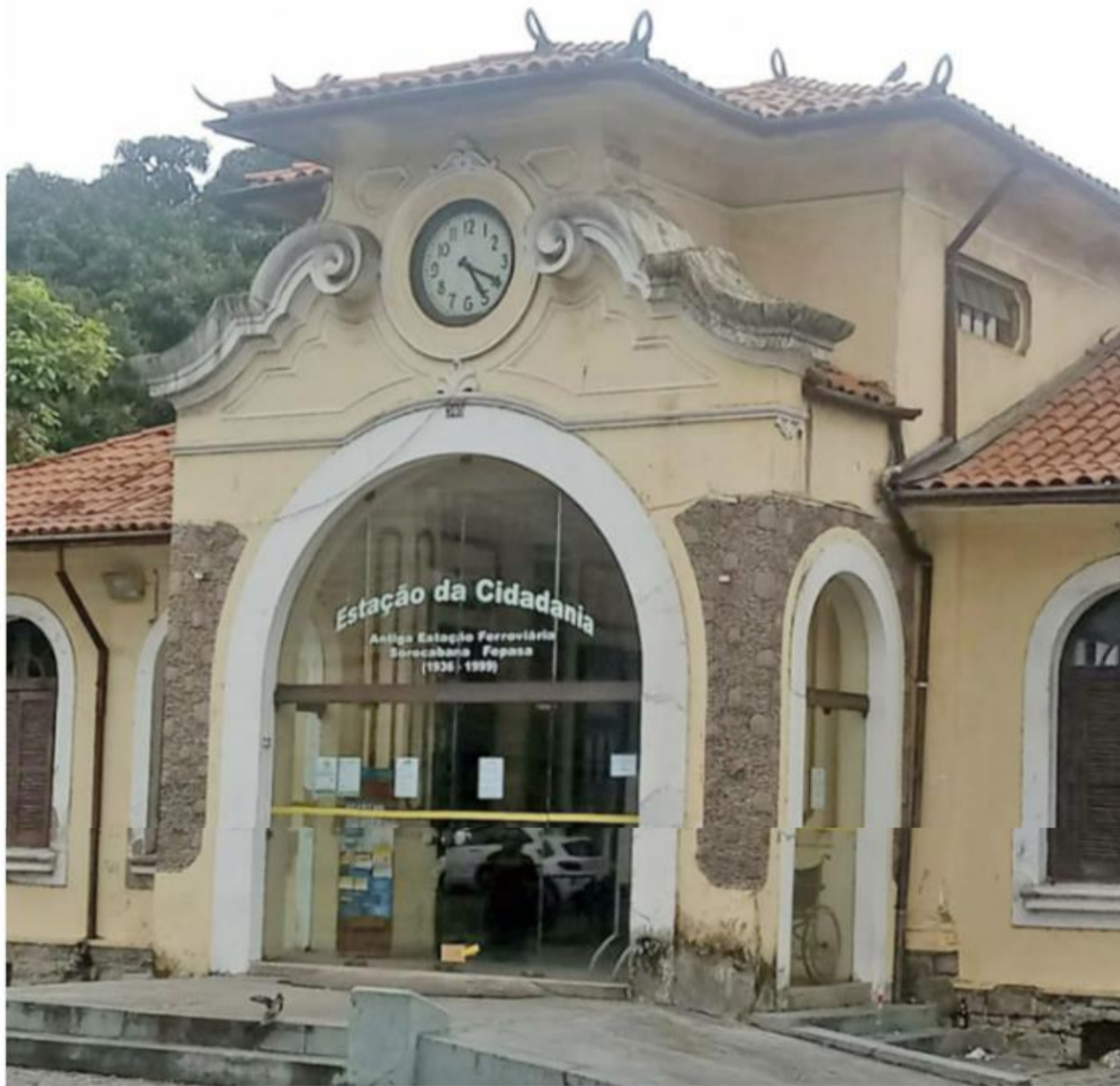
A Estação Cidadania de Santos se tornou uma referência para debates na Baixada Santista e hoje será palco das mulheres

Organizado pela Frente Feminista da Baixada Santista, o ato contará com a participação de mulheres artistas da região, com microfone aberto e espaço para que as mães tra-