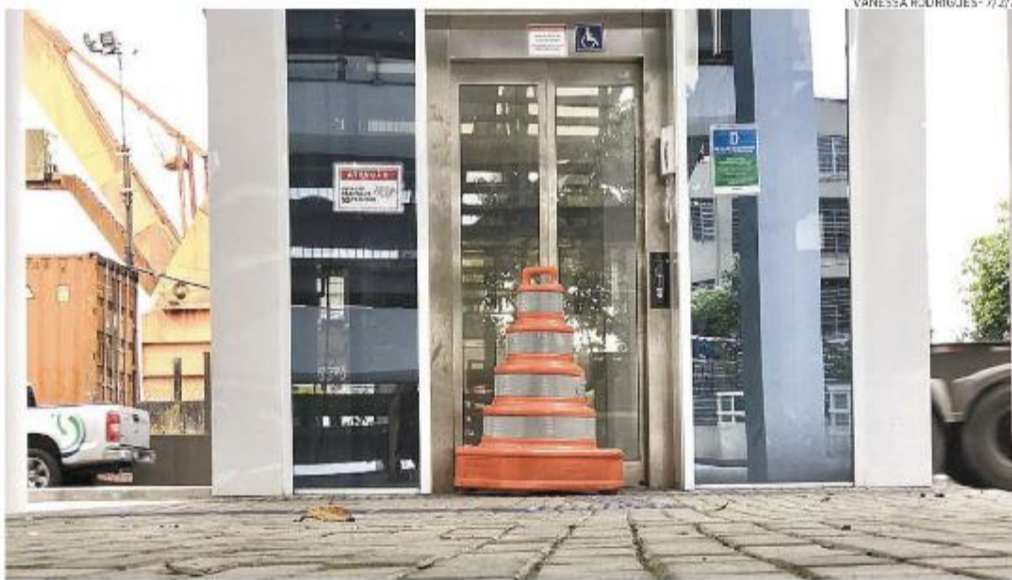
Cerca de dez pessoas ficaram presas no equipamento da passarela para as barcas, que já tinha falhado

O elevador, por exemplo, parou de funcionar menos