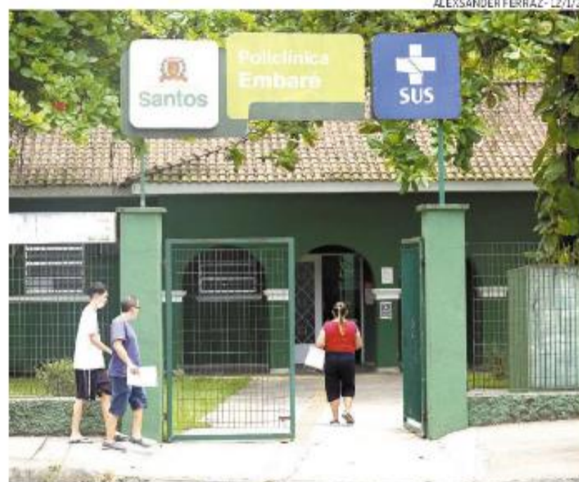
Unidade do Embaré, em Santos, é uma das que oferecem iniciativas

Na Policlínica Bom Retiro, haverá, durante o mês, coleta de preventivo, solicitações de mamografia, orientações de planejamento familiar e uso da TV corporativa para vídeos educativos referentes à saúde da mulher.