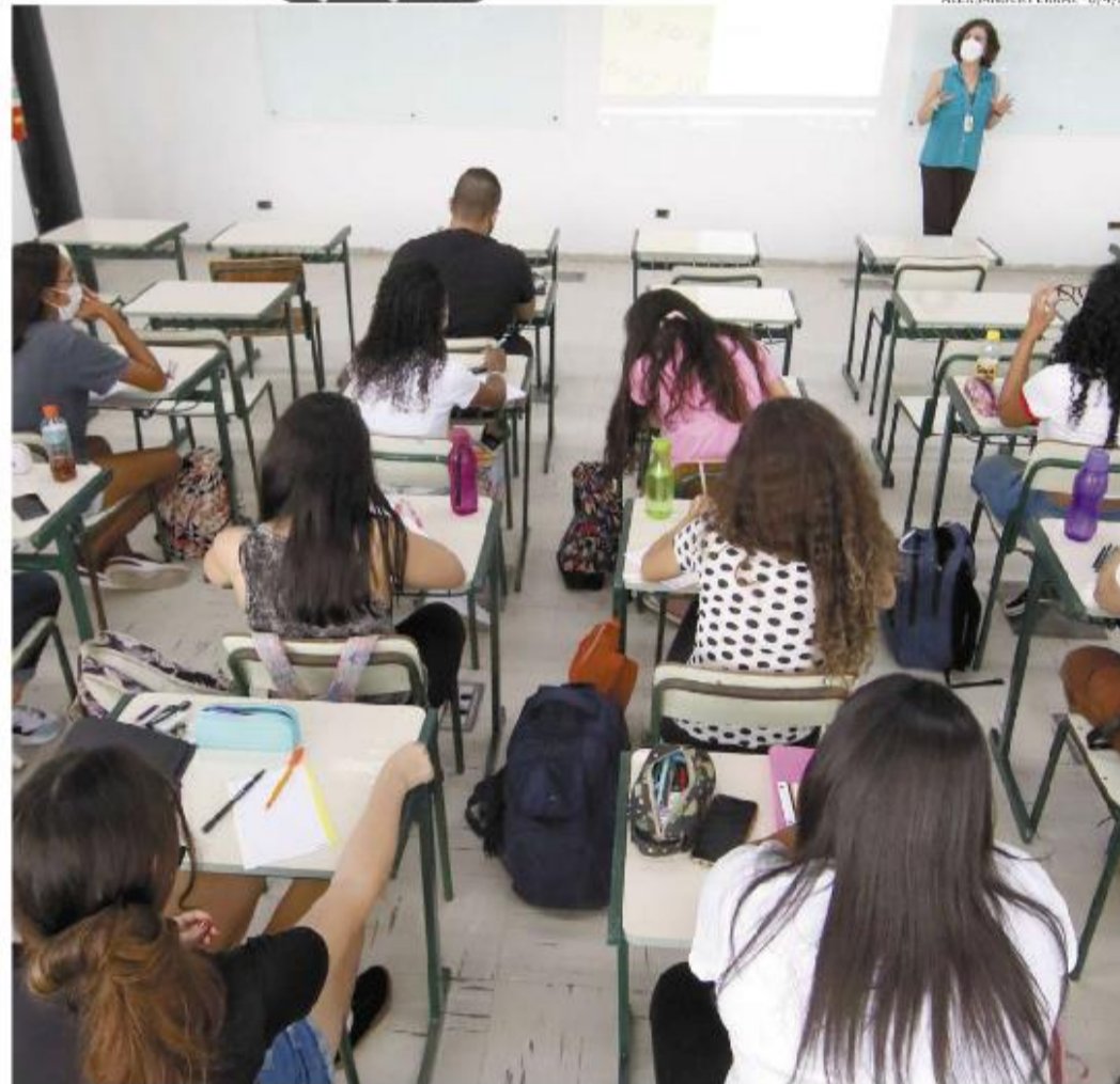
Estudo também mostra que as mulheres são 58,4% dos alunos no Ensino Superior e 47% dos professores

dos professores nas instituições de Ensino Superior do País em 2021 eram mulheres, aponta o Semesp