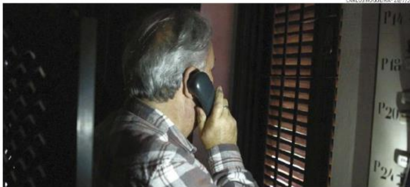
Centro presta serviço voluntário de apoio emocional e prevenção do suicídio, sob sigilo e anonimato

por e-mail com nome completo e RG. No curso, são transmitidos conceitos como respeito, confiança e o sigilo, que é a base do trabalho para atender os que ligam pelo 188.