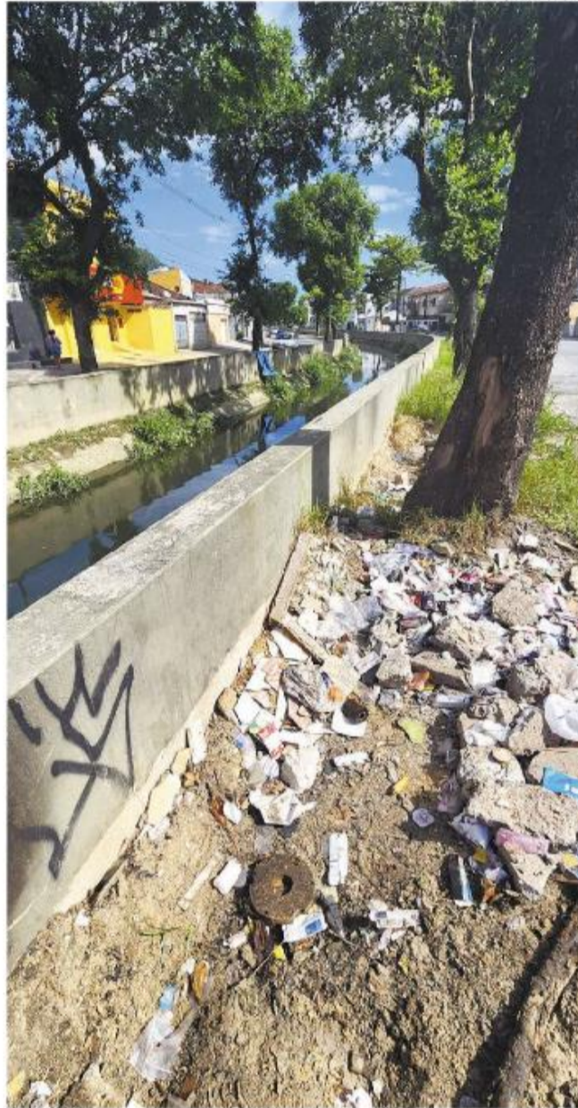
Calçada da chamada Linha Vermelha: piso quebrado, lixo, entulho

As instalações serão nestes locais: Avenida Castelo Branco, Pompeba, Dique do Piçarro, Dique das Caixetas, Rio dos Bugres, Sambaiatuba e Jóquei Clube.