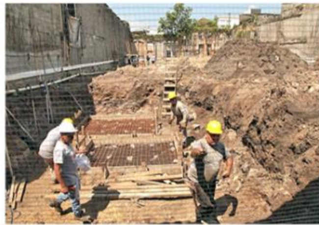
Fundações foram iniciadas no terreno da Rua São Francisco, 413

O empreendimento contará com quatro unidades habitacionais para PCD (Pessoa com Deficiência) e três apar-