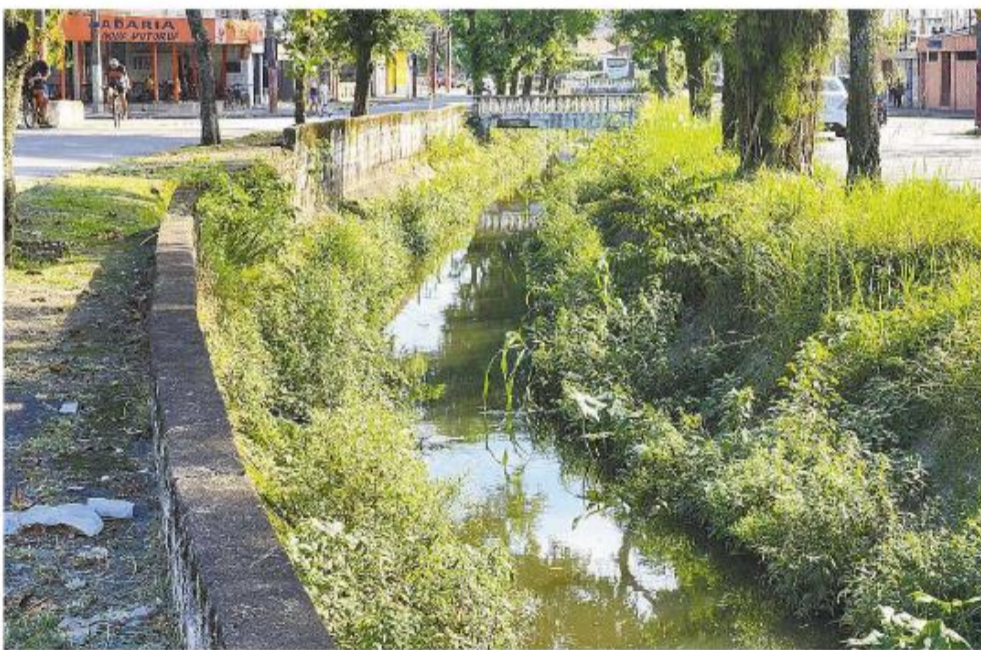
Tomado pelo mato, canal é exemplo do mau estado geral da avenida. Prefeitura prepara nova licitação

Também será realizado serviço de recuperação dos taludes do canal da Avenida