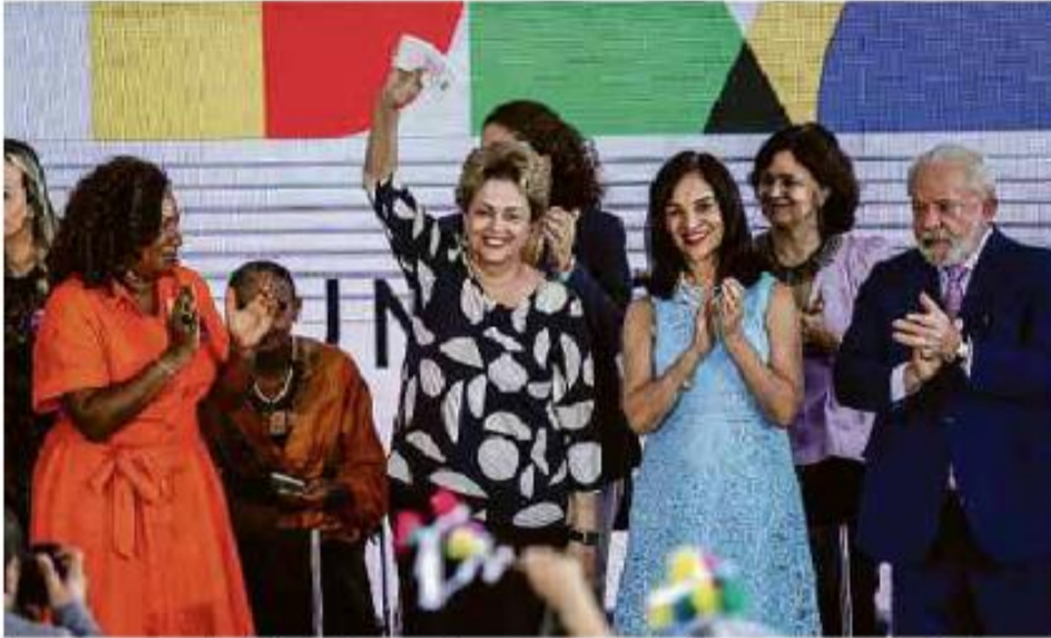
A ex-presidente Dilma Rousseff e o presidente Lula em cerimônia de celebração do Dia Internacional das Mulheres

Cartas para al. Barão de Limeira, 425, São Paulo, CEP 01202-900. A Folha se reserva o direito de publicar trechos das mensagens. Informe seu nome completo e endereço