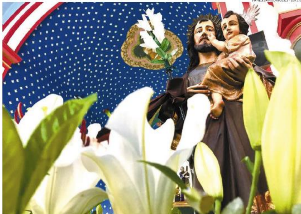
José era parte da Sagrada Família e acolheu Maria e Jesus — que, para os cristãos, foi gerado pelo Espírito

A paróquia em sua homenagem completará cem anos em 2025, e a