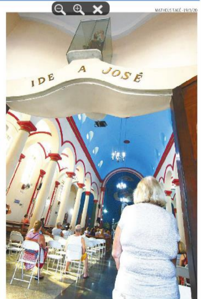
Novena termina no dia 18, após nove missas e orações às 19 horas

“A cada dia, receberemos um padre da Diocese na pa-