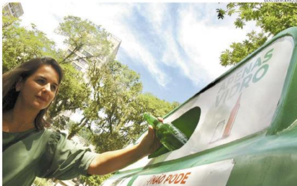
Primeiro espaço para recolhimento foi aberto ontem, na Praça Mauá, com capacidade para uma tonelada

A coleta será realizada pela Verallia, fabricante de embalagens de vidros e bebidas, juntamente com a Masfix, empresa respon-