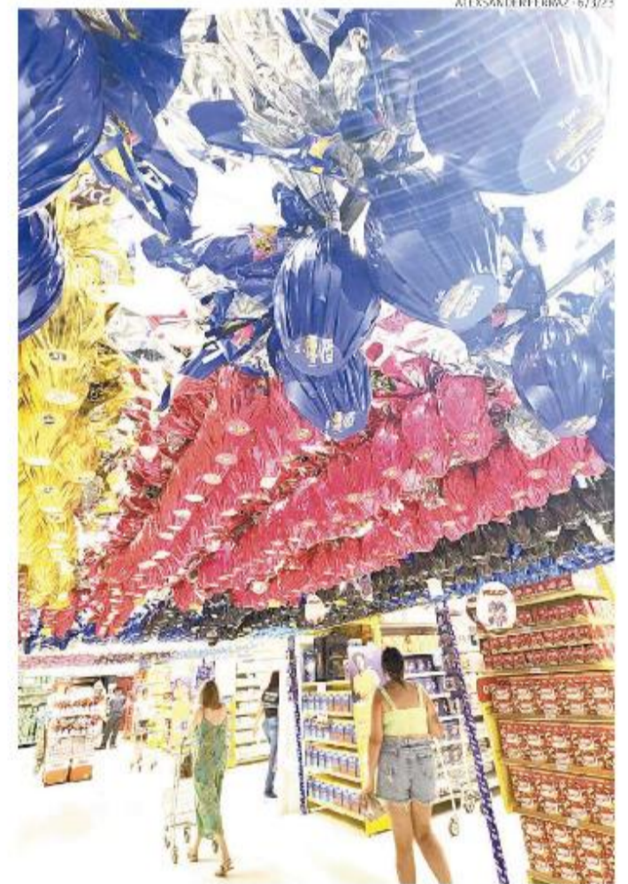
ALEXANDER FERREAZ - 6/3/23