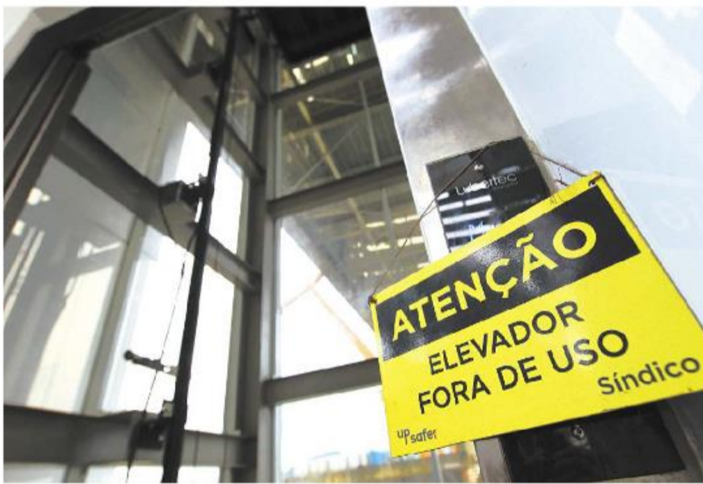
Paralisações programadas nos elevadores estão previstas para que o serviço funcione sem interrupções