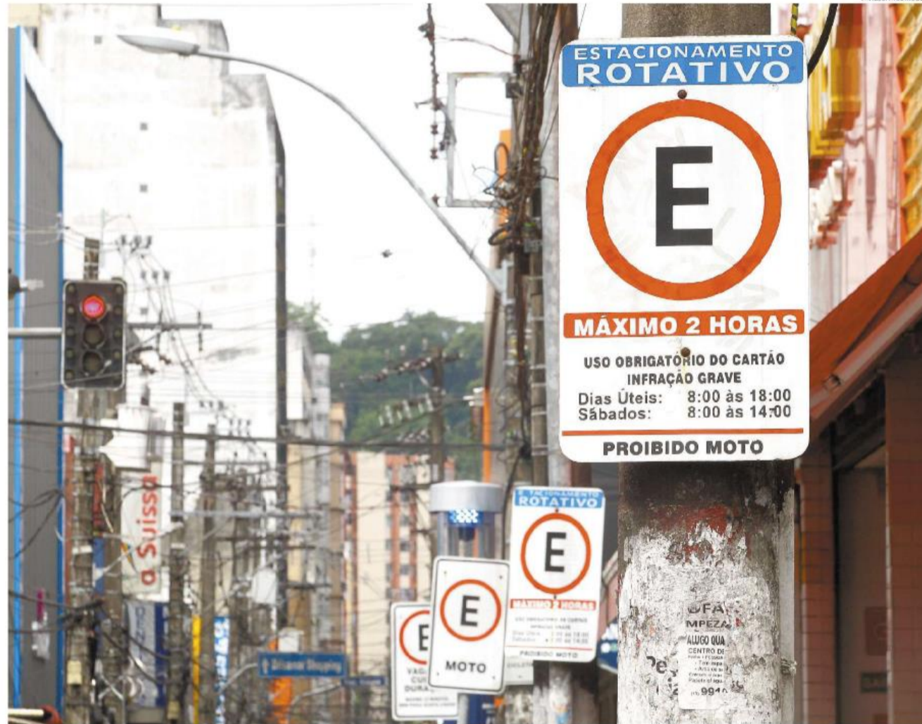
O processo de licitação para implantação do estacionamento rotativo foi suspenso. Os motoristas mais desavisados acabam se confundindo com as placas antigas nas ruas

Dois meses após a confirmação da empresa vencedora da licitação para implantação do estacionamento rotativo em São Vicente, a cidade ainda não conta com essa modalidade de vagas. Enquanto isso, motoristas que circulam pelo Centro estacionam sem qualquer restrição de horário ou tempo de permanência. Placas antigas chegam até a confundir os mais desavisados.