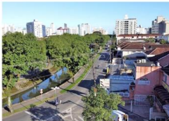
Avenida Pinheiro Machado é a via mais longa a ser contemplada

O canal 1, entre a Avenida Presidente Wilson e a Rua Antonio Bento de Amorim, é a via com maior extensão a ser beneficiada: 2.004 metros. O trecho será totalmente repavimentado. Na avenida, que corta os bairros José Menino, Pompela, Marapé, Campo