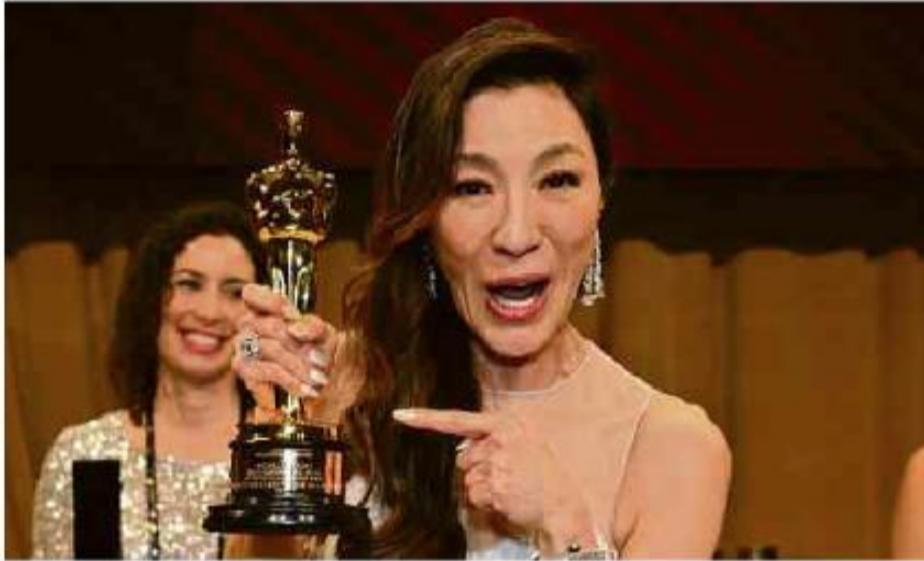
Michelle Yeoh exhibe seu Oscar de melhor atriz pelo filme "Tudo em Todo o Lugar ao Mesmo Tempo", que levou sete estatuetas

Cartas para al. Barão de Limeira, 425, São Paulo, CEP 01202-900. A Folha se reserva o direito de publicar trechos das mensagens. Informe seu nome completo e endereço