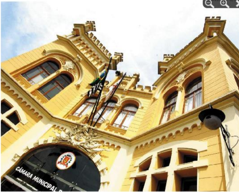
Câmara Municipal, na Vila Nova, é um dos pontos que, periodicamente, abrigarão trabalho de consultoria