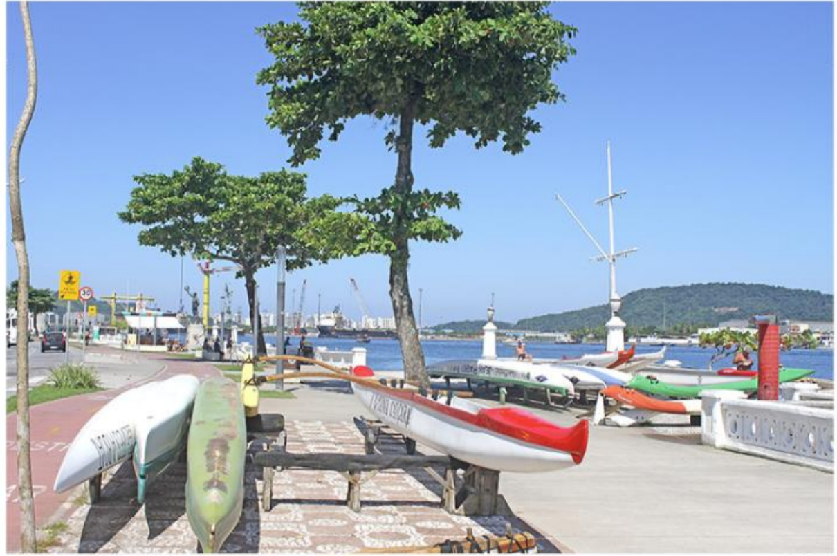
Canoas havaianas ocupam espaços enormes sem fiscalização alguma. Paulistanos deixam equipamento nas calçadas e vão para a Capital

arcar com eventuais despesas de segurança, vigilância e outras áreas comuns relativas às atividades desempenhadas no local, em forma de rateio.