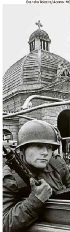
Soldado durante enterro de Pablo Neruda, morto dias após golpe no Chile em 1973