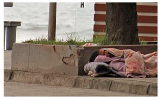
Em Santos, pessoas em situação de rua são retiradas pela Guarda, mas as canoas podem ficar atrapalhando o direito de ir e vir

Sobre essa questão, a Administração diz que nunca usou o direito constitucional para tirar