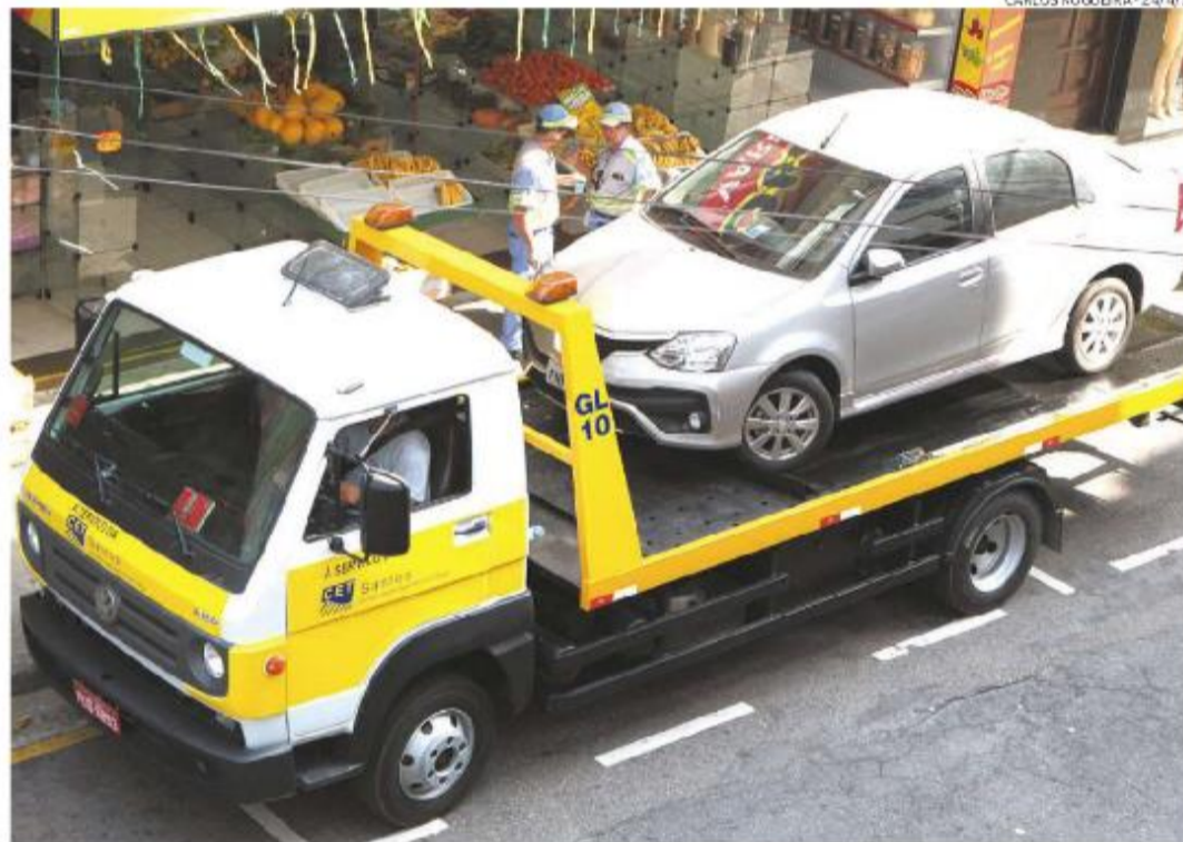
CET reajustou os valores dos serviços e novos preços, publicados ontem no Diário Oficial, já estão valendo

A terceira categoria engloba Kombis, caminhonetes,