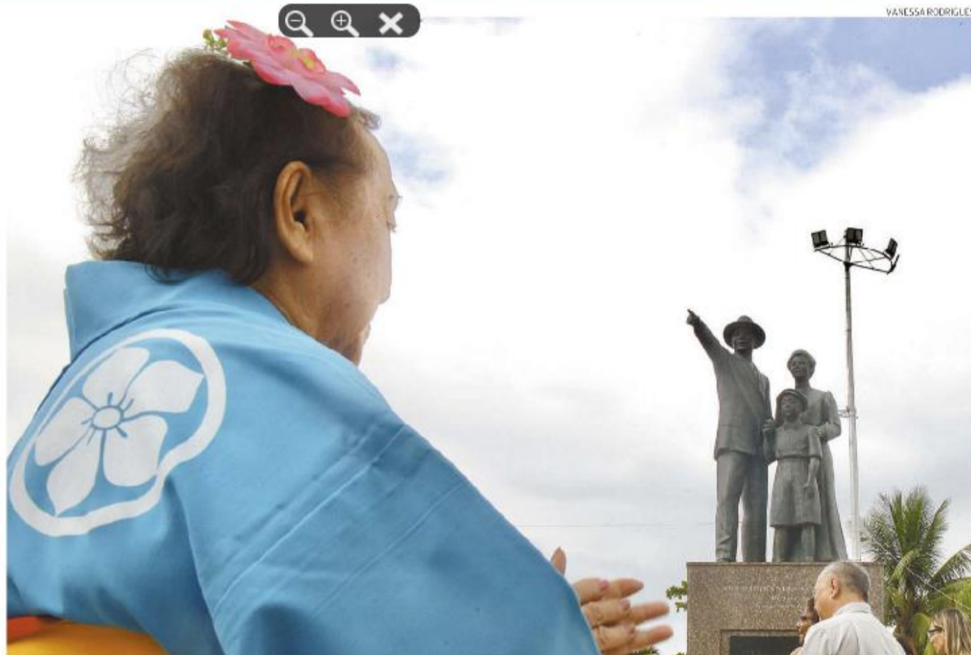
Em Santos, foi inaugurada ontem a Praça das Gerações, no Parque Roberto Mário Santini, no José Menino. Imigração japonesa fará 115 anos

A Praça das Gerações passa a abrigar o Monumento dos Imigrantes, que mostra uma família japonesa apontando para o Brasil, então