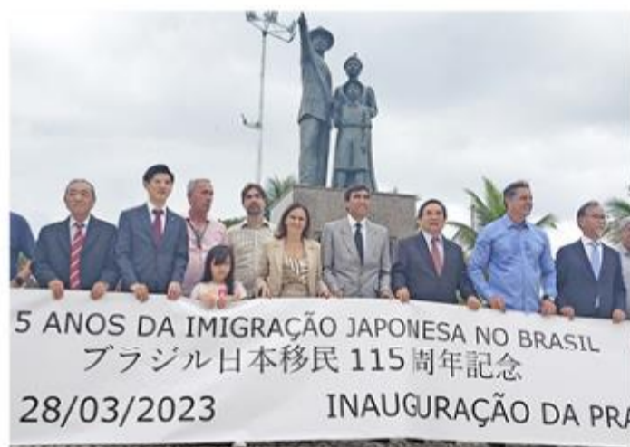
Praça das Gerações lembra 115 anos da imigração japonesa no Brasil

"Trata-se de uma homenagem com um belíssimo monumento em um dos lugares