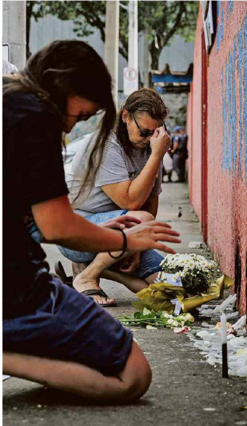
Mãe e filha, ambas ex-alunas da Escola Estadual Thomazia Montoro, prestam homenagem a vítima de ataque na segunda (27); agressor tentou comprar arma de fogo