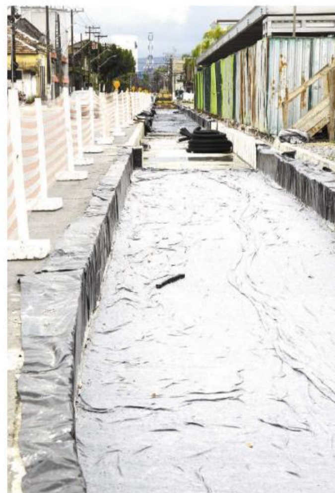
“Precisamos acelerar essa entrega”, diz chefe do Executivo sobre obra

A EMTU também confirmou que, desde dia 17, percorrem os trabalhos