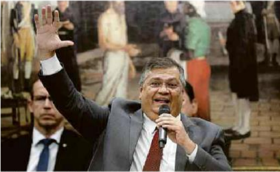
O ministro da Justiça, Flávio Dino, fala aos deputados da CCJ (Comissão de Constituição e Justiça) da Câmara dos Deputados

Cartas para al. Barão de Limeira, 425, São Paulo, CEP 01202-900. A Folha se reserva o direito de publicar trechos das mensagens. Informe seu nome completo e endereço