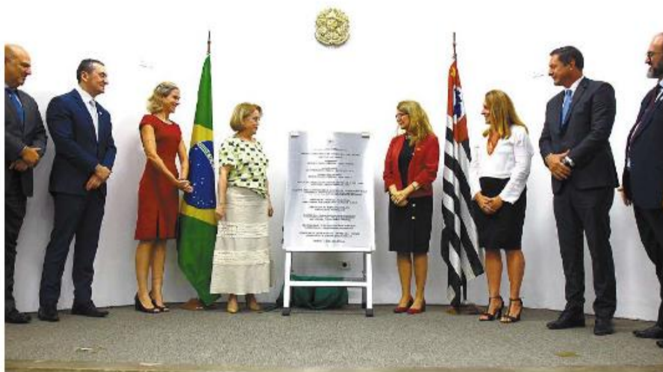
Central de Processamento Eletrônico (CPE) - Santos abrange desde ontem a 1ª Vara Federal vicentina

A unidade terá cinco seções: de Recebimento de Iniciais, Distribuição e Atendimento; de Triagem, Análise e Comunicação; de Expedição e Cumprimento; de Atos Ordinatórios e Ela-