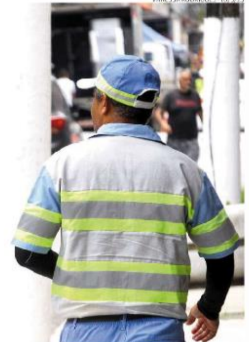
Multas de trânsito e repasse de custos operacionais pela Prefeitura foram as principais fontes de receita

tábeis reveladas ontem. São R$ 37,693 milhões em “passivo não circulante” — débitos, por exemplo, em encargos sociais e previdenciários e impostos e contri-