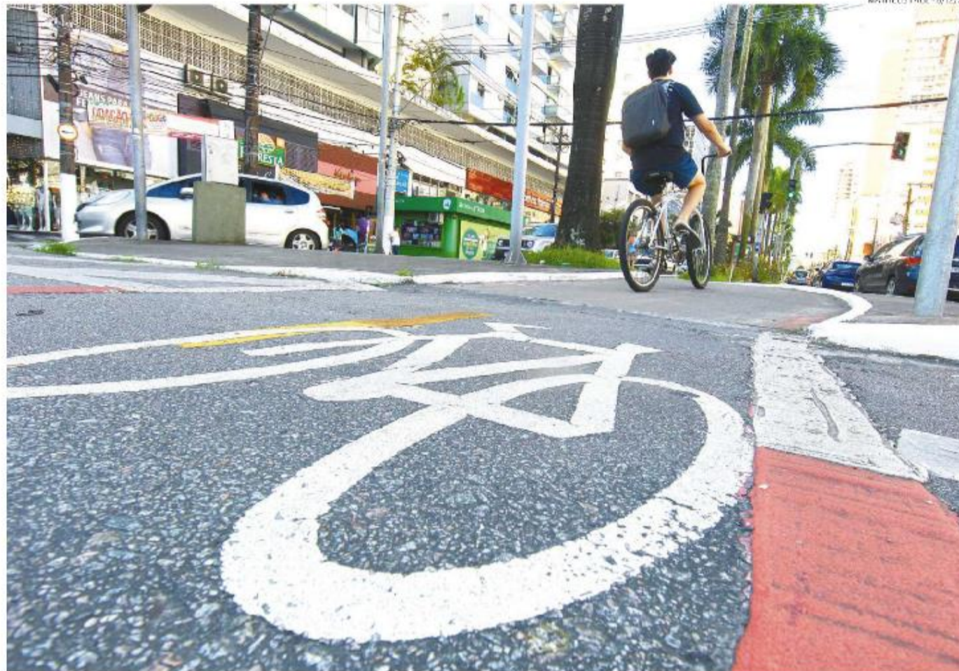
Estão previstos 21 programas, com 177 ações de infraestrutura e operação de mobilidade urbana. Área cicloviária terá maior número de medidas

São sugeridos, ainda, os chamados programas trans-