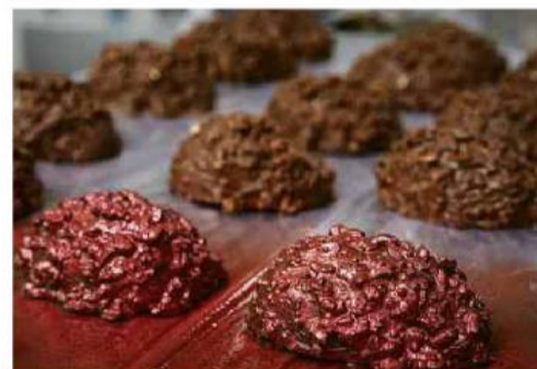
Ovos da fábrica Di Siena, em São Paulo