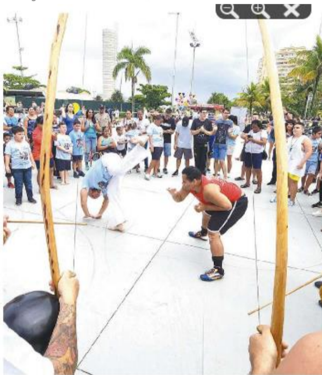
Diversas atividades, como capoeira, foram realizadas no evento ontem