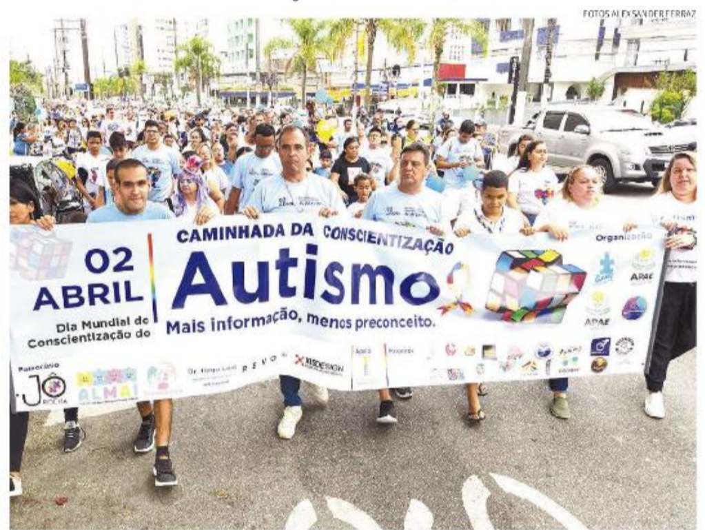
Participantes caminharam desde a divisa com São Vicente até o Parque Municipal Roberto Mário Santini

E quando o carinho vem com quatro patas? Os cachorros da raça golden retriever Mel e Boris são empregados na terapia para crianças. O pagamento vem em forma de uma for-