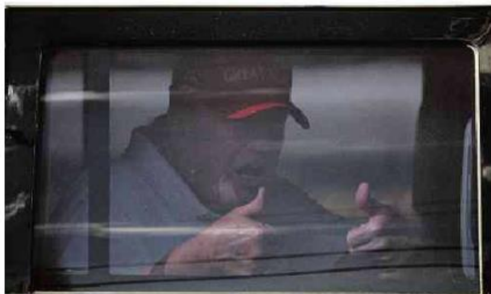
Donald Trump em sua limusine ao deixar o Trump International Golf Club em West Palm Beach, na Flórida

Cartas para al. Barão de Limeira, 425, São Paulo, CEP 01202-900. A Folha se reserva o direito de publicar trechos das mensagens. Informe seu nome completo e endereço