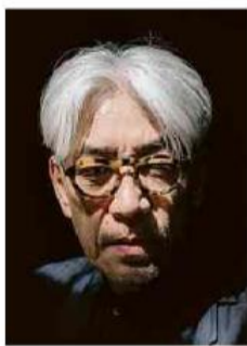
O músico Ryuchi Sakamoto, em foto de 2018

Uma queda de braço entre Globo, Google e Meta sobre o financiamento do jornalismo é o principal entrave para o projeto de lei das fake news, prioridade do governo. A Globo e outros veículos defendem negociação direta com plataformas por pagamento de conteúdo. As big techs discordam. Política A6