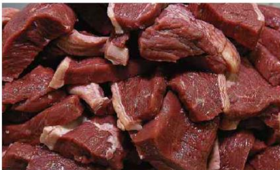
Picanha cortada em forma de bifês, em São Paulo (SP); leitores comentam gasto ilegal de verba da Covid

Cartas para al. Barão de Limeira, 425, São Paulo, CEP 01202-900. A Folha se reserva o direito de publicar trechos das mensagens. Informe seu nome completo e endereço