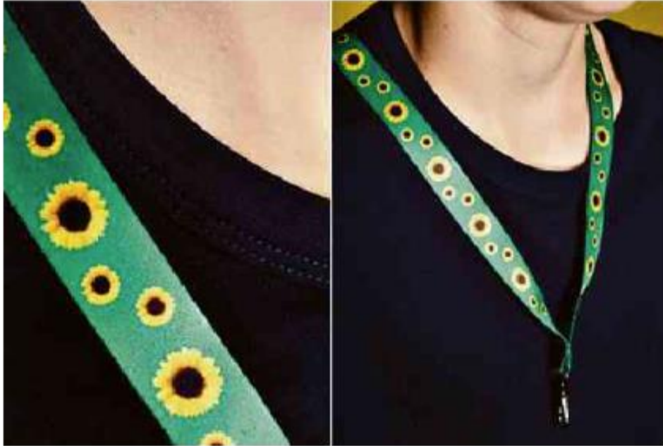
Cordão verde com girassóis é usado para identificar uma pessoa com deficiência "invisível"

Cartas para al. Barão de Limeira, 425, São Paulo, CEP 01202-900. A Folha se reserva o direito de publicar trechos das mensagens. Informe seu nome completo e endereço