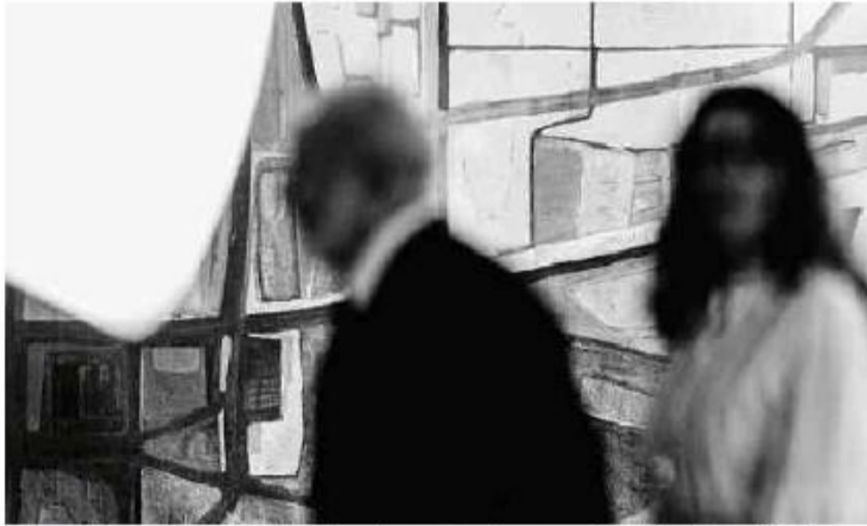
O presidente Lula e a primeira-dama Janja em cerimônia dos oficiais gerais recém-promovidos, no Palácio do Planalto

Cartas para al. Barão de Limeira, 425, São Paulo, CEP 01202-900. A Folha se reserva o direito de publicar trechos das mensagens. Informe seu nome completo e endereço