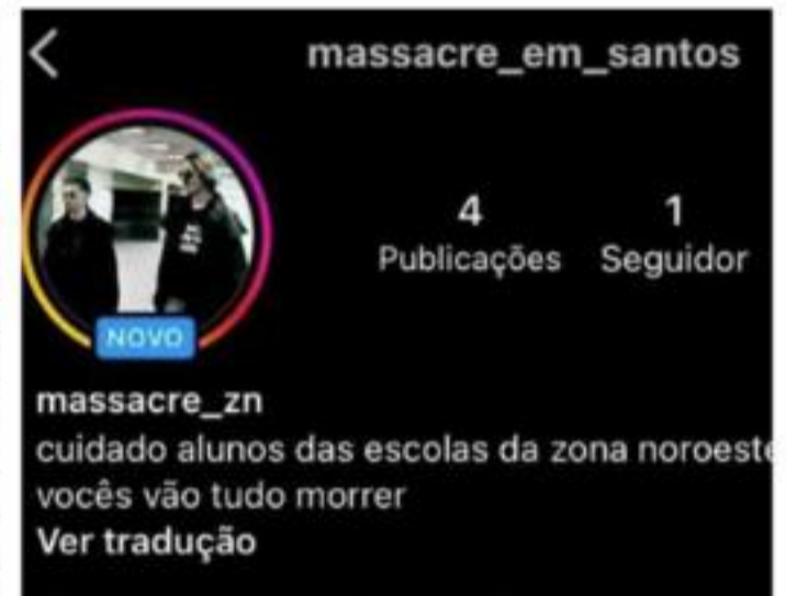
Reprodução Autor das ameaças afirma que estudantes deveriam tomar cuidado

A Reportagem também buscou a Secretaria de Educação do Estado, mas não obteve resposta até o fechamento desta edição. (LG Rodrigues)