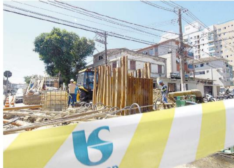
Prefeituras criticam possibilidade de privatização da companhia, mas reclamam da qualidade do serviço

“A Sabesp já tem boa parte do seu capital privado: 49,7% privado e 50,3% público. Quando você discute privatização, discute controle. Isso não significa que o Estado vai sair completamente da Sabesp, que o Estado não vai ter participação relevante, sem manter voz dentro da empresa. A