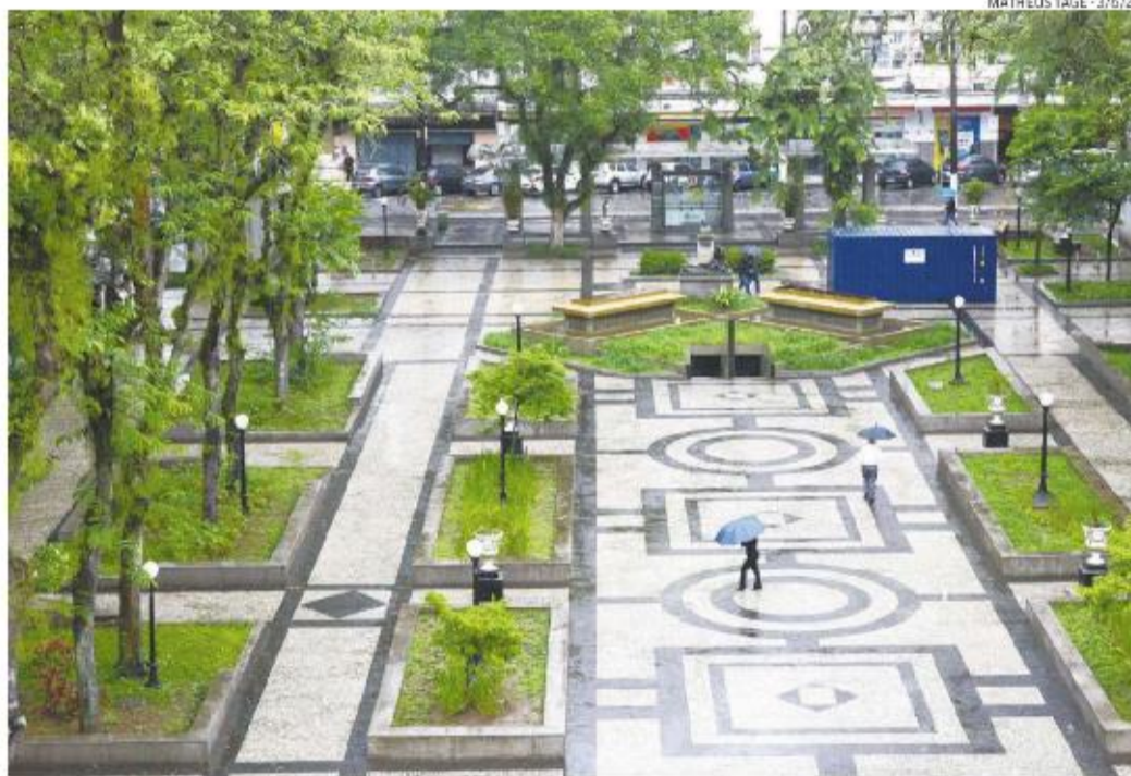
MATHEUS TAGÉ - 3/5/22

Mais de 30 locais estão mapeados, segundo o secretário, para que haja a estruturação do wi-fi gratuito. É o caso de pontos como as praças Independência e Mauá, a orla, a Lagoa da Saudade, no Morro Nova Cintra, o entorno do Horto Municipal, o Aquário, o Orquidário Municipal e locais